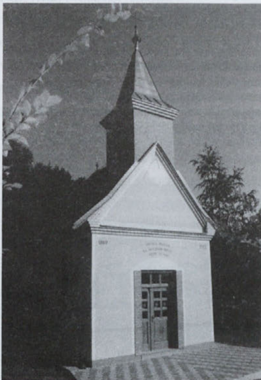
Nova Tuševa kapela v Polencih