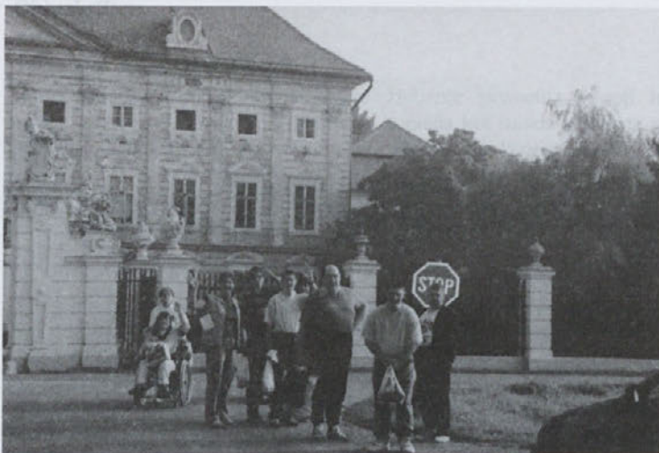
4. september – selitev