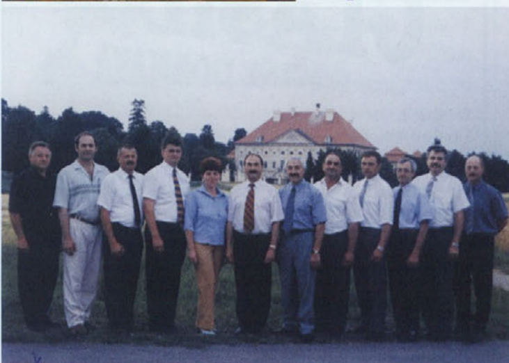
Občinski svet občine Dornava v letih od 1998 do 2002, skupaj z županom in občinsko upravo. HVALA ZA SODELOVANJE.