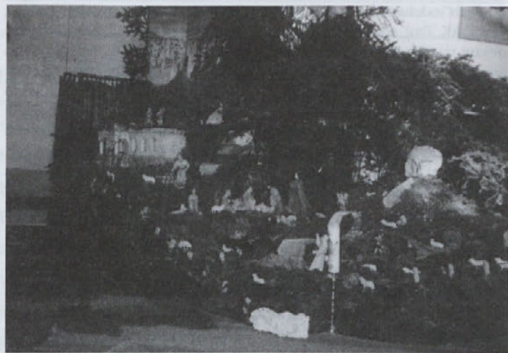
Jaslice 1991 na Polenšaku