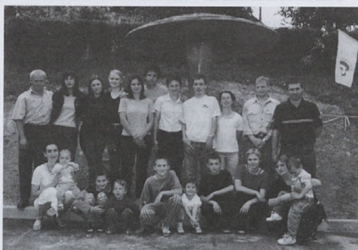
Mladi Žamenčani na srečanju