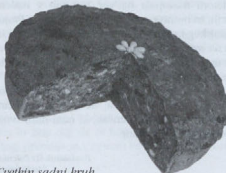
Cvetkin sadni kruh