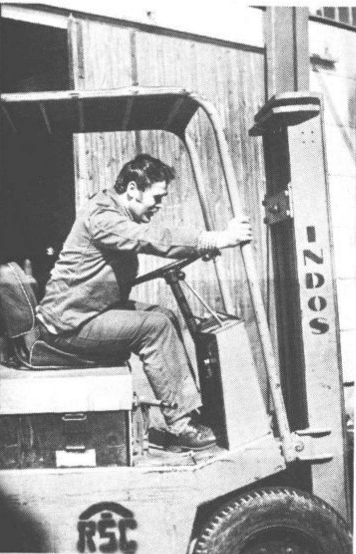
Enakopravno se vključujejo v združeno delo

Vsekakor se je vseh 52 invalidov in ostalih udeležencev razšlo s posveta v prepričanju, da smo storili prvi temeljni korak, ki bo v korist in zadovoljstvo invalidom in vsem ostalim članom z željo, da se v okviru doseganja pravic in obveznosti vsi člani invalidi in neinvalidi enakopravno in enakovredno vključujemo v naše skupno delo in življenje.