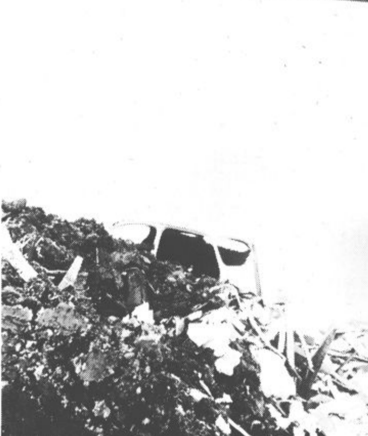
Poleg smeti se najde tudi „ogrodje“ kakšnega fička