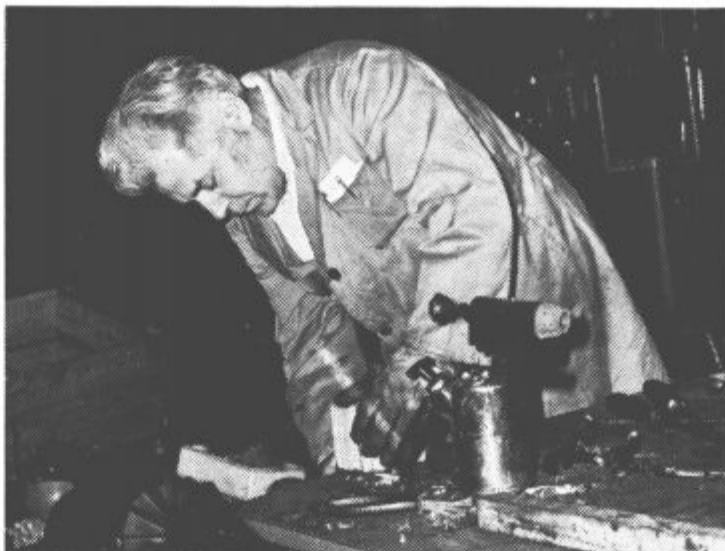
Invalid pri delu