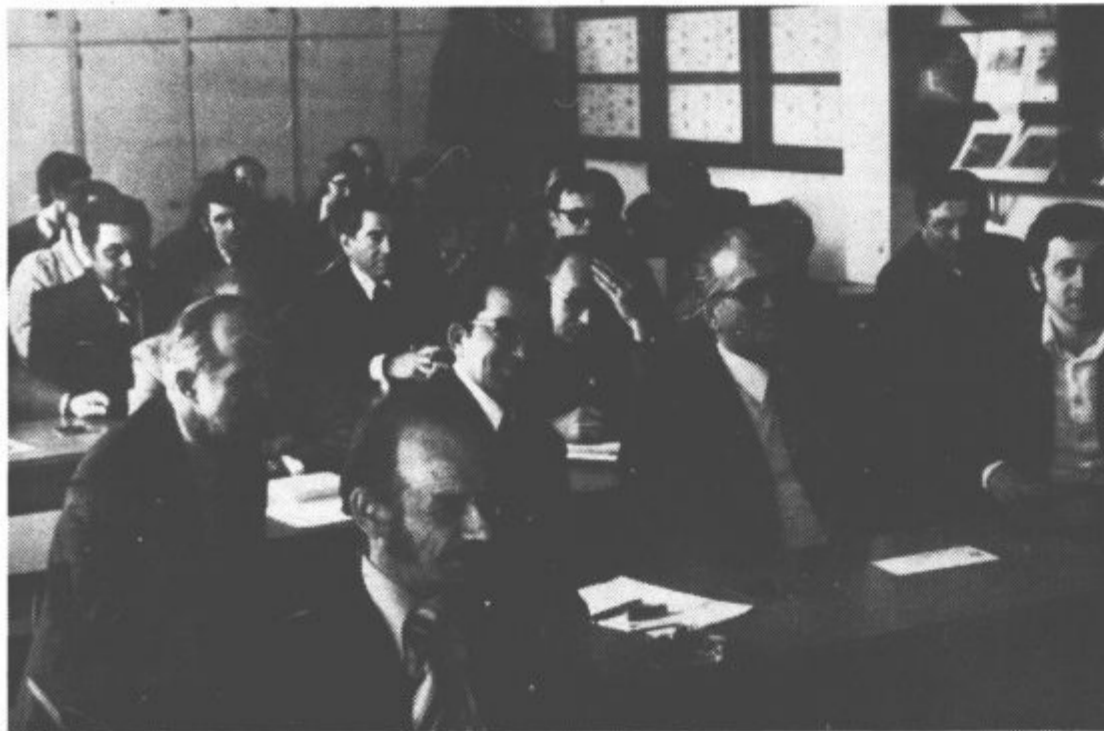
Letne skupščine so se udeležili tudi predstavniki republiške zveze za tehnično kulturo in sosednjih organizacij