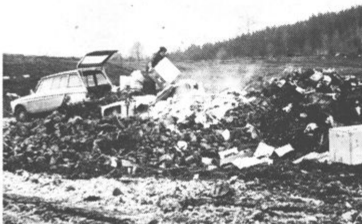
Vprašanje lastniku amija na sliki: kako bi se počutili, če bi nekdo iz Škal stresel nesnago pred vaša vrata!?

Pa še nad nečem se razburjajo krajanje Škal v tem času. Ob obvozni cesti namreč vztrajno nastaja novo smetišče, katerega graditelji so neznani in znani (spisek teh bo kmalu dobil sodnik za prekrške), občani, ki so se v teh dneh skrbno lotili spomladanskega čiščenja stanovanj in vrtov, nekateri tudi zelenic, vso nesnago s podstrešij in kleti pa stresajo kar ob cesti Jezero-Hrastovec, kot lastnik Amija na sliki.