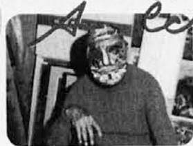
razstava ob stoletnici rojstva v Kulturnem centru Lojze Bratuž v Gorici