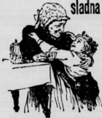
Stara mati, se meni!

Že leta sem izpričano izvrstna priredn k bobovi kavi. Pri živčnih, srcnih, ledolodnih boleznih, pri pomanjkanju krvi etc. zdravniško priporočena. — Najprijetljivejša kavina pijača v stotisočere ragovinah.