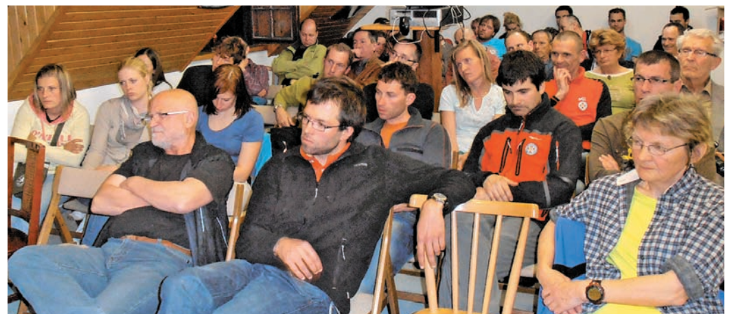
Člani AO Kamnik so pazljivo prisluhnili poročilom