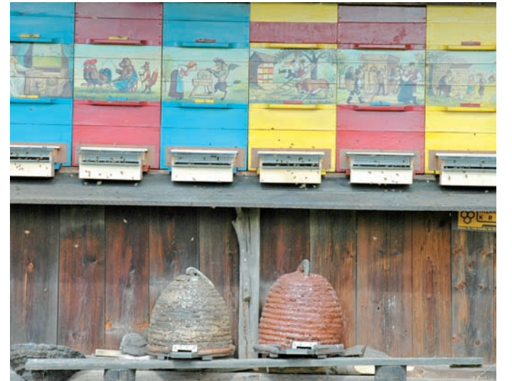
Veliko pozornost posvečajo ne le rastlinam, ampak tudi živalskemu svetu. Še posebej otroci radi opazujejo marljive čebelice, kako pridno nabirajo cvetni nektar in ga nosijo v barvite panje s panjskimi končnicami in pletena panja.