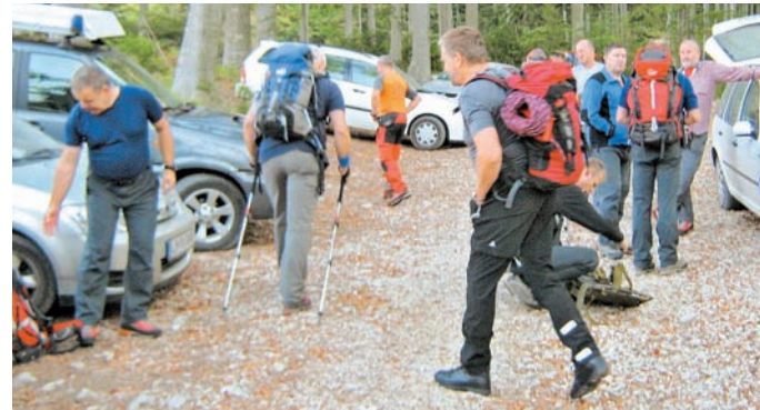
Na intervencije se morajo reševalci sedaj odpraviti s svojimi avtomobili.