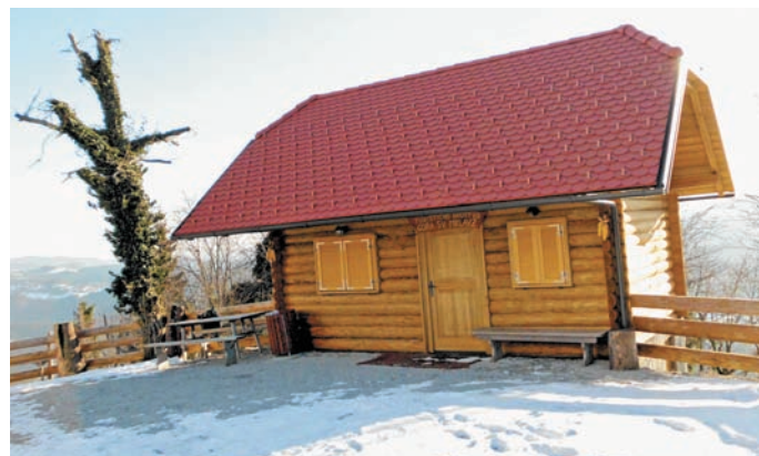
Novo zgrajena kašča.

V preteklih letih smo obnovili skoraj vse objekte, čaka nas še obnova strehe na meznariji.