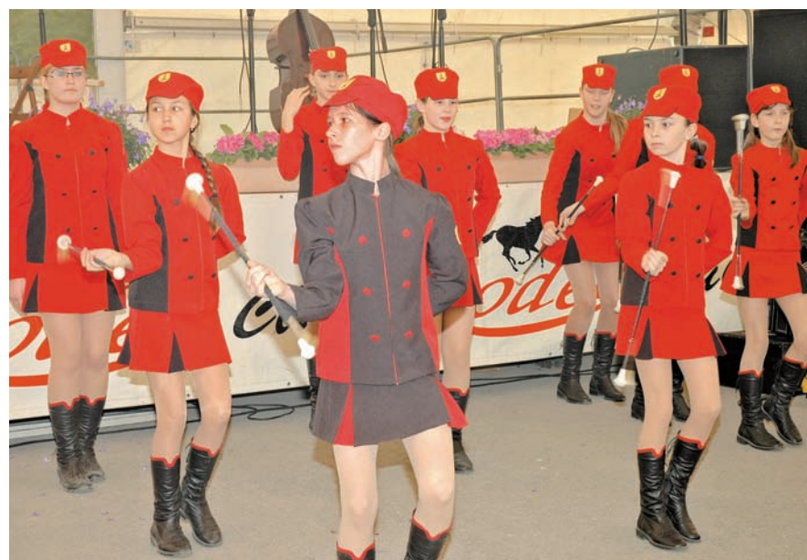
Odprtje sejma je zaznamoval tudi nastop mažoretk iz Komende.