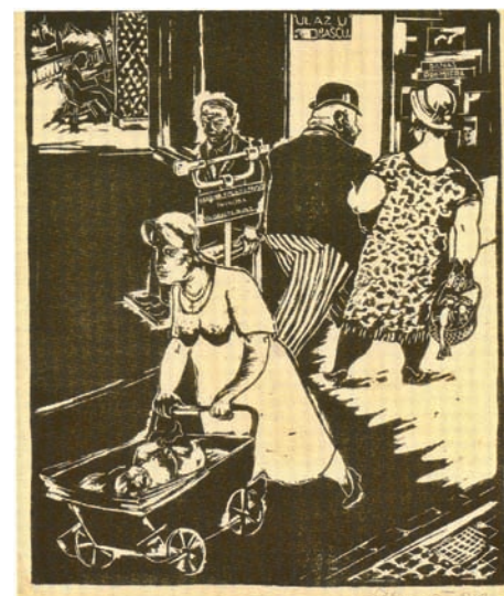
Zoran Mušič Prizor z ulice 1931