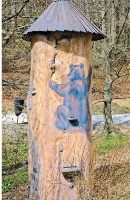
Čebelnjak Medo, zdoben v drevesnem deblu, je še posebej zanimiv, kajne?

Vsi zaposleni se vse dni v letu s srcem in ustvarjalnostjo trudijo, da je arboretum ne le raznovrstna zbirka cvetja in dreves, ampak tudi prostor sprostitve in zanimivih dogodkov. Kot je poudaril direktor Ocepek, se število obiskovalcev izven tradicionalne spomladanske razstave veča, kar je tudi njihov cilj, saj želijo Arboretum približati obiskovalcem skozi vse leto. Še posebno pozornost namenjajo družinam in otrokom, ki si želijo novih dogodivščin, zanje pripravljajo vselej nove, zanimive projekte. Letos so jih razveselili z edinstveno razstavo pošastno velikih žuželk in izumrlih velikani morja, ki so jo postavili 1. aprila in bo na ogled do 25. junija. Po celotnem parku je na ogled trideset velikih eksponatov, od 5-metrške stenice, 7-metrške in poltonske ose, bogomolke, govnača, strigalice, do morskega velikana 14-metrškega megalodona, goniofolisa in lioplevdon. Najtežji eksponat velikozobega morskega psa tehta kar 1100 kilogramov. Mladini in