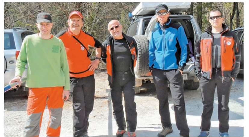
Zadovoljni po končani akciji.

V akcijo »Očistimo Slovenijo« se je vključilo tudi Društvo GRS Kamnik. Nekateri člani so čistili v okviru drugih organizatorjev, nekaj pa se jih je podalo na Šimnovec, kjer so pobirali smeti v težko dostopnem terenu. Napolnili so kar nekaj vreč, vendar je žal veliko smeti še ostalo skritih v prepadih, za čiščenje katerih bi bilo potrebno več dni in veliko izurjenih ljudi. Pri tem so podrobneje spoznavali tudi teren, iz katerega bi bilo potrebno reševati ljudi, če bi prišlo do ustavitve gondole.