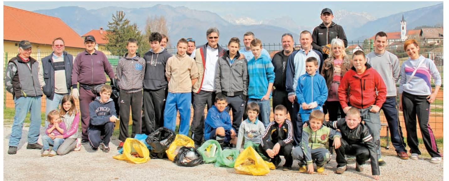
V soboto, 24. marca, se je akcije Očistimo Slovenijo udeležil tudi NK Calcit Kamnik. Nogometaši so skupaj s trenerji, vodstvom kluba in družinami čistili okolico stadiona v Mekinjah in pomožnega igrišča na Bilju.