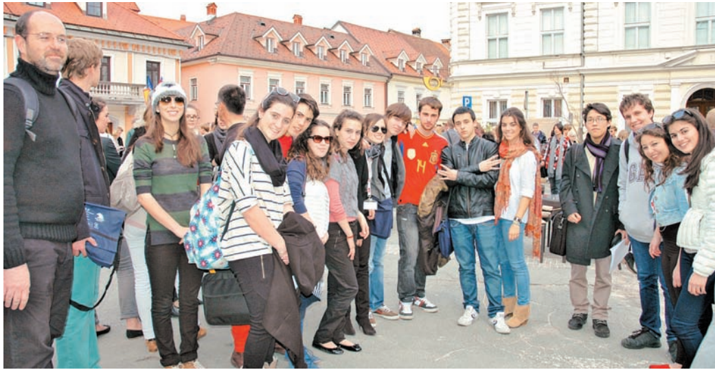
Dijaki in njihovi mentorji – učitelji iz 29 evropskih držav, ki simulirajo delovanje pravega evropskega parlamenta ter spoznavajo različne kulture znotraj EU, so konec marca obiskali Kamnik.

»Model evropskega parlamenta je odmevno evropsko srečanje, zato si moramo šteti v čast, da smo eden izmed starih slovenskih srednješolskih zavodov, po-