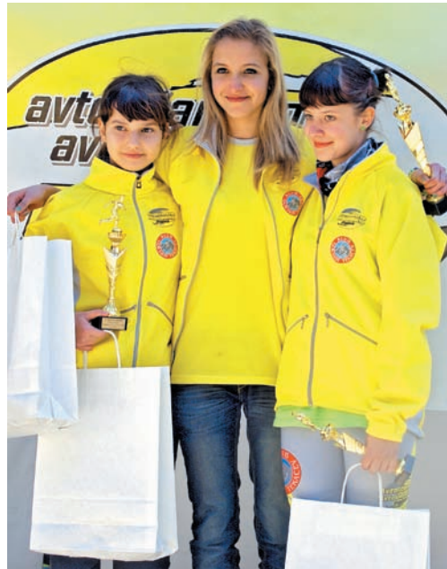
Zmagovalna trojka med deklicami.

Na dolgi progi (3,5 km, višinska razlika 400 m) je teklo 118 tekačev, in sicer 88 moških in 30 žensk v različnih kategorijah (19 tekačev in 8 tekačic KGT Papež).