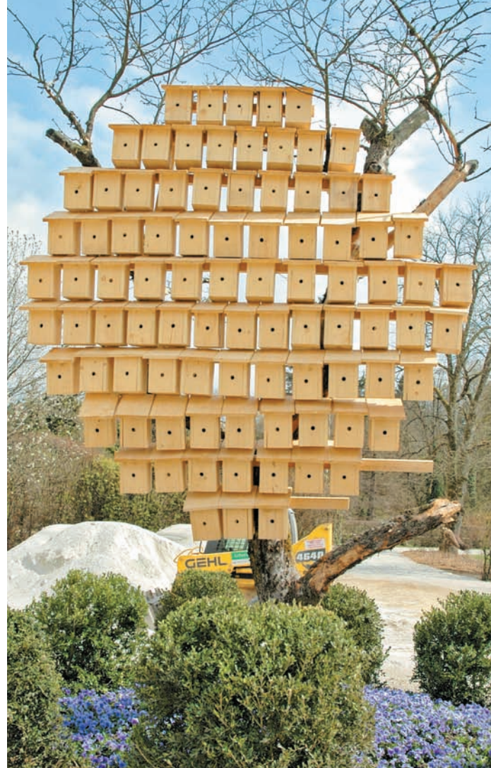
Letošnja novost so tudi lične pičje valilnice na drevesih za staro upravno stavbo.

in še dlje. Letos praznuje 60 let obstoja, kar je za nas velik praznik in celoten kolektiv je vesel, da nam je v vseh teh letih uspelo dati arboretumu tako lepo podobo, kot jo ima sedaj«, je upravičeno ponosno poudaril direktor Arboretuma Volčji Potok. Kot je dodal, so s cvetjem polepšali tudi vhod in uredili nova parkirišča.