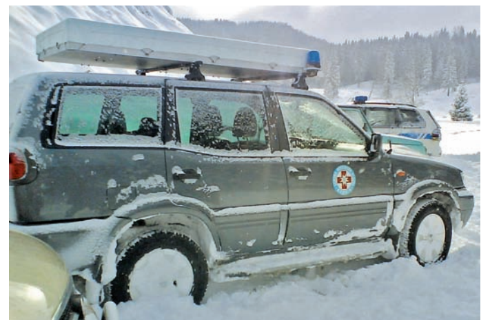
Reševalci potrebujejo intervencijsko vozilo, ki je kos najtežjim razmeram.

Ker so naš edini vir financiranja sredstva iz proračuna in od