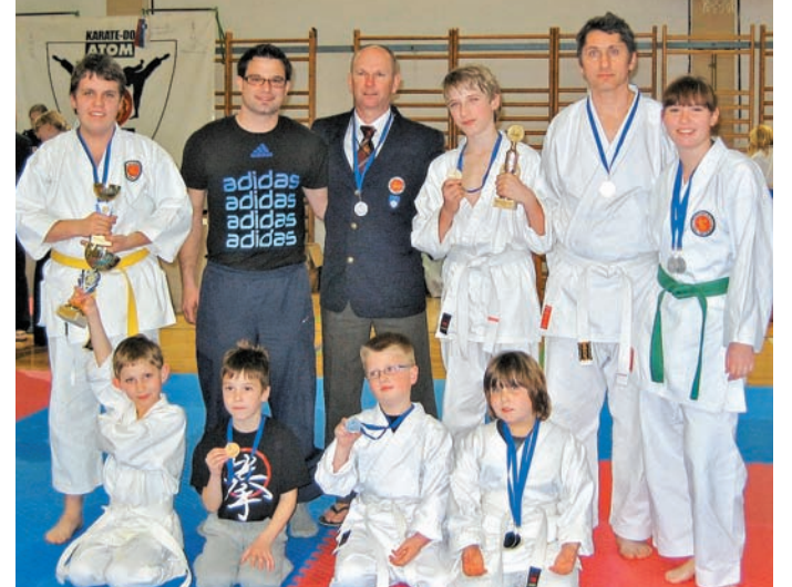
Skupinska slika po tekmi z organizatorjem tekme.

Člani in članice Shotokan Karate-Do kluba KOBUSHI Kamnik so se v nedeljo, 25. marca, odzvali povabilu karate kluba Atom iz Domžal in se udeležili tradicionalnega Zvončkovega turnirja. Na turnirju, ki je bilo namenjeno vsem šolskim pasovom ne glede na starost, je sodelovalo kar 75 karateistov s šestih klubov osrednje-slovenske regije. Tekmovalci so se pomerili v kategorijah elementov, kat in kumiteju.