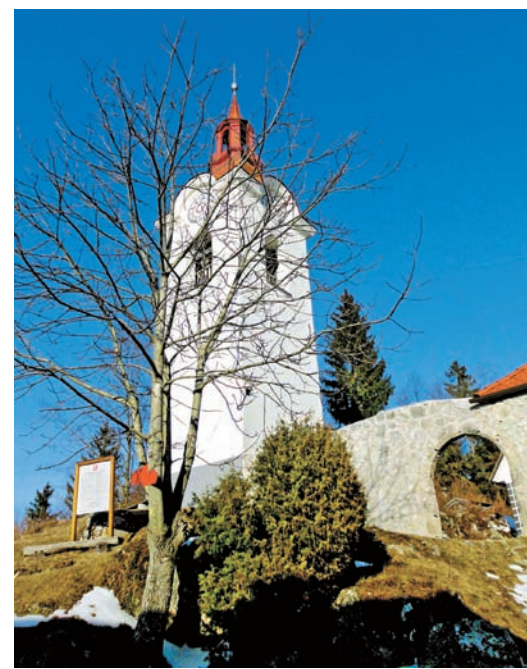
Zvonik s protiturškim obzidjem.

Spoštovani ljubitelji gora in etnološke dediščine vabljeni, da nas obiščete vsako soboto in nedeljo od 14. ure dalje, skupine