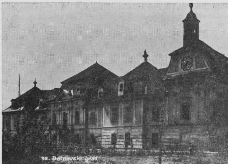
92. Betnavski grad

Pogled na grad Betnavo pred drugo vojno