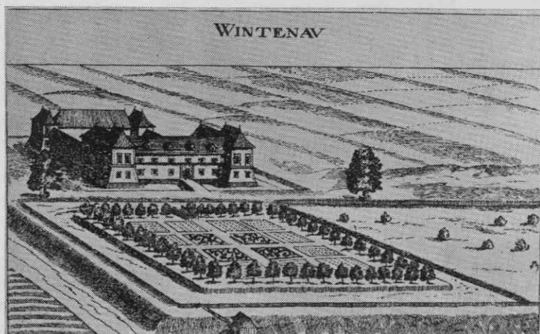
Reprodukcija risbe Betnave iz leta 1681 (G. M. Vischer)

Prvo naselje, ki priča o zgodnji kolonizaciji tal okoli Betnave, se navaja v dokumentu iz leta 985, kot smo to že omenili, naselje Razvanje, v katerem sta se v času srednjega veka izoblikovali dve jedri, Spodnje in Zgornje Razvanje: »Nider Rasway« (1431) in »Ober Raswan« (1456). 9 Tudi okoli leta 1100 prvič omenjeno naselje Radvanje (oppidum Radevan) je imelo vsaj že v 15. stoletju dve jedri, Zgornje Radvanje (Ober Rotwein) leta 1416 10 in Spodnje Radvanje (Nider Radwan) leta 1441 11 Hoče se pojavijo v dokumentu v obliki »Choz« sicer šele leta 1146, če pa pomislimo, da se ob svoji prvi omembi navaja že tamkašnja župnija, pa sega njihov postanek vsekakor nekaj desetletij nazaj. 12 Tudi tu sta se v naslednjih stoletjih razvili dve jedri, ki sta izpričani za 15. stoletje. Leta 1468 se v dokumentu omenjajo Spodnje Hoče (Nider Kotsch), leta 1474 pa Zgornje (Ober Kotsch). 13 Bližnja Bohova in Pobrežje pa datirata vsaj v začetek 13. stoletja, saj se oba kraja navajata prvič sredi istega stoletja. Bohova se omenja v obliki »Bochew« leta 1255, 14 kmalu zatem, namreč 1265, pa v oblikah »Bobrisach« in »Pabrisach« Pobrežje. 15