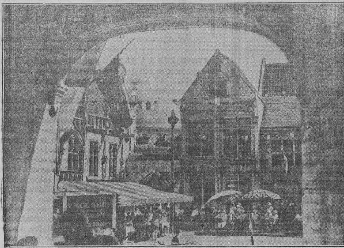
Eno najlepših mest na čičaški svetovni razstavi je takozvana belgijska vas, posnetek belgijskih krajev. Slika kaže del tega razstavnega prostora.