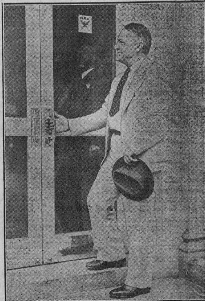
Slika kaže administratorja NRA, H. S. Johnsona, ki je na tem, da stopi v Beli hišo h konferenci s predsednikom Rooseveltom. Smehljaj mu je izvalil pogled na emblem. plavega orla, ki ga je zapazil na vratih in ki znači, da Bela hiša kupuje svoje potreščine samo od tistih trdk, ki so podpisale NRA pravilnik.