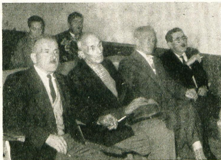
Upokojenci na zborovanju kolektiva

Vsi ti novi stroji bodo omogočili lažje delovne pogoje, celotnemu kolektivu pa znatno večji zaslužek. Rekonstrukcijska dela in nabava novih strojev so že do sedaj veljala približno 70 milijonov dinarjev. Velik polet in želja po moderni tovarni sta omogočila, da bodo z rekonstrukcijo končali že pred rokom, to je januarja prihodnjega leta.