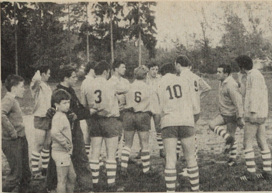
Posvet pred pričetkom tekme