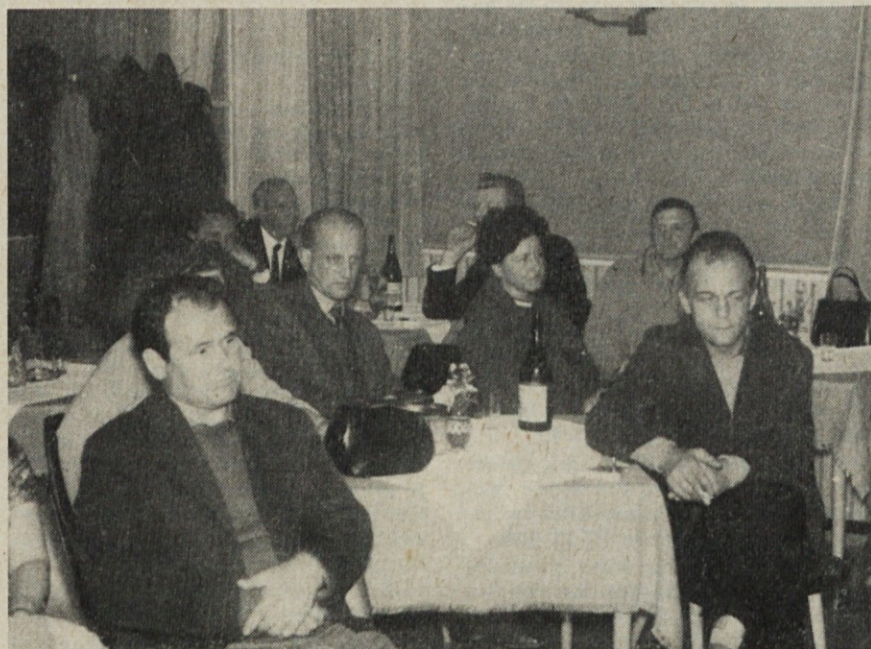
Ob poslušanju predavanja o IX. kongresu KPJ

Vsi navedeni tovariši in tovarišica, so s svojo dosedanjo delavnostjo v podjetju in na drugih področjih, kakor tudi s svojim političnim delom