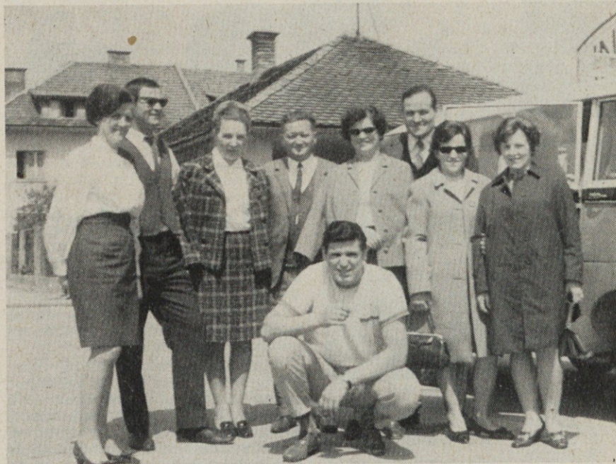
Komisija in kontrolorji na avto rallyju

Trinajsti — zadnje plasirani, pa je prejel tolažilno »Nagrado Jadrana«