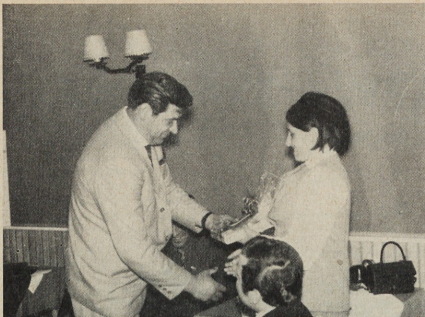
Na sprejemu članov v ZKJ sta si predsednika segla v roke