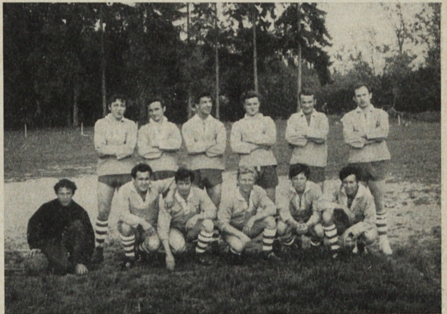
Naša nogometna ekipa, ki nas zastopa na občinskih sindikalnih igrah