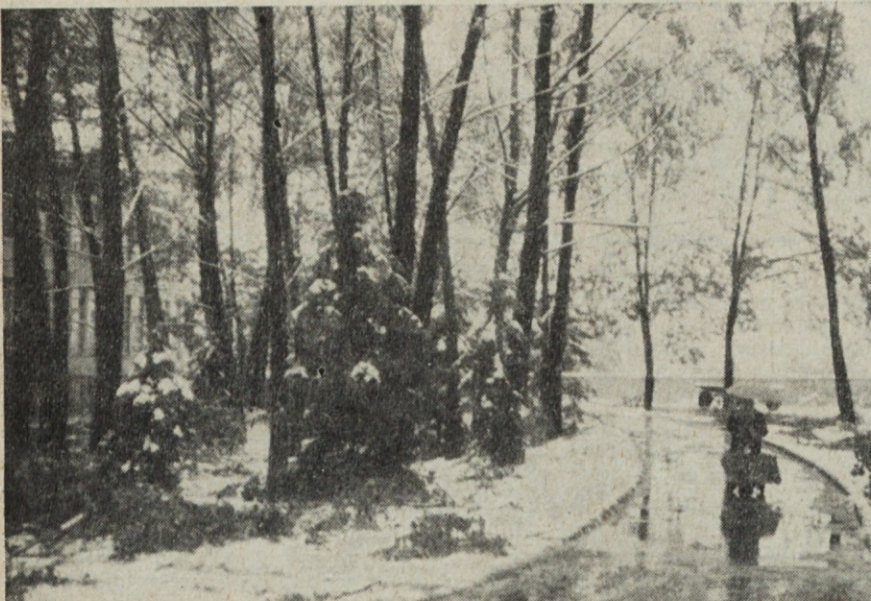
Teža snega je najbolj prizadela drevje

Poizvedbena komisija v sestavu treh članov za obravnavo disciplinskih prekrškov vodilnega kadra, pa se določi za vsak primer posebej.