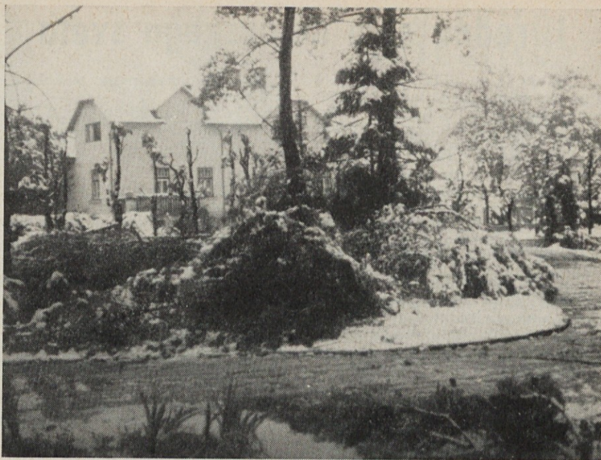
Tako nam jo je zagodla zima v mesecu maju

Kvaliteta adjustiranih tkanin se je v aprilu močno poslabšala in to v