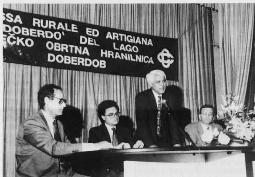
Predsedstvo Kmečko obrtne hranilnice iz Doberdoba na občnem zboru