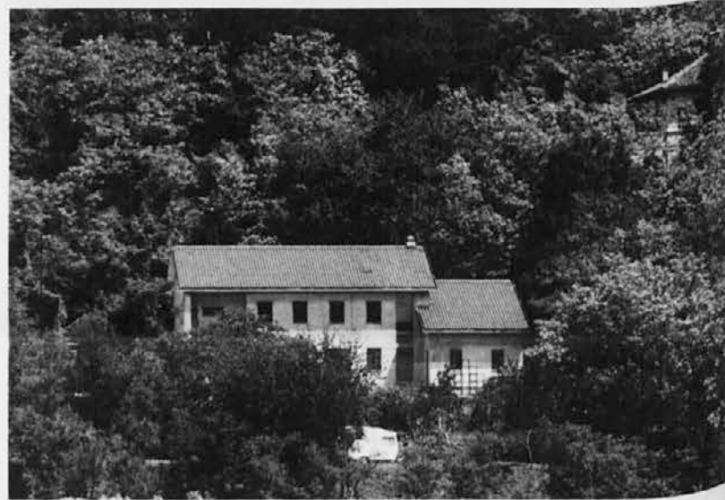
Poslopje v Dragi, obdano z zelenjem, kjer poteka poletna kolonija