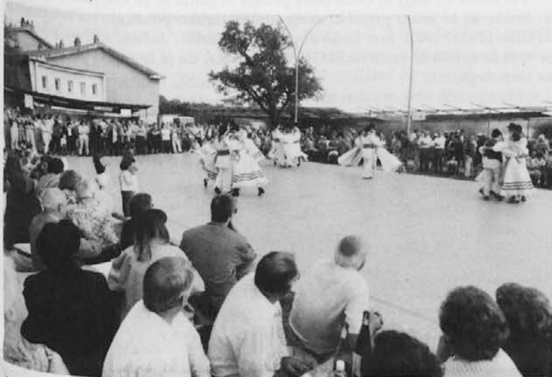
Poleg razstave vin so v Zgoniku poskrbeli tudi za bogat kulturni spored. Na sliki je plesna skupina iz Trbovelj