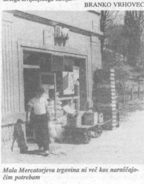
Mala Mercatorjeva trgovina ni več kos naraščajočim potrebam

Celotno proslavo so naposled sklenili s kulturnim programom, ki so ga pripravili učenci OŠ »Dolomitiški odred« Polhov Gradec. BRANKO VRHOVEC