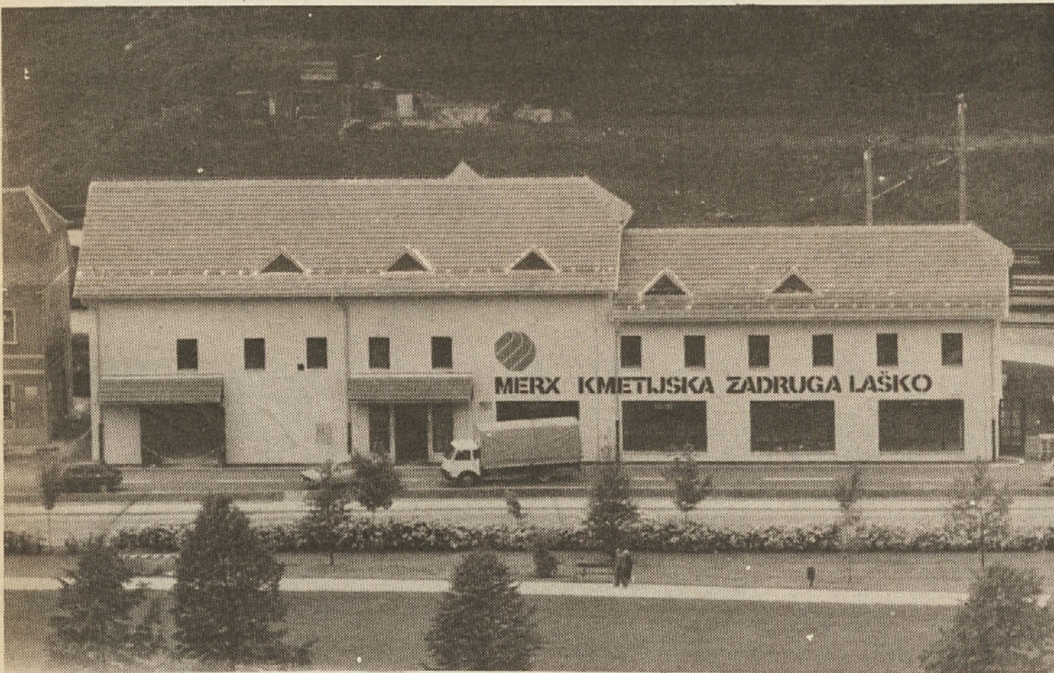
Sprednja stran novega skladiščno-prodajnega objekta s sortirnico in skladiščem jajc, ki meri 1200 kvadratnih metrov in ga je Kmetijska zadruga Laško odprla 25. maja. V njem boste lahko kupili zaščitna sred-

Objekt bi po sedanjih ugotovitvah meril brez avtobusne postaje približno 4200 kvadratnih metrov gradbenih površin, od tega bi delovna organizacija Jelša Šmarje imela približno 1850 kvadratnih metrov, delovna organizacija Tkanina 1100 kvadratnih metrov, Mlinsko predelovalna industrija 200 kvadratnih metrov, Ljubljanska banka 450 kvadratnih metrov, PTT 500 kvadratnih metrov in loterijski zavod Slovenije 35 kvadratnih metrov. Ocenjujemo, da je naložba po sedanjih cenah vredna približno 230 starih milijard za članice Merxa in 70 milijard za druge investitorje, torej skupaj 300 milijard. Že prej sem omenil, da so v izdelavi elaborati in da je v pripravi tudi finančna konstrukcija, ki pa ni dokončno zagotovljena glede na stalne podražitve, vendar menimo, da bo ob posebni prizadevnosti investitorjev in Interne banke sestavljene organizacije Merx tudi finančna konstrukcija pravočasno rešena. V ta namen bodo angažirana tudi sredstva za nerazvito območje, združena sredstva sestavljene organizacije Merx, zavarovalnice, banke, vseh izvajalcev in pa seveda lastna sredstva. Naj povem še tole, dejansko bi bilo naložbo možno začeti veliko prej, če se ne bi približno za dva meseca zavlekle priprave projekta. Toda glavne stvari so narejene in pomembno je to, da so članice Merxa z medsebojnim usklajevanjem in dokončno uskladitvijo naše svoj poslovni interes v tej naložbi.«