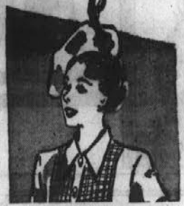
NAŠA MICKA IMA TUD BESEDO

Pripomba: To pismo je prišlo že pred enim mesecem. Priporočam tole: Ako bi bil kdo voljan kaj poslati, naj bi se zgledal pri meni poprej. Vzrok pa je ta, ker smo imeli že več skušenj, ko smo taka pisma priobčili, da naši mnogi dobri ljudje nekaterim tradi pomagajo. Tako se dogodi, da nekateri dobe od mnogih. Radi tega ni praktično kar poslati, ne da bi bilo kaj kontrole, brez kate-