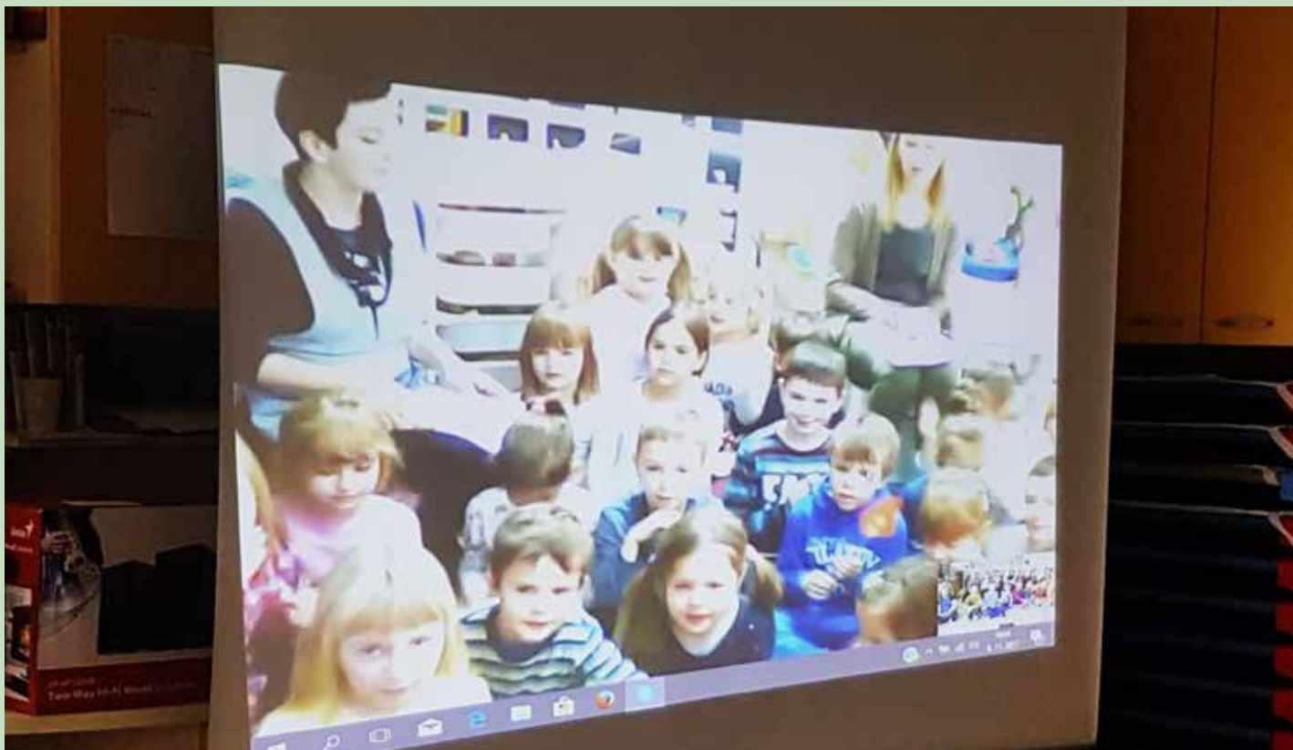
V okviru projekta tako otroke učimo o vrstnikih in kulturah v tujih državah, običajih doma in po svetu, in sicer brez predsodkov, ki bi vodili v stereotipe

Že vsa tri leta, kar smo skupaj, skušam otroke seznanjati z angleškim jezikom, in sicer prek igre in sproščenih dejavnosti. Otroci vedo, da v drugih državah govorijo drugače kot mi, zato jim jezik ne predstavlja večje ovire. Zelo radi prisluhnejo pesmicam v drugem jeziku. Ko smo prvič sodelovali v projektu, partnerski vrtec je bil iz Poljske, smo komunicirali v angleščini, peli pesmice v poljskem in slovenskem jeziku ter se naučili celo poljsko rajalno igro. Otroci pa so tudi kasneje z veseljem in navdušenjem ponavljali besede v poljščini.