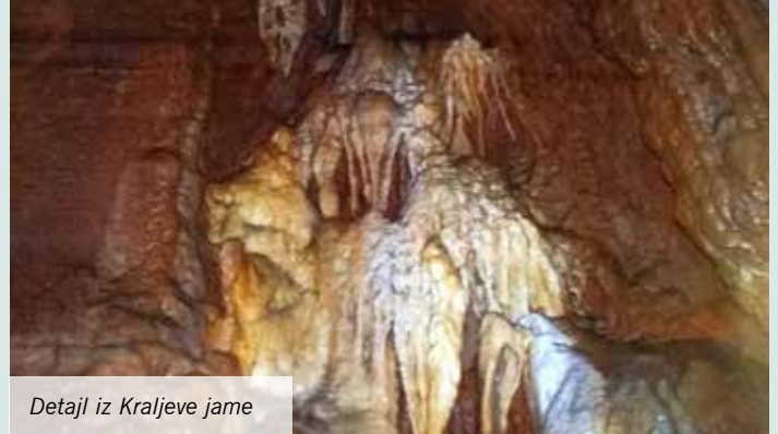
Detajl iz Kraljeve jame