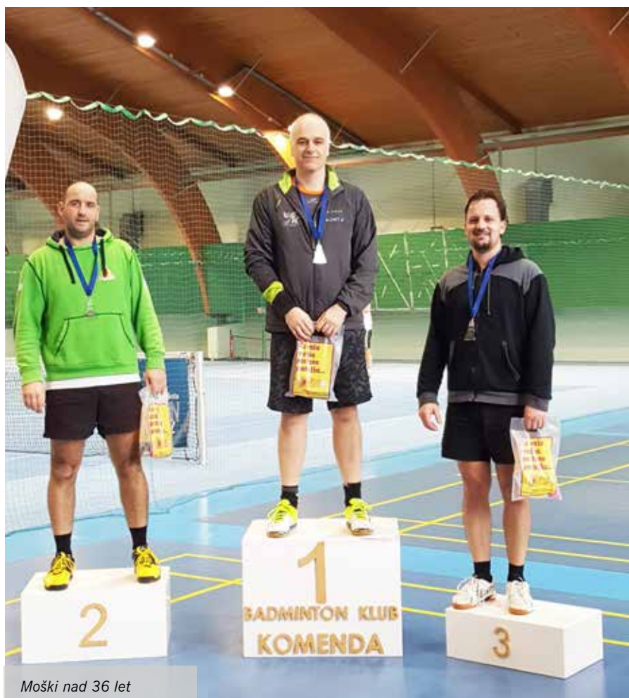
Moški nad 36 let