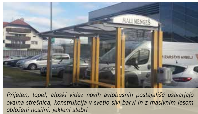
Prijeten, topel, alpski videz novih avtobusnih postajališč ustvarjajo ovalna strešnica, konstrukcija v svetlo sivi barvi in z masivnim lesom obloženi nosilni, jekleni stebri

Stara avtobusna postajališča so bila neustrezna, saj čakajočim niso ponudila zaščite pred vremenskimi nevšečnostmi. V občini so se zato, po pregledu obstoječih možnosti, odločili za krajinsko zasnovane nadstrešnice, ki so primerne za postavitve v krajini, tako na postajališču v Toplah kot v naseljih. Prijeten, topel, alpski videz avtobusnih postajališč ustvarjajo ovalna strešnica, konstrukcija v svetlo sivi barvi in z masivnim lesom obloženi nosilni, jekleni stebri. Avtobusna postajališča so bila izbrana tudi, ker se lahko modularno sestavljajo in ker so v celoti montažna konstrukcija – postajališče se sestavi na lokaciji. Del avtobusnega postajališča so tudi opozorilni znaki za ptice, obvestilo o prepovedi plakatiranja in sedežna klop iz masivnega lesa.