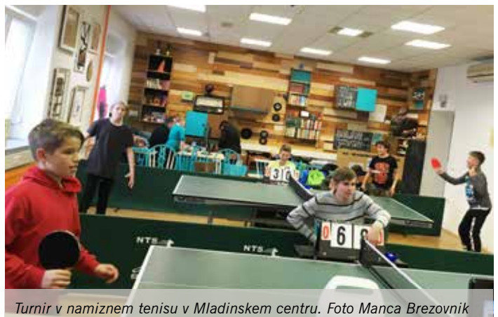
Turnir v namiznem tenisu v Mladinskem centru.