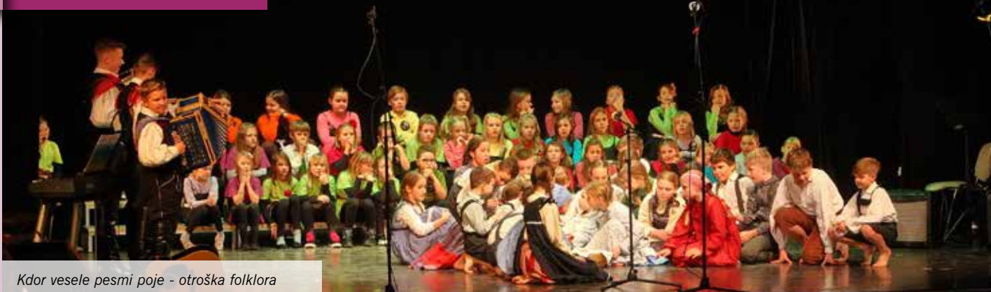
Kdor vesele pesmi poje - otroška folklor