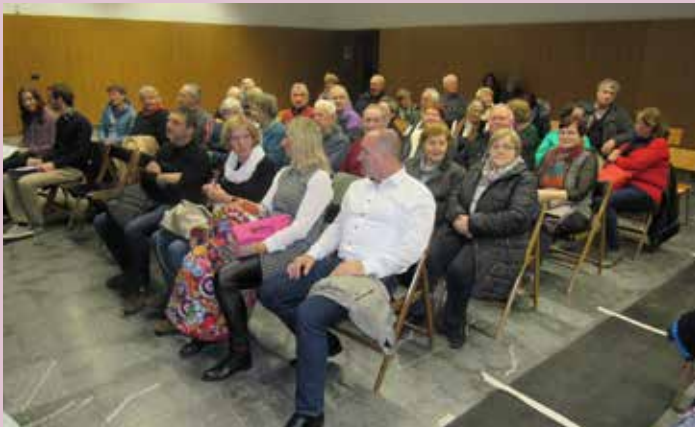
Obiskovalcev je bilo toliko, da so morali sedeže dodajati