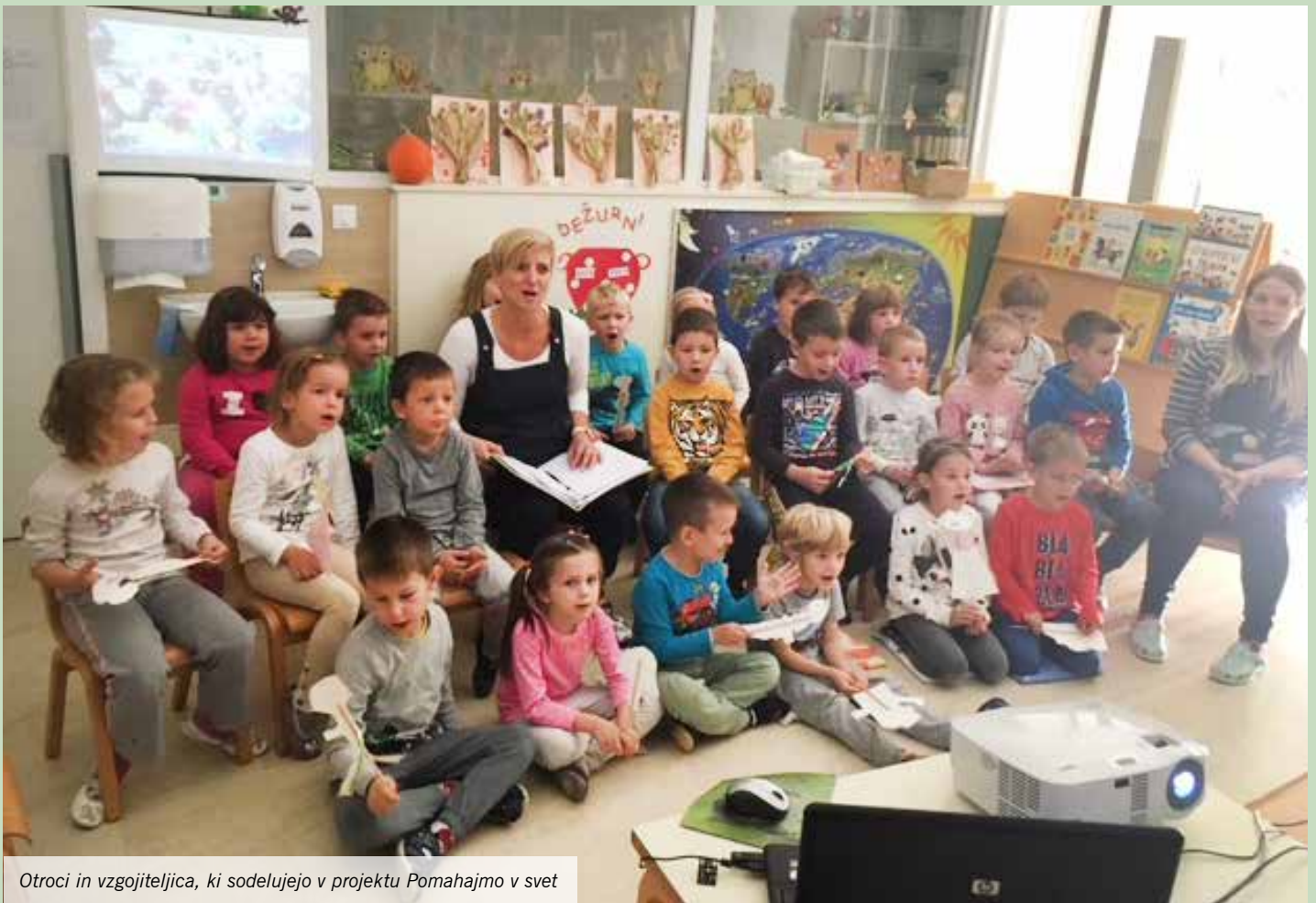
Otroci in vzgojiteljica, ki sodelujejo v projektu Pomahajmo v svet