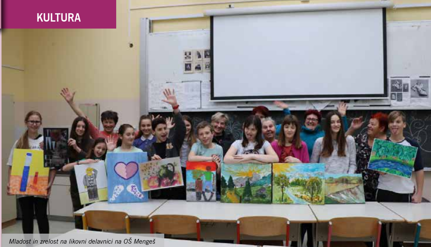
Mladost in zrelost na likovni delavnici na OŠ Mengeš