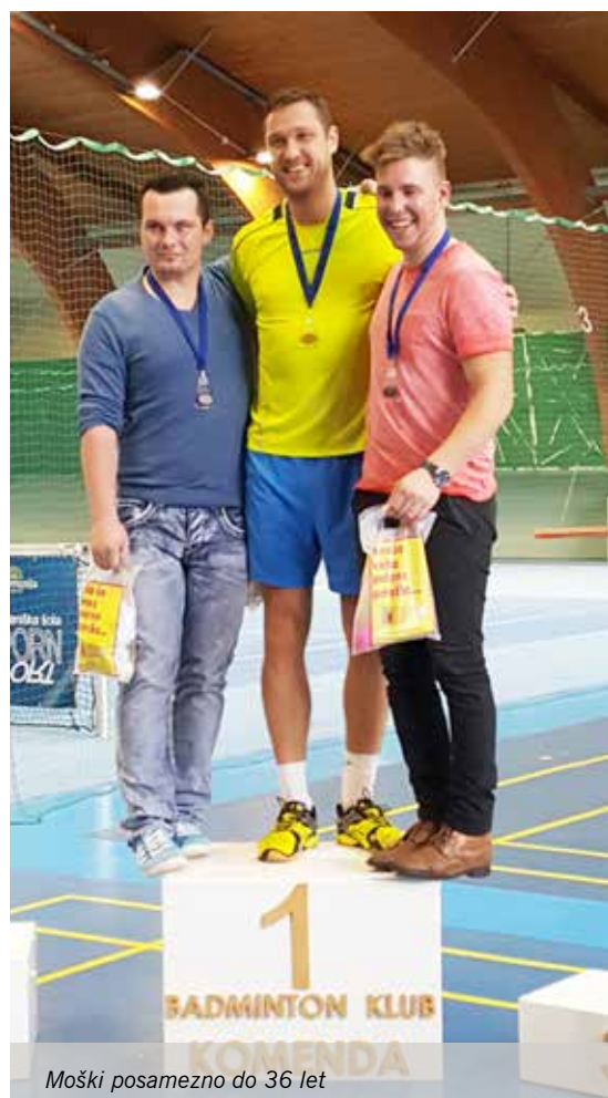
Moški posamezno do 36 let