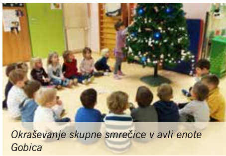
Okraševanje skupne smrečice v avli enote Gobica

Za nami je najlepši mesec v letu, čarobni december. Z okraševanjem smrečice v avli ter igralnic se je čarobnost še povečala. Lučke so zažarele tudi v očeh otrok, ko smo se pogovarjali o prihodu dobrih mož. Pred tem pa smo opravili tudi svojo dolžnost in napisali svoje pismo želja.