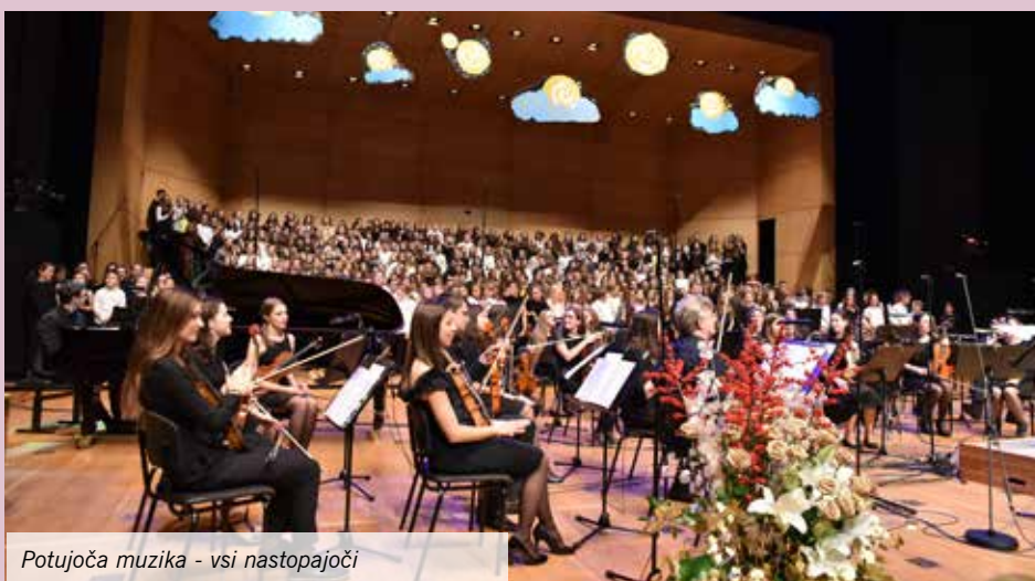
Potujoča muzika - vsi nastopajoči

Potujoča muzika je nastala leta 2011 in na oder Cankarjevega doma pripotuje vsaki dve leti. Je izobraževalni projekt, ki vsebuje izdajo nove notne zbirke za mladinske zборе in istoimenski koncert. Ta spada v množico prireditev po svetu, ki obeležujejo svetovni dan zborovske glasbe (2. nedelja decembra), in je največja temu namenjena prireditev v Sloveniji. Poglavitno sporočilo dneva zborovskega petja je, da v glasbi ne iščemo le oblikovne popolnosti in poustvarjalne lepote, temveč z združenimi močmi slavimo solidarnost, mir in razumevanje.