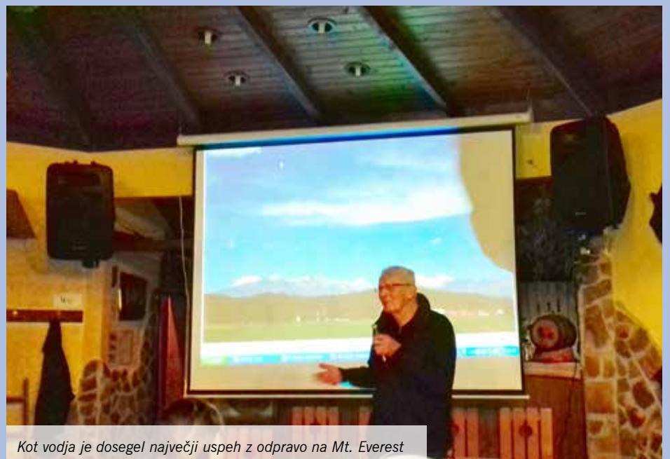
Kot vodja je dosegel največji uspeh z odpravo na Mt. Everest