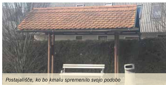
Postajališče, ko bo kmalu spremenilo svojo podobo

Občina Mengeš je konec leta 2017 začela in zaključila zamenjavo avtobusnega postajališča v Malem Mengšu. Novo postajališče daje čakajočim zaščito proti dežju in vetru ter s krajinsko zasnovo dopolnjuje urejen videz lokacije. Za zaključek projekta zamenjave neustreznih avtobusnih postajališč v občini je treba zamenjati še eno postajališče, in sicer postajališče na nasprotni strani cestišča. Sredstva za zamenjavo so že rezervirana v proračunu 2018.