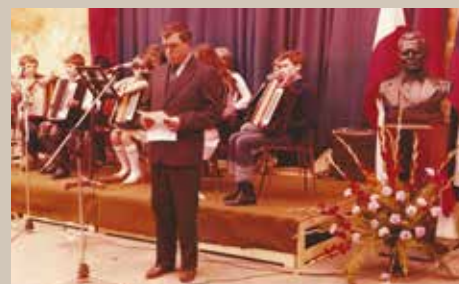
Na eni od številnih proslav