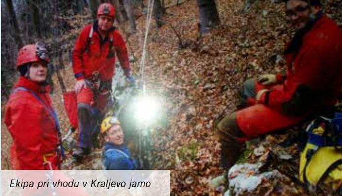
Ekipa pri vhodu v Kraljevo jamo