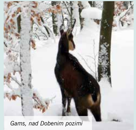
Gams, nad Dobenim pozimi

svoj dom. Največ možnosti, da se jih vidi, je zgodaj zjutraj, predvsem v zimskem času, nad vasjo Rašica ali nad Dobenim.