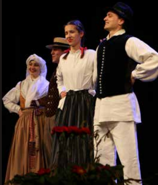
Nastop parov Folklorne skupine Svoboda v narodnih nošah slovenskih pokrajin