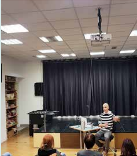
Kako vzgojiti zdrave, uspešne in odgovorne posameznike.