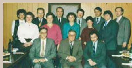
Na sprejemu pri predsedniku Občine Domžale ob prejemu republiškega priznanja Zlati znak za uspešno in strokovno delo z osebami z motnjo v duševnem razvoju (1989)