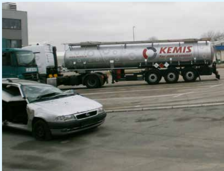
Večina občanov najbrž ne ve, da se po cestah v cisternah prevažajo tudi nevarne in zelo nevarne snovi, ki bi imele v primeru prometne nesreče hude ekološke posledice za vodne vire

Sem tudi član civilne iniciative za izboljšanje prometne varnosti, kjer se veliko pogovarjamo o teh problemih, opozarjamo in dajemo pobude. Zdi se nam nujno, da smo občani bolj ozaveščeni in odgovorni v svojem ravnanju ter da smo kritični do vseh, ki z neodgovornim ravnanjem delajo škodo. Vsi se moramo zavedati, da je voda najbolj dragocen naravni vir, zdrava voda pa pravica vsakega človeka. Od županov našega območja pričakujemo, da bodo v občinah storili vse za ureditev prometnih razmer ter za zaščito podtalnice, saj je to v interesu sedanjega in bodočih rodov občanov in mora biti tudi zato v interesu županov. Pa ne samo kot predvolilna obljuba, kot se