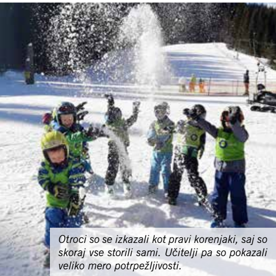
Otroci so se izkazali kot pravi korenjaki, saj so skoraj vse storili sami. Učitelji pa so pokazali veliko mero potrpežljivosti.