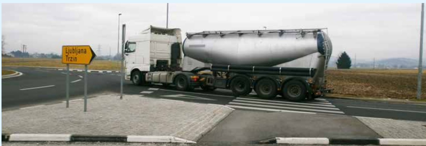
Od županov našega območja pričakujemo, da bodo v občinah storili vse za ureditev prometnih razmer ter za zaščito podtalnice, saj je to v interesu sedanjega in bodočih rodov