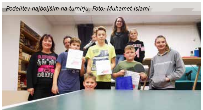
Podelitev najboljšim na turnirju.