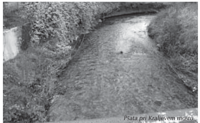
Pšata pri Kraljevem mostu

Kot dokaz, da ni bilo narejeno nič, so naslednje fotografije: