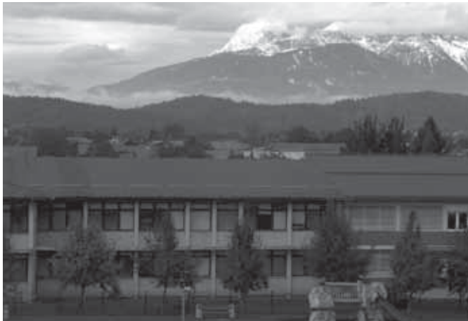
Letošnji oktober je postregel kar z dvema snežnima pošiljkama, prva (na sliki z dne 8.10.) je še ostala nad Trzinom, druga pač ne.

Saj še pomnite tisti rek, da je oktober dober? Samoumevno pri tem je, da velja to (le/tudi – ustrezno besedo izberite sami...) za vreme. Vse manj je namreč takšnega in takšnih, za katere lahko rečemo, da so »dobri«. Dobri, kaj dobri, odlični in vedno nasmejani pa bodo še nekaj tednov naši kandidati, in to prav vsi po vrsti, od »rumenorjavih« do »lilapikčastih«. Kakorkoli bo že, na koncu vedno zmaga ljudstvo oziroma demokracija in zakaj potemtakem tudi to pot ne bi bilo tako? Letošnji Miklavževi spremljevalci bodo lahko žugali že kar novoizvoljenim poslancem, čeprav si za marsikaterega od njih včasih želimo, da bi ga vzel malo v svoje roke vrag in ne le parkelj! Eh, kako že gre tista znana od primorskega »avtorja na kanti«, ... »pusti pr' mir' politiku an putanu« in zato se tudi mi raje vračamo k vremenu. Tudi oktobrska sončna uprava je kar dobro delovala, sicer pa poznamo še kar nekaj »sončnih« služb. Čeprav vemo, da se »Sonce, Zemlja in Mesec vrte brez kolesec«, nas še vedno pogosto zaposluje skrivnost uravnavanja vremenskih ur. Tudi v teh pozno novembrskih dneh je to gotovo sončna uprava oziroma nebeška služba, pristojna za vreme. Ta pa ima lahko včasih tudi precej »nevremenski« pomen.