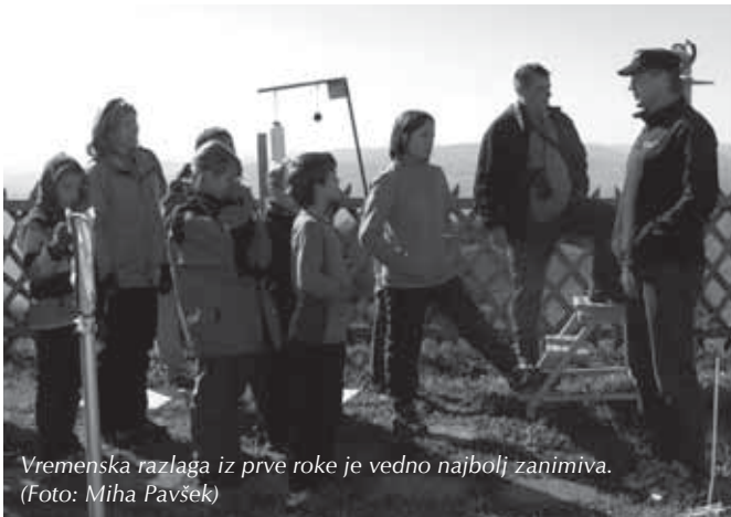
Vremenska razlaga iz prve roke je vedno najbolj zanimiva.

nadaljevanju deležni še ves dan. Tudi pri naslednjem postanku, pri znameniti jurkloštrski kartuziji, natančneje ostankom tega samostana, ki je med okoliškimi prebivalci najbolj znan po zgodbi o Frideriku Celjskem in Veroniki Deseniški. V enem od obnovljenih stolpov je živela nekaj časa tudi avtorica Sapramiške in Pekarne Mišmaš - Svetlana Makarovič.