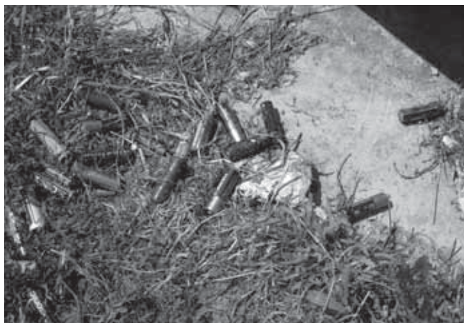
Baterijski vložki raztreseni poleg kontejnerja