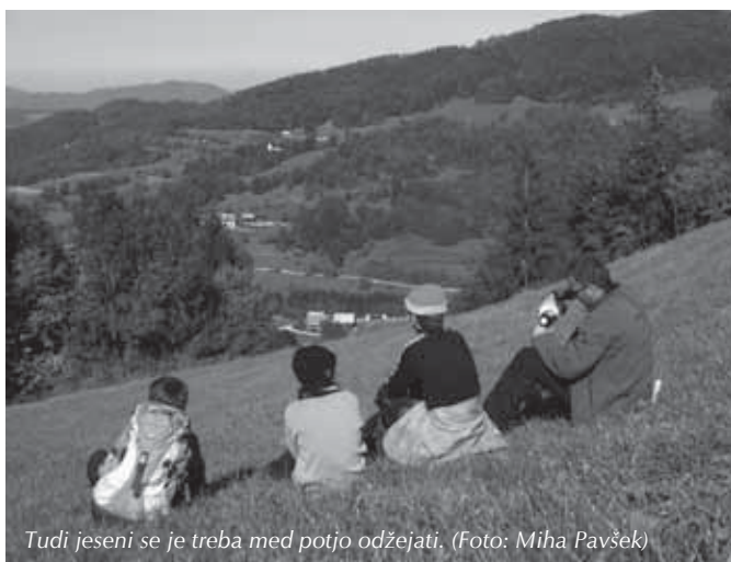
Tudi jeseni se je treba med potjo odžejati.

PD Onger Trzin in DPM Trzin sta tudi letos soorganizirala družinski izlet – predvsem s pokritjem stroškov za avtobusni prevoz – ki nas je tokrat pripeljal v vzhodni del Posavskega hribovja, natančneje pa naravnost na Lisco (948 m) nad Sevnico. Tja se nas je 15.10. odpravilo skoraj za štiri desetletje, med nami pa več kot polovica otrok. Medtem ko smo lani preverjali Cankarjeve kraje nad Vrhniko, smo letos ugotavljali, kaj vse so počeli kartuzijani v bližnjem Jurkloštru in zakaj na vrhu gore ne izdelujejo spodnjega perila. Po dobri uri vožnje mimo Celja in prek Šentjurja pri Celju smo imeli že prvi postanek v zgornjem delu rečice Gračnice in se sprehodili do zanimivega slapu vzhodno od Mrzlega Polja. Počerenški slap, tako se imenuje po bližnji kmetiji Počerenje, je zanimiv primer prepleta različnih dejavnikov okolja, od kamninske podlage, erozijskega delovanja površinskih voda pa vse do razvoja raznolikih geomorfoloških oblik. Malo pred slapom teče rečica po dveh rokavih, ki pa se tik nad slapom združita. Medtem ko so bili travniki v dolini ob slapu še »zasoljeni«, pa je prisoje že zgodaj dopoldne grelo prijetno jesensko sonce. Tega smo bili v