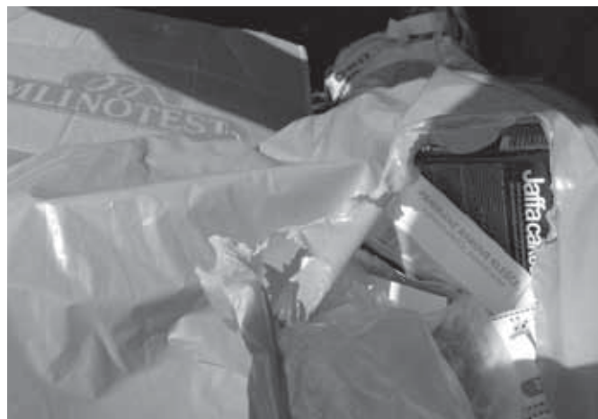
Razne smeti v kontejnerju za embalažo