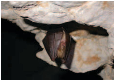
Slika 5: Mali podkovernjak (Irena Krašnja)

V letošnjem letu smo v trzinskem gozdu v povirju Blatnice potrdili še eno evropsko pomembno vrsto, raka navadnega koščaka. Smiselno bi ga bilo umestiti med velike štiri zaščitnike vsega živalstva in rastlinstva na Natura 2000 območju v Trzinu.