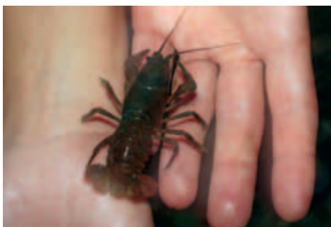
Slika 6: Navadni koščak (, 14.6.2011, Trzin)

Grožnje: V Sloveniji je bil nekoč ogrožen zaradi bolezni račja kuga, danes zaradi onesnaženja (predvsem komunalnega), mehanskih posegov v vodotoke (regulacije, zadrževalniki), rabe vode za različne namene (pitna voda, male hidrocentrale, ribogojnice) ter prisotnosti in širitve severno-ameriške vrste, signalnega raka iz Avstrije po reki Muri.