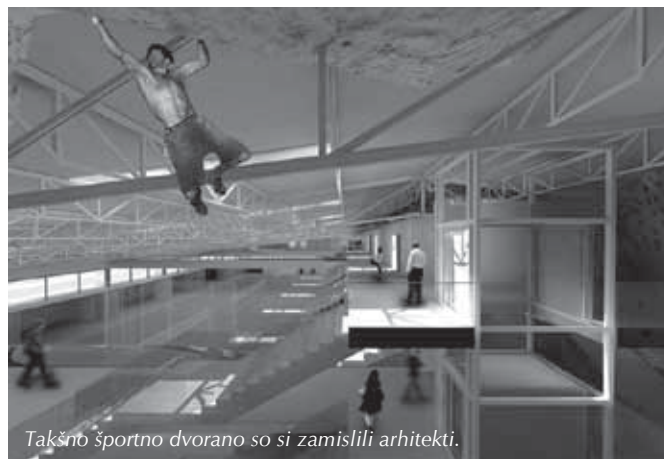
Takšno športno dvorano so si zamislili arhitekti.

Najprej moram poudariti, da še vedno ne vemo natančno, kako pravzaprav izpeljati naš namen, da bi do večnamenske športne dvorane ob športnem parku pri OŠ Trzin prišli na način javno-zasebnega partnerstva. Ministrstvo za finance, s katerim usklajujemo poglede že več kot leto dni, ker mimo ministrstva ni mogoče, saj je treba za sklenjeni aranžma dobiti odobritev ministrstva, zelo togo vztraja, da je edina prava oblika javno-zasebnega partnerstva takšna, da zasebni partner zgradi objekt in ga tako rekoč podari občini. Takšnega partnerja pa bo, še posebej v teh časih, gotovo zelo težko najti tudi z lučjo. Občina realistično vidi kot edino možnost aranžma, po katerem občina vложи zemljišče, mor-