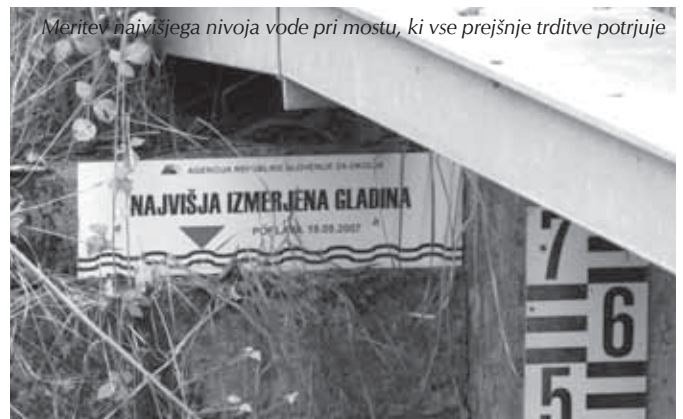
Meritve najvišjega nivoja vode pri mostu, ki vse prejšnje trditve potrjuje