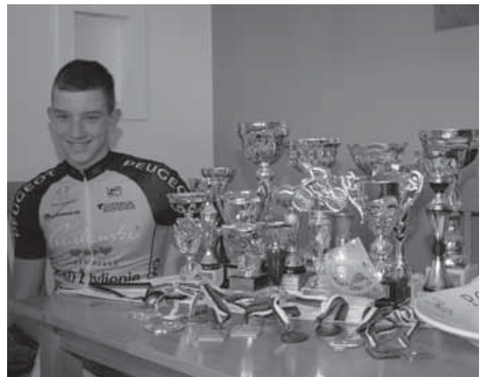
Žan s pokali in medaljami

Mladi športniki, le tako naprej! V naslednjih številkah glasila bomo predstavili še kakšne talentirane krajanje mladega rodu.