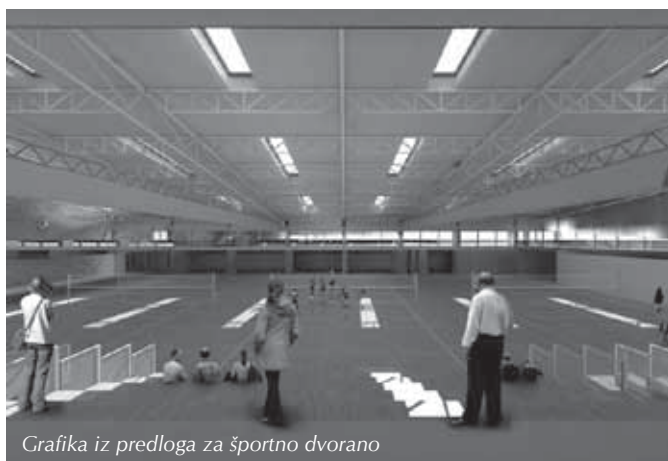
Grafika iz predloga za športno dvorano

Na spletni strani Občine ste v drugi polovici oktobra objavili idejne načrte za novo športno dvorano v Trzinu, hkrati pa ste pozvali morebitne izvajalce gradnje in bodoče imetnike stavbne pravice, naj oddajo svoje ponudbe. Kakšno dvorano si zamišljate, kje naj bi stala, koliko naj bi za to plačala občina in kakšen je odziv pri izvajalcih in morebitnih uporabnikih dvorane?