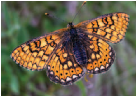
Slika 4: Travniški postavnež (Martin Vernik)

V občini Trzin trenutno ni primerne habitata zanj. Najbližnja znana populacija se nahaja na Planiku pod Dobenom. Če bi ponovno vzpostavili primeren habitat za močvirske tulipane ali logarice (žerjavčke), bi kaj kmalu lahko na teh travnikih opazovali spreletavanje evropsko ogroženega metulja, travniškega postavneža.