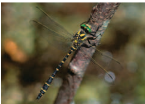
Slika 2: Veliki studenčar (Maja Brozovič)

VELIKI STUDENČAR je največji kačji pastir v Evropi. Odrasli samci so dolgi okoli 8, samice pa 9 cm. Telo je črno z rumenimi lisami.