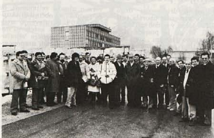
Obiski, obiski, obiski, obiski, obiski

Kanadska poslovna vodstva in finančna sredstva naj bi pomagala firmi za čevlje CABER, da postane spet svetovna sila št. 2. Za leto 1982/83 planirajo celotni promet 36 Mio lir (CABER + SPALDING, ki je v isti grupi). To bi pomenilo povečanje prometa za 20%.