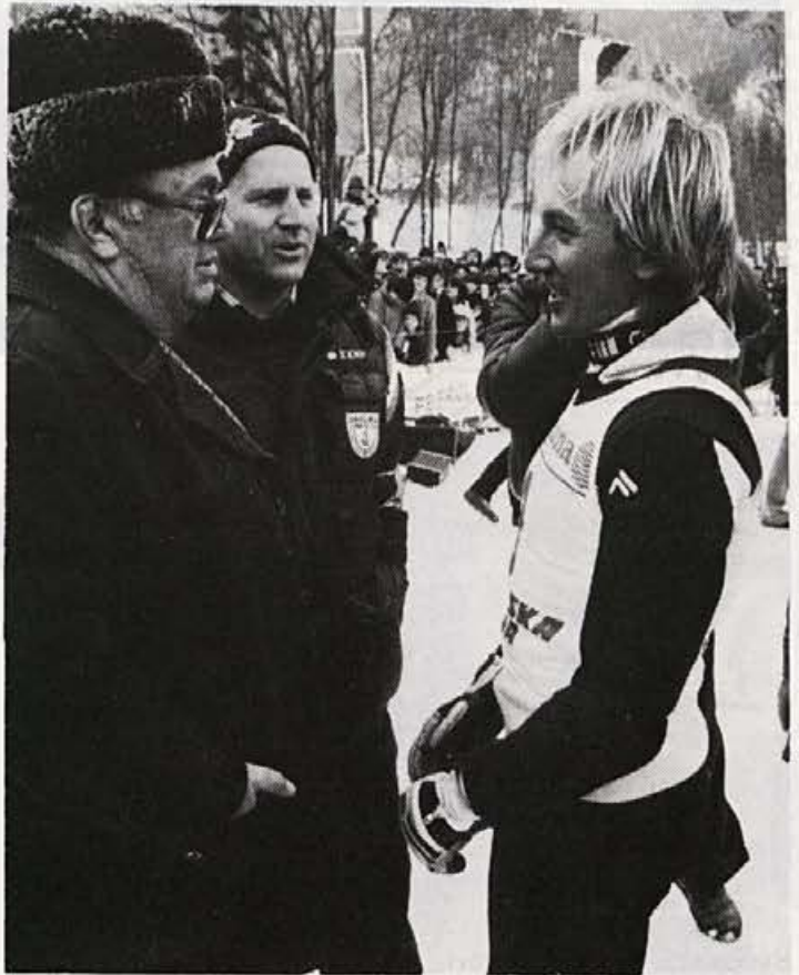
Stane Dolanc v razgovoru z Bojanom Križajem v Kranjski gori