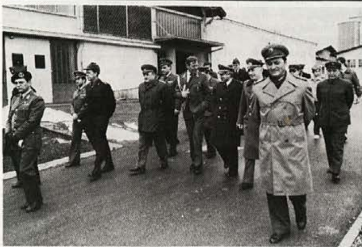
Tuji vojaški atašeji v Elanu

Te dni smo tudi zvedeli, da se delovne organizacije, ki so lastnice teh novo zgrajenih letoviških stanovanj, že dogovarjajo, da bi se združile in same še kaj naredile, da bi letovanje lahko potekalo kot je treba. Najbrž se jim bomo priključili tudi mi in po svojih močeh prispevali, da bi tudi to prvo letovanje na Cresu bilo kar se da prijetno in udobno. Z. P.