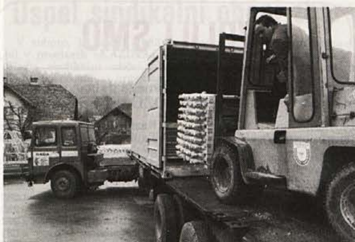
Nakladanje kontejnarja z olimpijskimi ročkami za Alžir