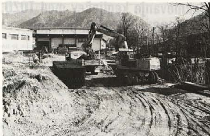
Gradnja objekta hladilne vode