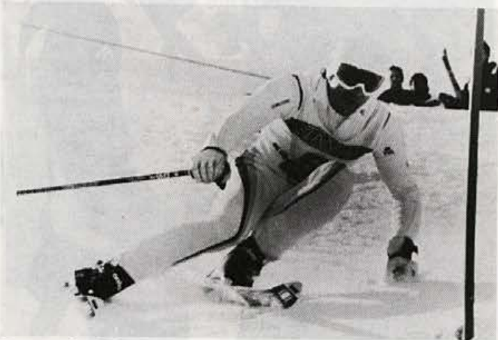
Stenmark v Kranjski gori