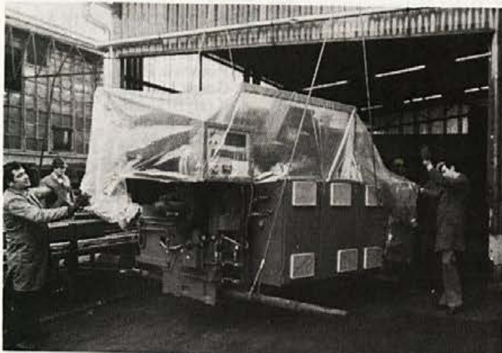
Razkladanje nove stružnice