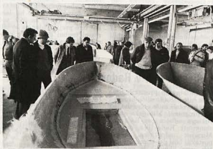
Italijanski kupci čolnov na obisku v Elanu