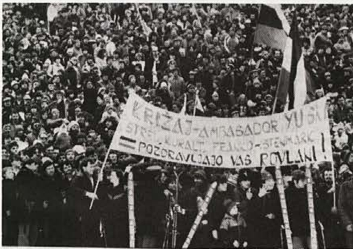
Navijači v Kranjski gori