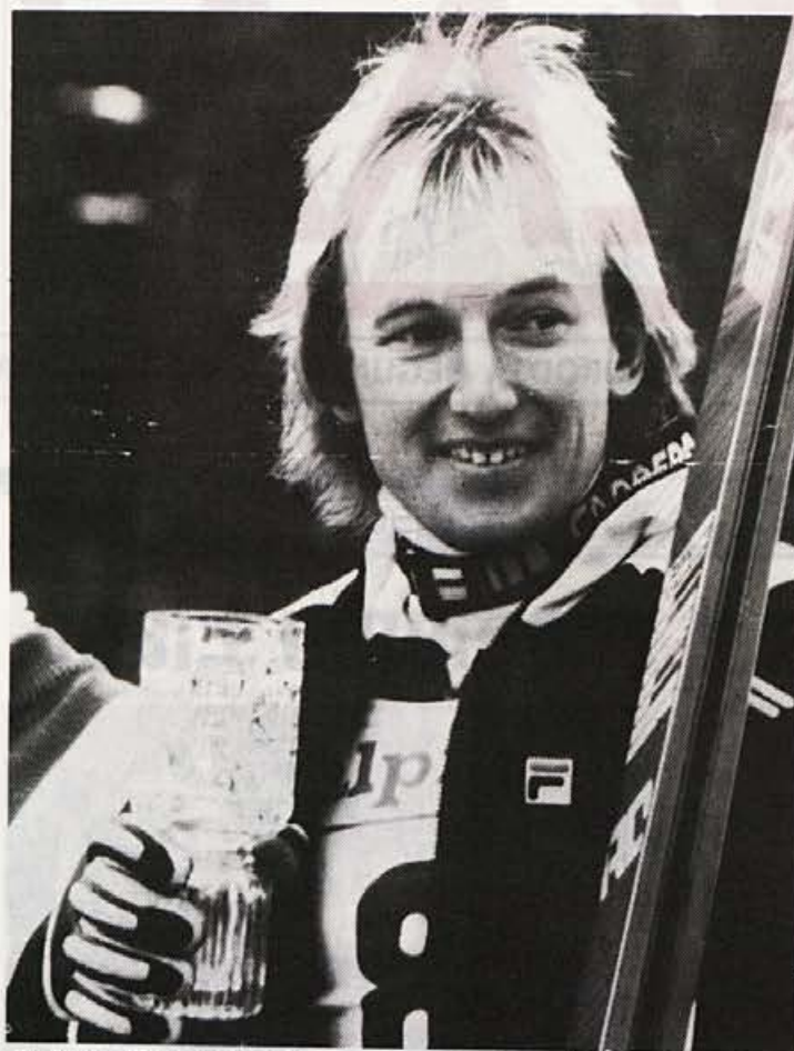
Križaj v Kranjski gori