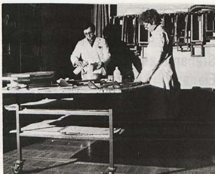
Priprava tiska novih vzorcev smučí v oblikovalnici