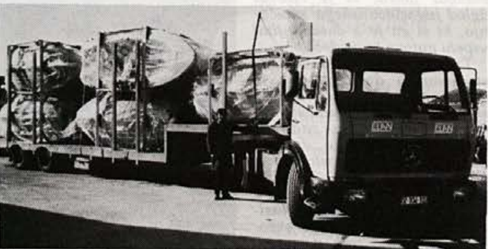
Novo specialno vozilo MERCEDES za prevoz čolnov, last Elana