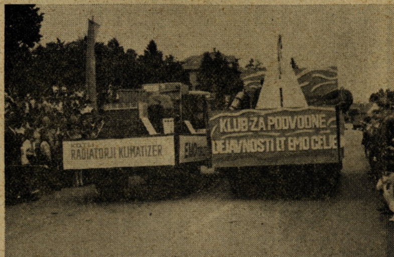
Pogled na vozila med parado od zadaj.