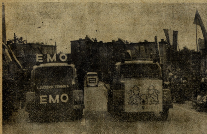
V paradnem mimohodu je med drugimi bila zastopana tudi naša OZD. Pogled na vozila med parado od spredaj.