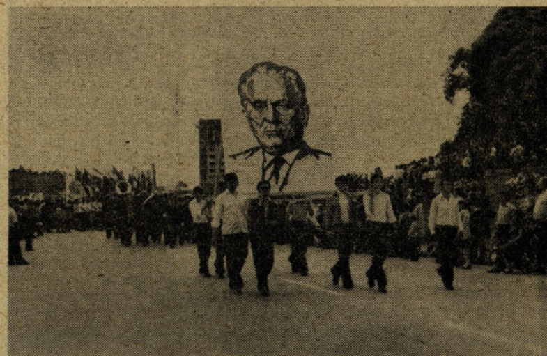
Izredno lepo in disciplinirano so se udeležili parade dijaki srednjetečnične šole iz Celja. Bil je res lep pogled na dobro organizirane skupine te šole.