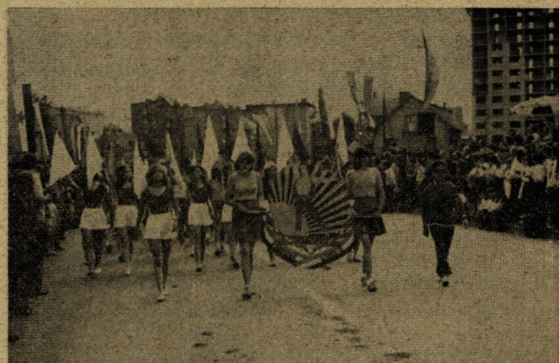
Med društvi na paradi je prednjačilo TVD Partizan iz Gaberij. Njihova paradna skupina je bila odlično organizirana.