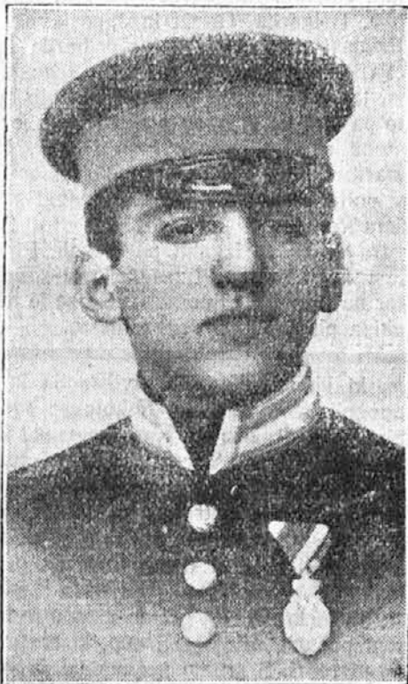
Njegovo Veličanstvo Kralj Aleksander kot prestolonaslednik.

Drugič in zadnjič pa je obiskal kralj Aleksander Maribor 28. avgusta leta 1923. Ogledal si je takrat industrijsko-obrtno vzorčno razstavo in zapustil Mariborčanom nevenliive spomine.