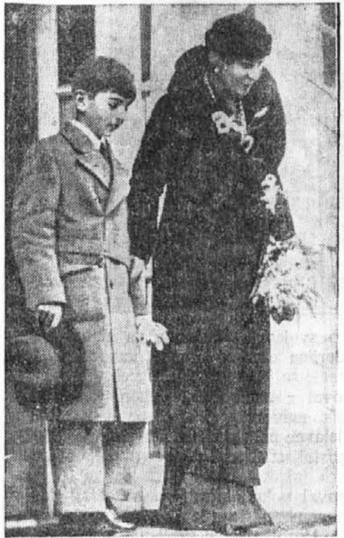
Vrtnec Nj. Vel. kralja Petra II. v domovino.

Vremensko poročilo mariborske meteorološke postaje. Davi ob 7. uri je kazal toplomer 16 stopinj C nad ničlo; minimalna temperatura je znašala 9 stopinj C nad ničlo; barometer je kazal pri 15 stopinjah 742, reduciran na ničlo pa 740; relativna vlaga 78; vreme je jasno in mirno; vremenska napoved pravi, da ne bo nobenih bistvenih sprememb.