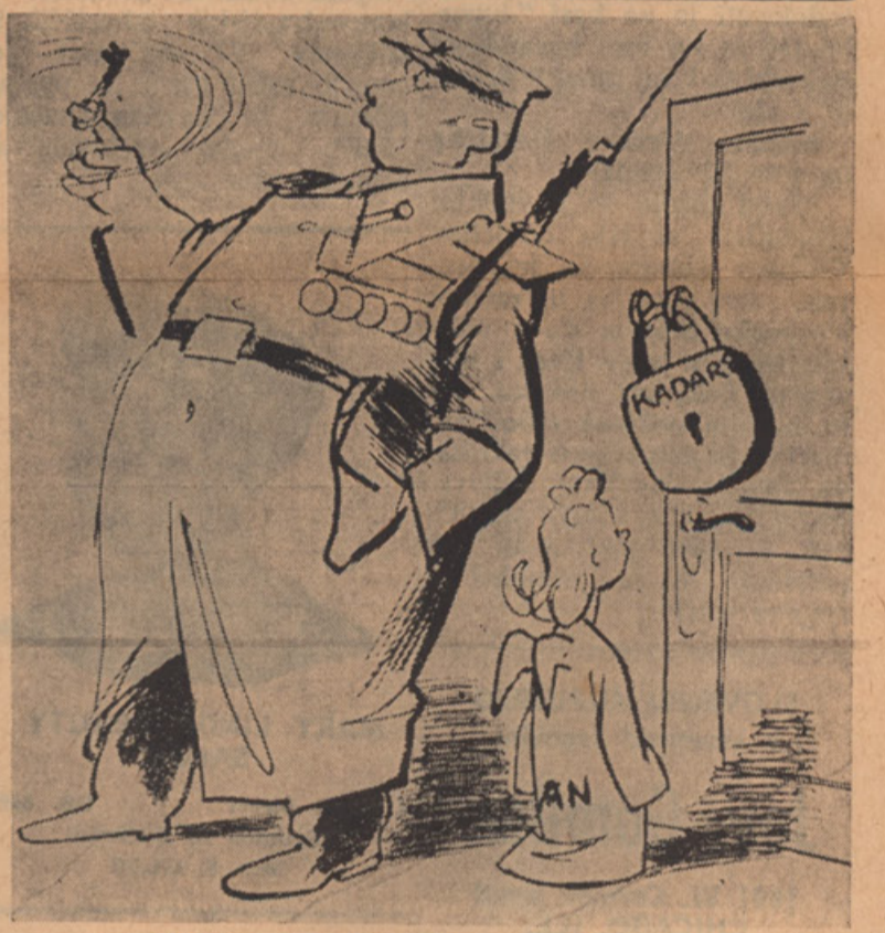
POTEM PA VSE TIHO JE BIL O... (Continued from previous page)

Jakob Planinšek, 237 Plymouth Ave., Buffalo 13, N.Y., U.S.A.