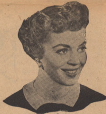
MARY LINDA BEAUTY SALON