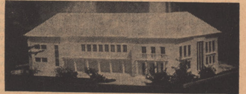
EHRLICHOVO SPOMINSKO KAPELO

"V Šmihelu 'no kajžico' mam" je bila njegova priljubljena pesem. Sedaj imamo priliko, da mu postavimo v Šmihelu "kajžico", ki mu je bila žudi v življenju najljubša —