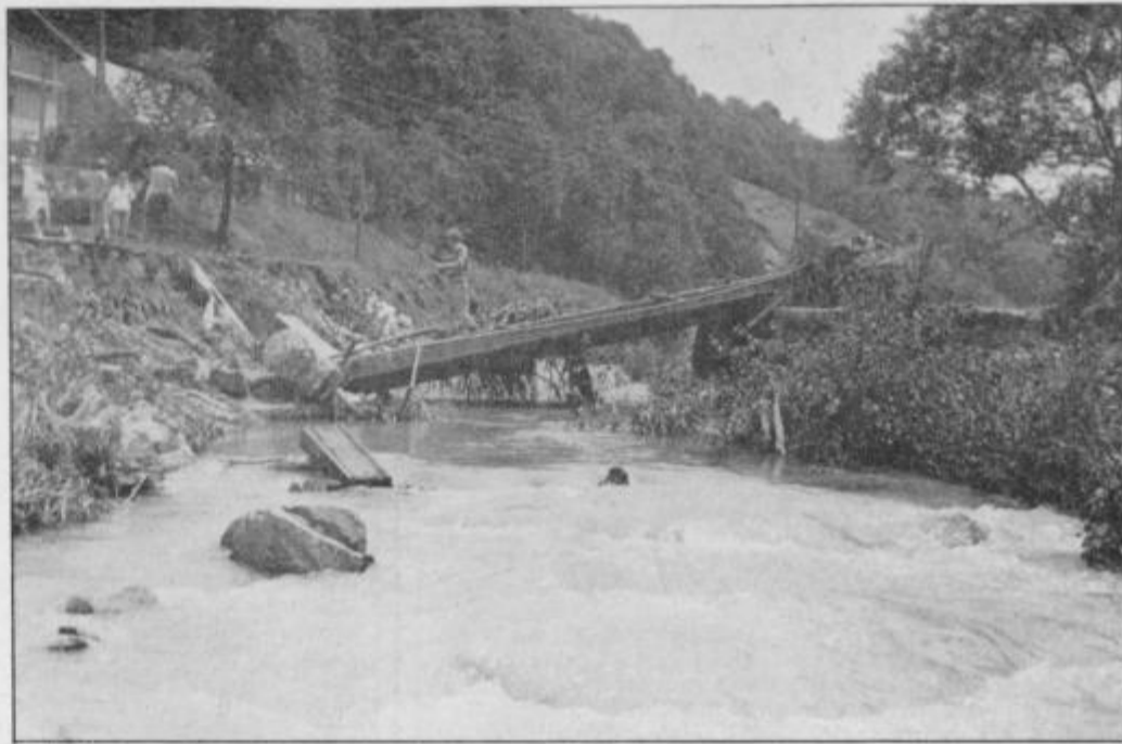
Most, ki vodi prek potoka Jesenica proti Jelovicam, je ujma porušila in delno tudi prestavila.