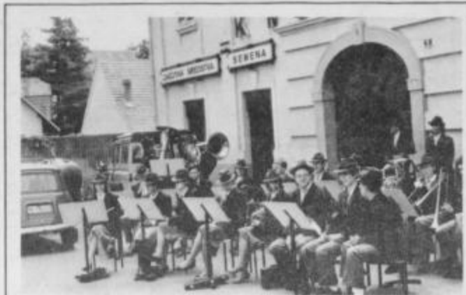
Pihalni orkester Ormož.