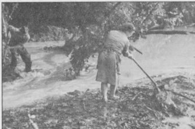
Še po dveh dneh se je bilo treba boriti za vsak pedenj zemlje, kajti voda se je počasi umirjala.