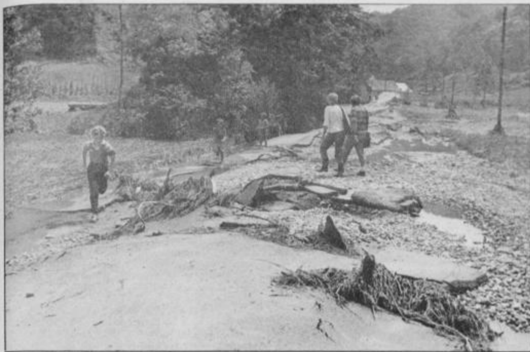
Od mostu prek Dravinje naprej je bila vožnja onemogočena. Ceste enostavno ni več bilo.