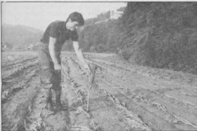
Potok Peklača je čez poletje idiličen, do gležnja globok, tokrat pa je prerasel v nekaj deset metrov široko rušilno reko, ki je na Letonjevi njivi tako le opustošila koruzno polje.

Rane pa so ostale in haloški človek jih kljub pomoči ne bo zlahka zacelil. Dan po neurju se je na prizadeto območje napotila tudi ekipa novinarjev Dela, mariborskega radia in našega zavoda. Peš po haloškem blatu s škornji, fotoaparati in magnetofoni. Martin Ozmeč je o tem pripravil fotoreportažo.