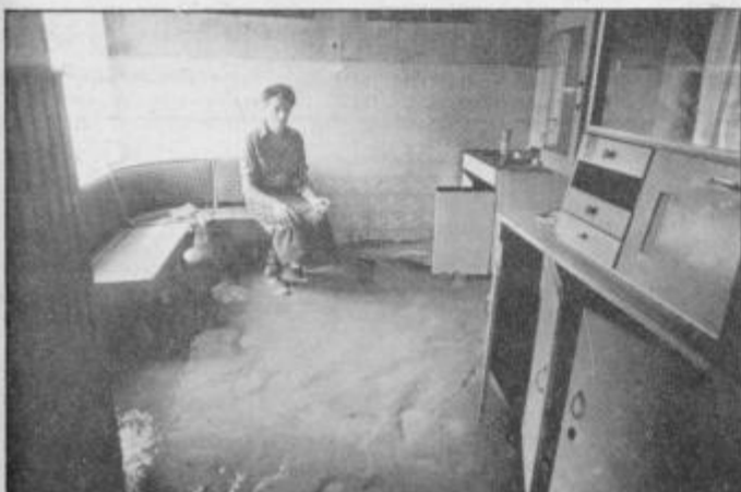
. . . tam, kjer so zidovi le ostali, pa so hiše polne mulja in blata, vse je vlažno in premočeno.