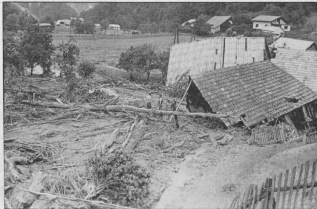
Pri Haložanovih v Planjskem 21 je hudournik s Korošaka napolnil nekaj sto kubikov blata in drevja. Zaspalo je gospodarsko poslopje in del hleva . . .