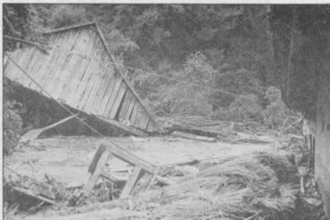
Voda in blato sta storila svoje, hiše in poslopja so izginjali v dolino.