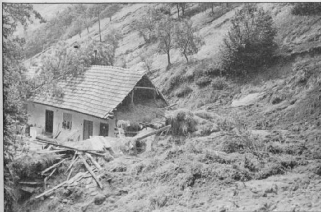
Tominčevim v Planjskem 18 je zemeljski plaz grozil že pred leti, tokrat pa je bil rušiten. Odnese je pol hiše s švinjami in kokošmi vred.