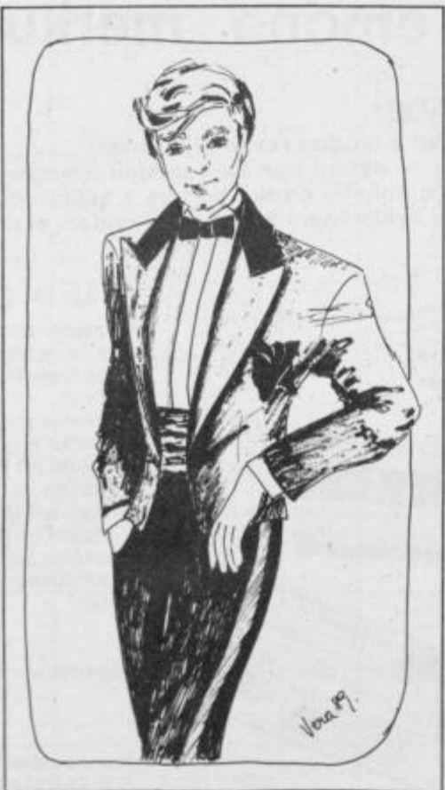
Ena od možnosti za smoking.

V Italiji so moderne vzorčaste srajce, celo s cvetličnimi motivi, največkrat je osnova temna, vzorec pa v svetlih tonih. Srajca in hlače sta lahko v isti barvi, sako pa naj bo v drugi, največkrat svetlejši; rokave na sakoju lahko podvihate, tako boste bolj atraktivni.