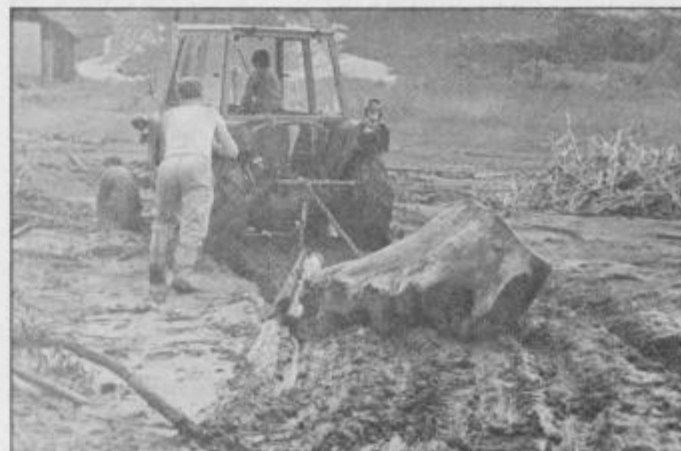
Dvorišča so bila polna blata in raznih naplavin, pa jih je treba čimprej odstraniti.