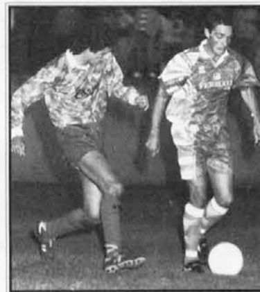
Prvi sezonski derby Vesna-Zarja so si presenetljivo zagotovili Križani

V nedeljo, 15. t.m., je več naših enajsteric nastopilo v pokalnih tekmah. V italijanskem pokalu sta tako Primorje kot Zarja ostala praznih rok proti izkušenima ekipama Manzaneseja in San Sergia. V deželnem pokalu je Vesna zamudila priložnost proti San Giovanniju, medtem ko sta slavili postavi Brega A in Krasa. V zadnjem srečanju deželnega pokala za ekipe 3. amaterske lige je druga postava Brega doživela polom, saj ji je Portuale nasul kar 7 golov.