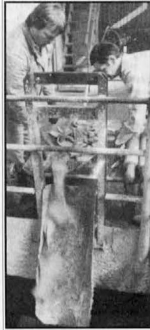
Odlaganje azbestocementnih odpadkov, strupen opravek

Delavci in uslužbenci poslovnega sistema Salonit v Anhovem bodo 20. decembra letos prenehali izdelovati azbestocementne proizvode. Slednji, kot tudi nekatere kritine in drugi proizvodi, namreč vsebujejo azbest, ki je zdravju zelo škodljiv. Zdaj imajo na zalogi še zadnjih 840 ton azbesta, ki ga bodo