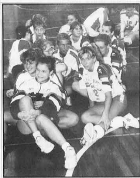
Na sliki sproščene odbojkarice nove združene ekipe Koimpex. Slika spodaj: prizor s turnirja Bazoviških junakov.