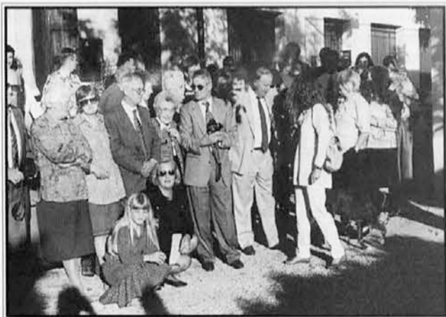
Številni člani družine Čok so se pred rodbinsko hišo nastavili fotografu

V soboto, 7. septembra, so se v popoldanskih urah lepega sončnega dneva zbrali pred dvoriščem rodbinske hiše v Lonjerju predstavniki družine Čok - "Pušarjevi". Prvi Čokadi je prisostvovalo 55 potomcev številne in zavedne slovenske družine, katere zgodovina in izvor segata v daljno preteklost našega mesta. Med drugim je treba omeniti, da so Čokovi obdelovali zemljo na področju sedanjega Drevoreda XX. septembra (akvedota). Nekateri družinski člani so se pre-