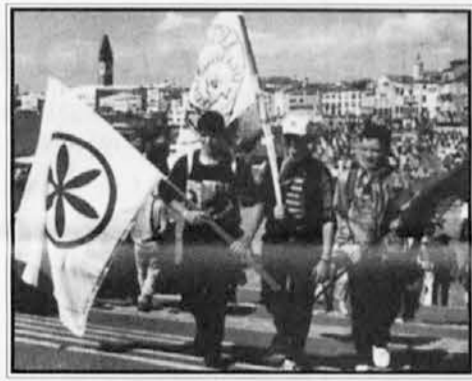
Legini "secesionisti" med pohodom na Benetke

Manjšina se ob problematiki državnih centralizmov kaj lahko ujame v past, v kolikor gre za takšno narodnostno skupnost, ki se zaradi dediščine poveljnega obdobja sploh še ni celovito vzpostavila. V tem primeru za manjšino ne velja isto kot za državni centralizem Italije, ki ga je treba presejati tako, da popustijo in se razvežejo njegove spone. Manjšina, ki je še vedno le vsota političnih subjektov in ni našla organiziranosti, ki bi enakovredno ter zavezujoče povežala vse različnosti, stoji pred na videz povsem drugo nalogo, ki pa jo ravno tako prišepetava zakonitost novega časa: mora se utemeljiti kot narodna skupnost. Zaradi tega bi mogla trditi, da je razstavljanje centralizma za državo isto kot vzpostavitev enovitosti za manjšino. V obeh primerih gre za težavne, vendar nujne procese.