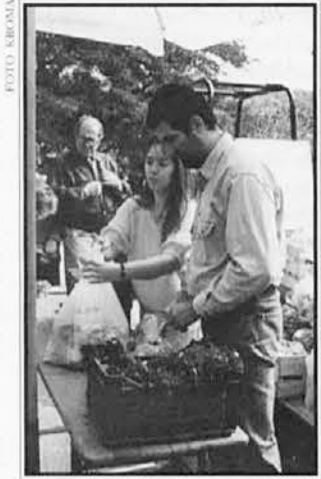
V okviru pobude Odperta meja 1996 je potekal tudi sejem domačih pridelkov

V soboto in nedeljo, 14. in 15. septembra, je bila v Gročani tradicionalna jesenska prireditev Odperta meja 1996 . Priredili sta jo občini Dolina in Hrpelje-Kozina skupaj z domačim kulturnim društvom Krasno polje.