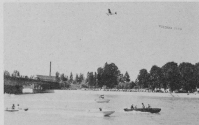
Ptujskim brodarjem so se pridružili tudi člani Aerokluba Ptuj s pozdravi tovarišu Titu

je zaključila svojo pot v šopku najlepših želja, ki smo jih včeraj izrekli tovarišu Titu ob njegovem jubileju, ki je tudi jubilej vseh nas, naš skupni praznik. MG