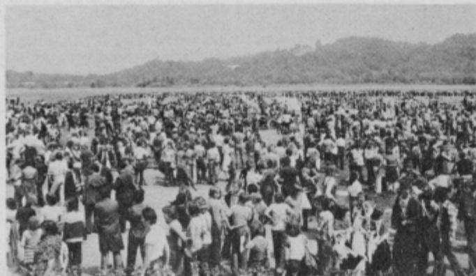
Na letališču v Moškanjcih se je zbralo nad 5 tisoč mladih iz ptujске občine.