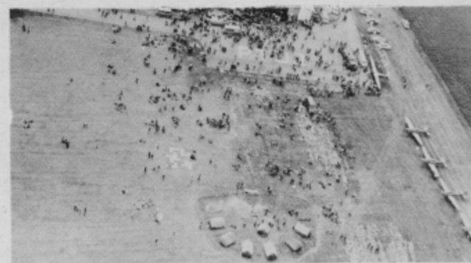
Mladi radovedneži v propagandnem taboru na letališču.