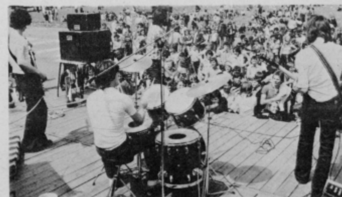
Za konec so mlade presenetili še člani uspešne rock skupine Horizont iz Ljubljane.