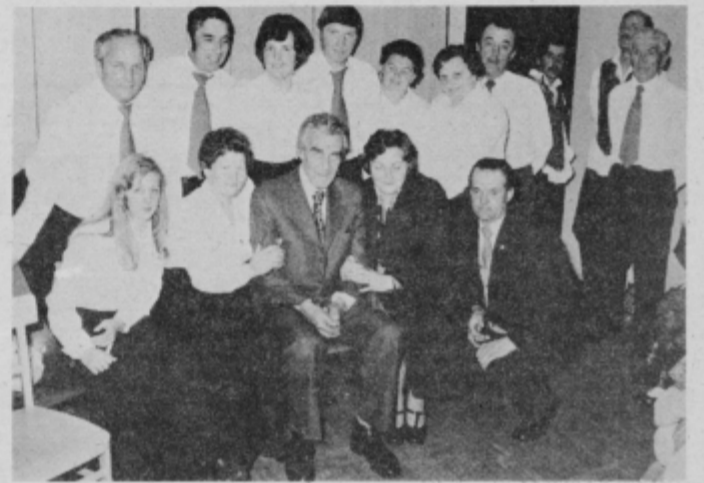
Mešani pevski zbor „Ruda Sever“ iz Gorišnice v družbi z gledališkim igralcem Jožetom Zupanom, na proslavi v Ptuj 8. aprila 1977