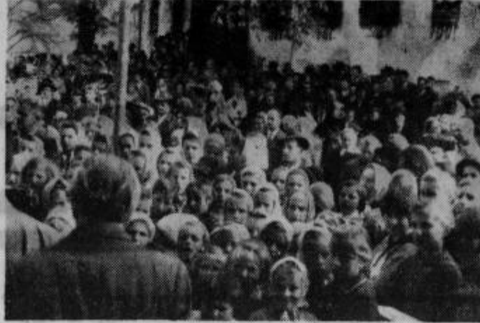
Zbrano ljudstvo ob otvoritvi zdravstvene postaje