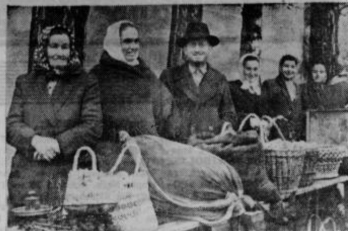
Včasih na ptujskem trgu ni popušanja

njo brzino. Vprašanje je le, kako bodo uspeli na zunanjem tržišču, kjer zanje velja visoka carina. Razen tega imajo močno konkurenco v starem Volkswagenu in v Fičkotu.