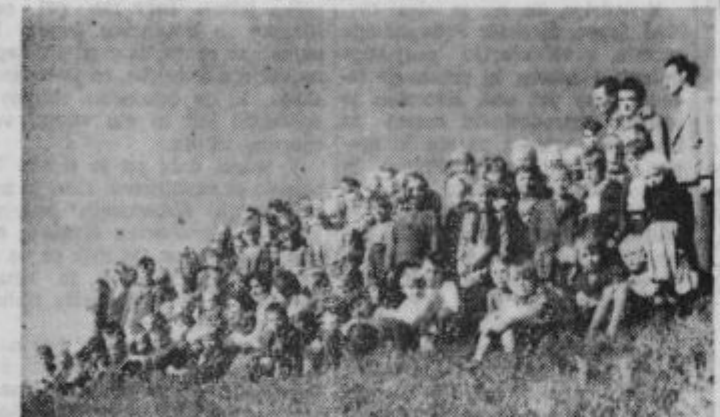
156 nas je z vseh okoliških hribov

Z vzpetine severno od šole je krasen razgled na vse strani. Vj.