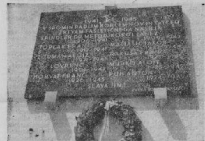
Spominska plošča na steni zdravstvene postaje

Mnogi gostje in domačini so prišli na povabilo tov. Martina Slodnjaka na ogled prostorov. (Nadaljevanje na 2. strani)