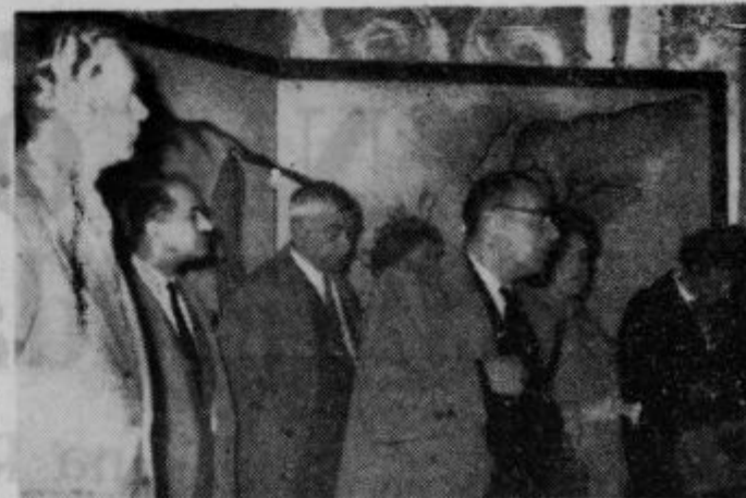
Otvoritev razstave v Ptuj