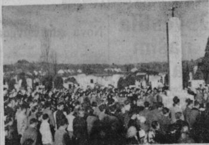
KOMEMORACIJA 1. novembra pred spomenikom borcev na ptujskem pokopališču

Celotna naročnina za tuzemstvo 1000 din, za inozemstvo 1500 din