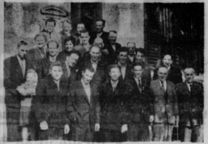
Odborniki SZDL in združenih odborov na slovesnosti