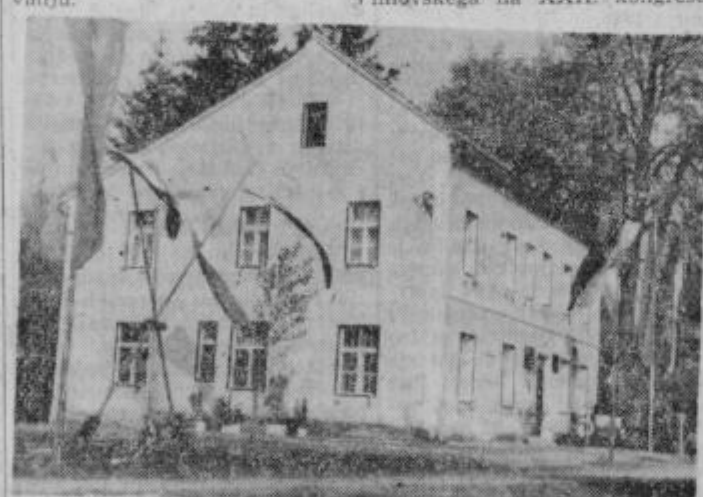
Lepo urejena zdravstvena postaja

na želja po zdravstveni postaji a stalnim zdravnikom. To je za Juršince praktičen spomenik na padle borce, ki bo dobro in vsakodnevno služil zdravstveni zaščiti delovnih ljudi in njihovega zdravstvenemu prosvetljevanju.