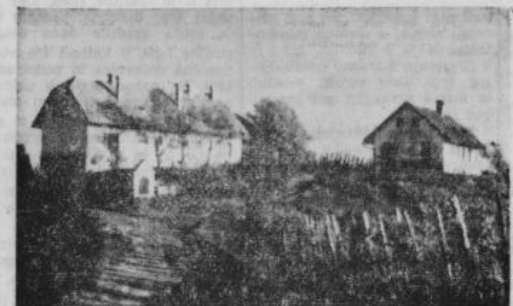
Levo — učiteljski dom