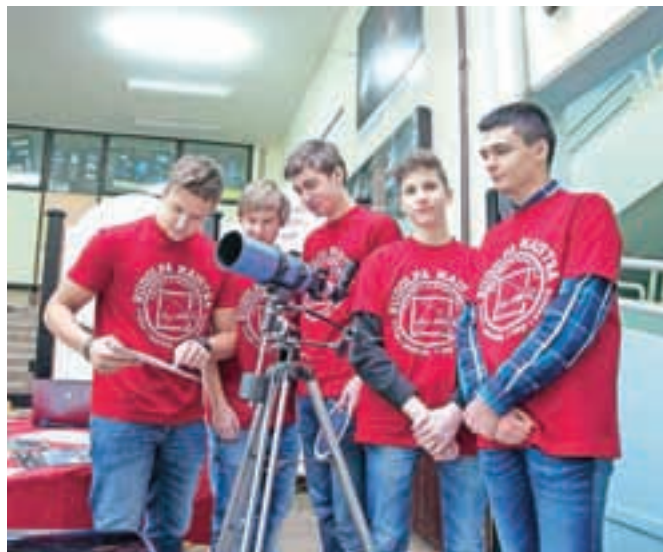
Dijaki so zelo aktivni v različnih obšolskih dejavnostih, uspešno se udeležujejo tudi tekmovanj.

turantskega plesa vsi dijaki usvojijo plesne korake in s tem prihranijo pri tečajih. Po besedah ravnatelja imajo posluh tudi za dijake, ki vzporedno opravljajo še eno srednjo šolo. Bodoči dijaki imajo čas za vpis v srednje šole do 4. aprila, zato na GSSRM še ne morejo reči, ali bodo zaradi prevelikega števila kandidatur omejitve vpisa. »Lansko