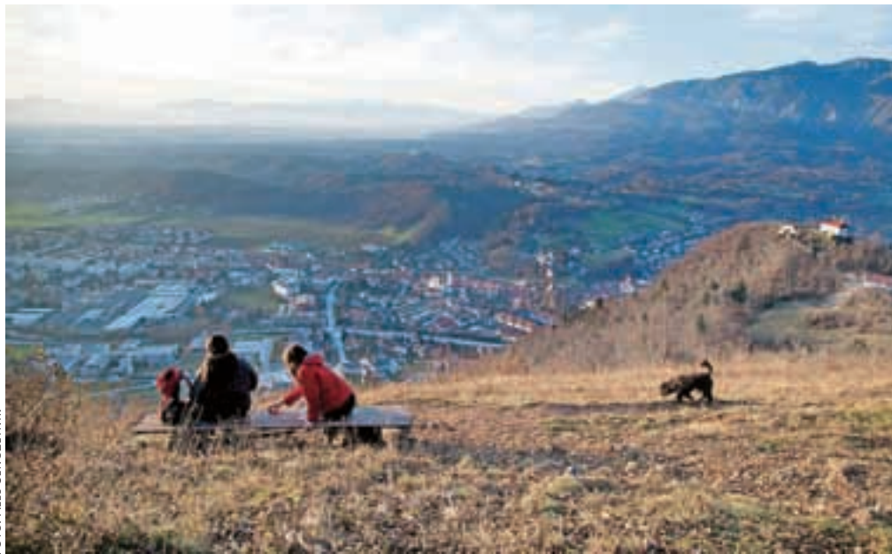
S koeficientom 1,19 se Kamnik uvršča na 24. mesto po razvitosti slovenskih občin.

Kamnik – Po podatkih Ministrstva za finance je vrednost koeficienta razvitosti občine Kamnik 1,19, kar ga uvršča na 24. mesto po razvitosti med vsemi slovenskimi občinami. Med okoliškimi občinami prednjači predvsem Trzin, ki je s koeficientom 1,47 najbolj razvita občina v državi. Sledita mu občini Domžale in Komenda s koeficientoma 1,34. Koeficient razvitosti občin je izračunan na osnovi desetih kazalnikov: osnove za dohodnino na prebivalca občine, števila delovnih mest na število delovno aktivnega prebivalstva, bruto dodane vrednosti gospodarskih družb na zaposlenega, indeksa staranja prebivalstva občine, stopnje registrirane brezposelnosti na območju občine, stopnje delovne aktivnosti na območju občine, deleža območij Natura 2000 v občini, deleža prebivalcev, ki imajo priključek na javno kanalizacijo, poseljenosti občine ter kulturnih spomenikov in enot javne kulturne infrastrukture na prebivalca in kvadratni kilometer. Med posameznimi kazalniki se je občina najvišje uvr-