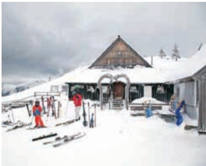
Smučarji in ostali pohodniki se lahko okrepčajo na zgornji in spodnji postaji sedežnice.