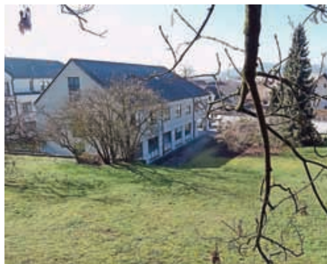
Nova parkirišča bodo uredili na sedanjem travniku za pediatričnim traktom zdravstvenega doma.