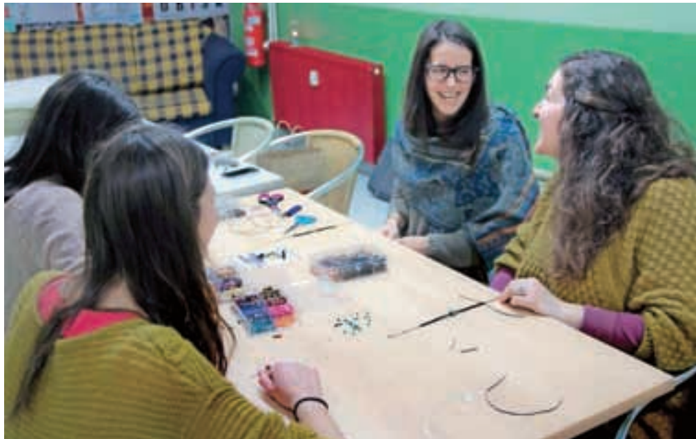
V Kotlovnici je nedavno Manca izvedla že peto ustvarjalno delavnico. Na tej so se Kamničanke spoznavale z izdelovanjem makrame zapestnic.

paj ustvarjalni pogled na svet zaključita v celoto. Manca ima svoj atelje v prostorih Doma kulture Kamnik, zato v Kotlovnici pripravlja ustvarjalne delavnice. Med drugim je že izvedla delavnico izdelave lovilcev sanj in nakita iz njih, kvačkanih trakov za lase, prstanov iz žice in makrame zapestnic. Kam jo bo popeljalo njeno ustvarjanje, še ne ve, a v prihodnje si ne želi le navdiha in dobrih kreacij, temveč tudi povezovanja različnih ustvarjalcev v kreativno mrežo, ki bi morda tudi spreminjala svet.