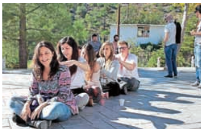
Člani Mladinskega centra Kotlovnica so lani sodelovali v več mednarodnih projektih.

Veseli smo, da se bo število izmenjav in usposabljanj v tem letu še okrepilo, k njim pa vabimo vse mlade, ki jih zanima potovanje ter pridobivanje izkušenj na najrazličnejših področjih. Kontaktirajte nas na info@kotlovnica.si ali international@kotlovnica.si.