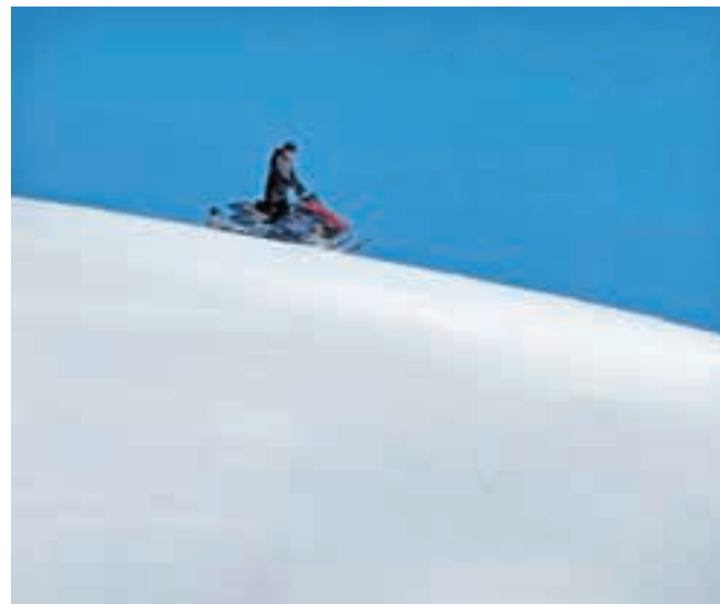
Na Veliki planini se ponavlja stara zgodba: kljub prepovedi motorne sani divjajo po vsej planoti.