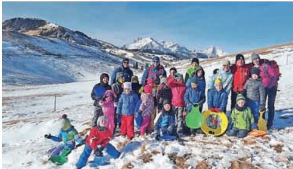
Tabora, imenovanega Vesele Gorice v snegu, so se otroci udeležili brez telefonov in elektronskih igrice, a so se kljub temu imeli zelo lepo.

Projekt Vesele Gorice, ki ga sofinancirata Planinska zveza Slovenije in Občina Kamnik, v sodelovanju z Društvom Gorske reševalne službe Kamnik, je inovativna ideja taborjenja za otroke in mladostnike, so še razložili v Mladinskem odseku Planinskega društva Kamnik.