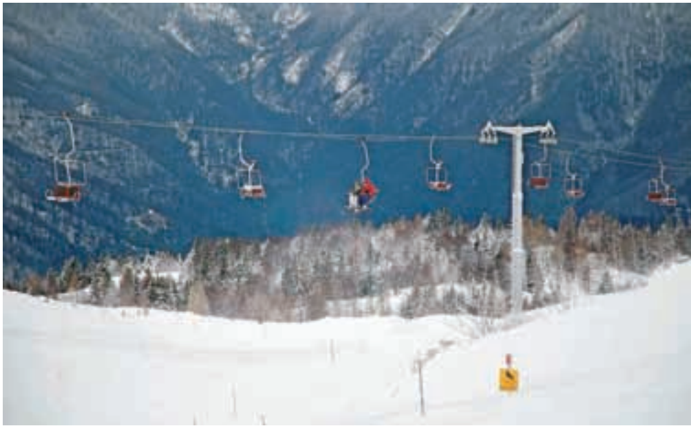
Po lanskoletni obnovi sedežnice so na Veliki planini v preteklih dneh le dočakali dovolj snega, da so lahko odprli smučišče.

Smučišče na Veliki planini se sicer razteza med 1412 in 1666 metri nadmorske višine, kjer na smučarje čaka 2,7 kilometra dolga srednje zahtevna proga Šimnovec, najmlajšim in začetnikom pa je na voljo tristometrski proga Jurček.