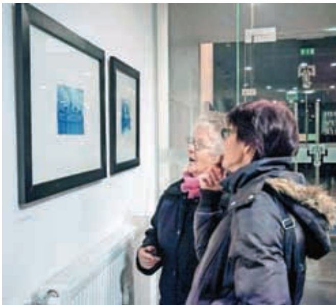
V Foto klubu Kamnik so pripravili razstavo v stari tehniki cianotipiji.

Po besedah Egona Bajta, avtorja spremnega teksta, pa se v klubu nadejajo, da bo cianotipija morda spodbuda, da se kakšen član še bolj resno loti alternativnih fotografskih tehnik in morda v prihodnje pripravi celo samostojno razstavo. V Foto klubu Kamnik sicer odlično deluje polno opremljena temnica, v kateri deluje kar nekaj članov, navdušencev nad analogno fotografijo. Rezultati dela so bili vidni že na Odsevih preteklosti iz prejšnjih let. Med drugim so se lotili tudi fotografiranja s camero obscura , preprosto škatlico z zelo