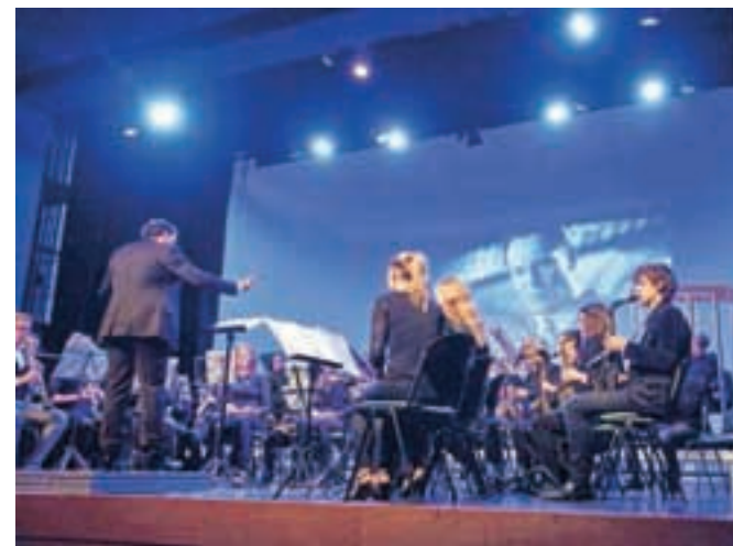
Člani Pihalnega orkestra DKD Solidarnost so navdušili na koncertu v Domu kulture Kamnik.