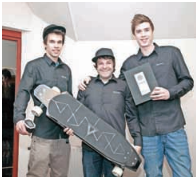
Del ekipe Revoll, ki je s svojo električno karbonsko rolko navdušila na sejmu ISPO.

Ekipo se ne zanaša le na oblikovno dovršenost izdelka. Dodobra so izpopolnili tudi druge elemente. V rolki sta nameščeni dve bateriji,