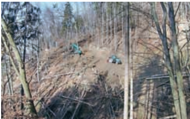
Lastniki gozdov tudi dve leti po žledu še niso odpravili vseh njegovih posledic.

zime 2015/2016. "Zaradi tega vzroka je bilo evidentirano 28.259 dreves smreke v skupni bruto izmeri 32.225 kubičnih metrov. Lastniki gozdov so do konca leta 2015 posekali tri četrtine evidentirane količine," je dejal Zabret in ob tem opozoril, da je treba sanacijo označenih neposekanih dreves, ki so napadena s