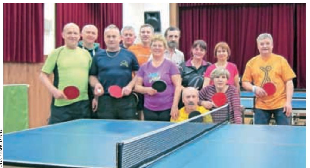
Na Lazah v Tuhinjski dolini je namizni tenis zelo priljubljen tako med otroki kot odraslimi.

uspe le pripraviti turnir za najmlajše. Da je navdušenje nad celuloidno belo žogico res veliko, nakazuje skupno druženje ob namiznoteniški mizi tudi v poletnih mesecih. "Namizni tenis nam je zelo všeč, saj je zabaven in hiter, pa tudi tisti zvok plastične žogice je vedno prijeten. Sploh ko igra dobi hiterost in se udarci žogice na mizo slišijo skoraj kot tikkanje ure," v en glas hitijo z razlago najmlajši igralci, stari od osem do enajst let.