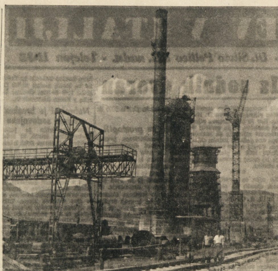
V Zenici, kjer gradijo največji metalurški kombinat v Jugoslaviji, so te dni zaključili montažo železne konstrukcije visoke peči. To je največja peč v državi in bo dnevno proizvajala 600 ton surovega železa — dvakrat več od dosedanjih proizvodov vseh peči v Jugoslaviji. To je prva od dveh visokih peči, ki jih bodo zgradili v Zenici. Stara železarna v Zenici dela dalje, a okrog nje rastejo iz zemlje: nova jeklarna, težka valjalna, kovačnica, omenjeni novi visoki peči, koksarna itd. Grade tudi železniško postajo in regulirajo reko Bosno. Za sedaj namreč porabi železarna toliko vode kakor glavno mesto Jugoslavije — Beograd