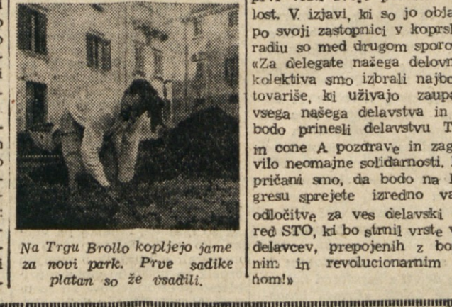
Na Trgu Brolo kopljeje žame za novi park. Prve sadike planto so že osadili.

Gospodarski odsek VUJA javlja, da je v letu 1950 povečan izvoz blaga iz jugoslovanske cone STO v angloameriške cone STO... Izvoz in uvoz blaga v jugoslovanski coni STO