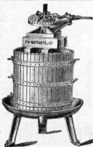
Stiskalnica za vino.

in OLJKE so naše stiskalnice „ HERRUK “ najnovjega in najboljšega sestava z dvojnimi in nepretrganimi pritiskalom; zajamčeno najboljšo delovanje, ki prekaša vse druge stiskalnice; hidravlična stiskalnica, najboljša avtomatične patentno-„SYPHONIA“ ki dolujajo same vane škropilnice „ SYPHONIA “ od sebe, ne da bi jih bilo treba goniti. Plugji, mlinci za grozdje, sadje in oljke. Kobkalnice za grozdje. Vinogradski plugji. Sušilnice za sadje in druge vegetalne. Žy-ljensko in mineralne pridelke. Stiskalnice za seno, slamo itd. na roko. Mlatilnice za žito, čistilnice, rešotalnice. Slamo-rezalnice, ročni mlinci za žito v razni velikosti in vsi drugi stroji za poljedelstvo, žedelnice in prodaja z jamstvom kot posebnost najnovjajo, izborne izkušene, kot najboljšo pripoznano in odlikovano sestavi