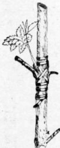
Pod. 21. Trtno cepljenje v sklad na členu.

Zelena cepljenje je najboljše opraviti meseca maja, koj ko doseže mladika primerno krepkost. V vetru naj se ne cepi, ker posuši veter prehitro prerezo in se zato cepič težko sprime. Vroče vreme pospešuje raščo, radi tega bo uspeh v takem vremenu mnogo boljši nego v hladnem. Uspeh pa je odvisen mnogo tudi od cepljarja samega. Čim bolj hitro se cepi, manj časa ostaja rana razpostavljena zraku, tem lažje se mladiki sprimeta.