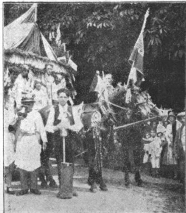
Skupina iz Velike vasi se pripravlja na odhod.