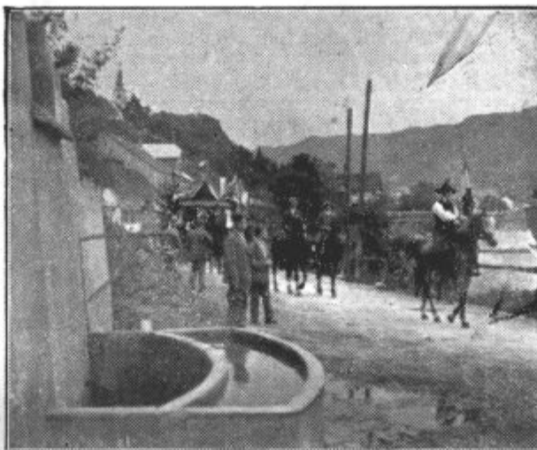
Konjeniki otvorijo sprevod.

Ob tej priliki se hvaležno spominjamo one skrbi, katero posvečuje tem in drugim vprašanjem našega poljedelstva in združništva Nj. Vel. kralj, ki je pobornik vsega napredka, naš prvi zadrugar in zaščitnik našega seljaka. Zato mu kličemo sinovi Jugoslavije: »Živel naš kralj Aleksander I. Karagjorgje!«