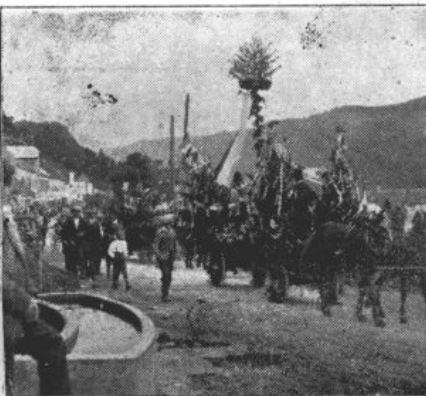
Sprevod se pomika iz mesta na Krško polje.