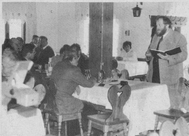
Zbor govedorejcev je bil v Šport centru Prodnik v Juvanju

Naše društvo se povezuje v Zvezo rejcev rjave pasme Slovenije, kjer imamo svojega delegata. Letošnje leto nam je bila zaupana organizacija letne skupščine Zveze rejcev rjave pasme