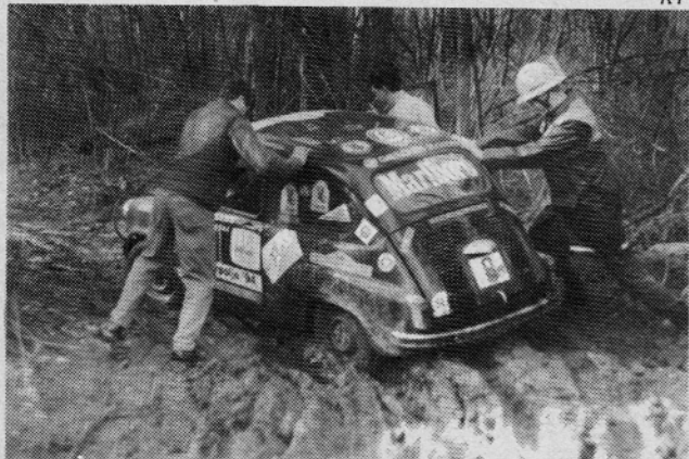
V globokem blatu so nekateri potrebovali "Ročni pogon"