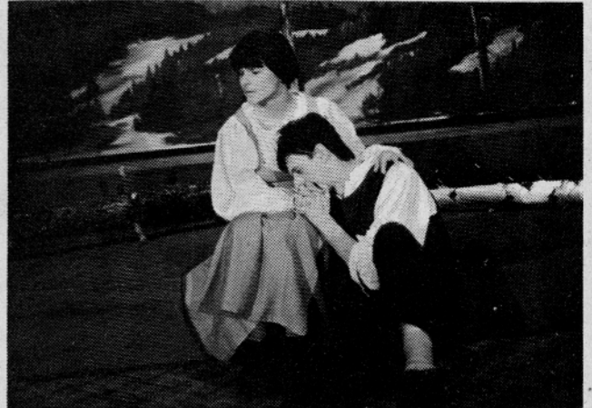
"Jaz ne bom nikoli rekla, da je bil moj ljubi revšej..."