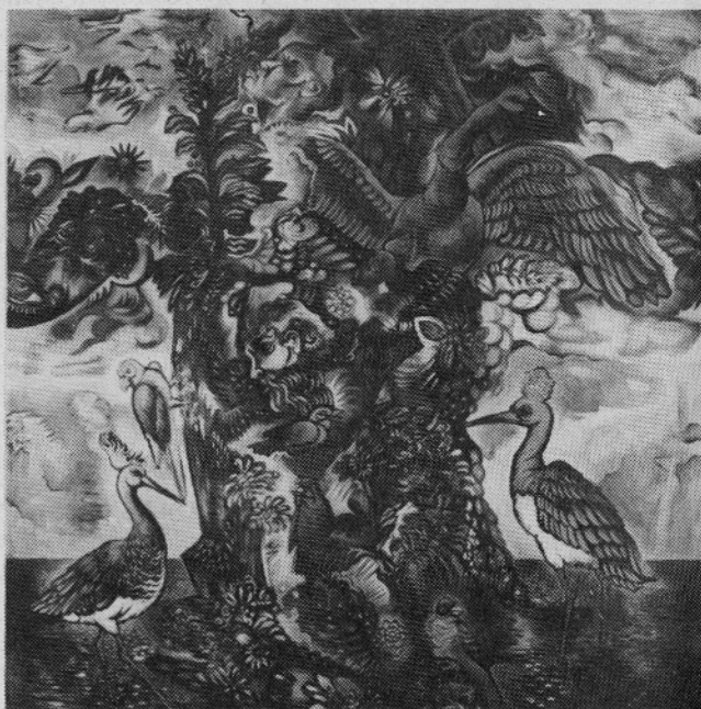
"Prebujajoči otok", 198 x 198 cm, olje-platno 1993