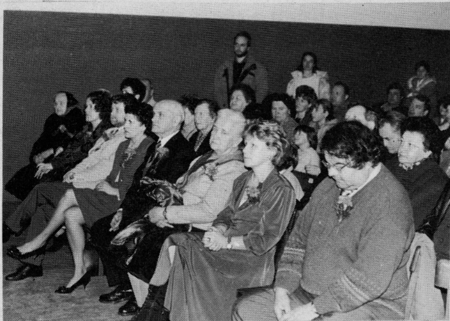
Dobitniki zlatih plaket s priznanjem