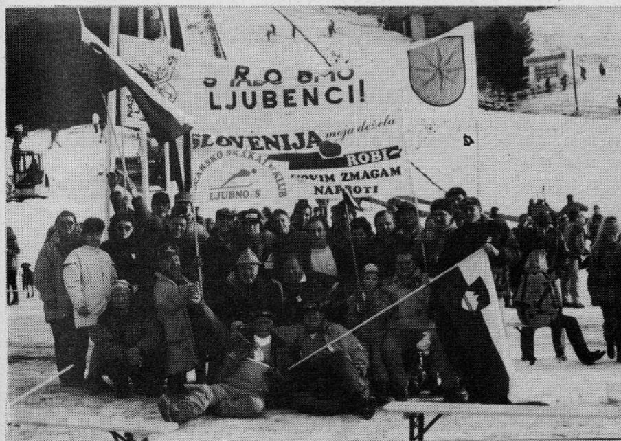
Zmagali so ljubenski navijači