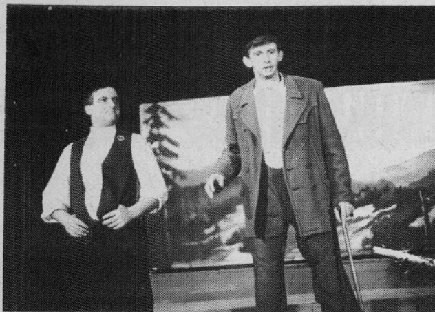
"Ko bodo mati povedali, potem bom dobil, kar mi po pravici gre."