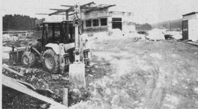
Dela na bencinskem servisu uspešno napredujejo

ŽUPNIJA REČICA OB SAVINJI išče primer- no osebo za poučevanje verouka na Rečici ali pri podružni cerkvi na Gorici.