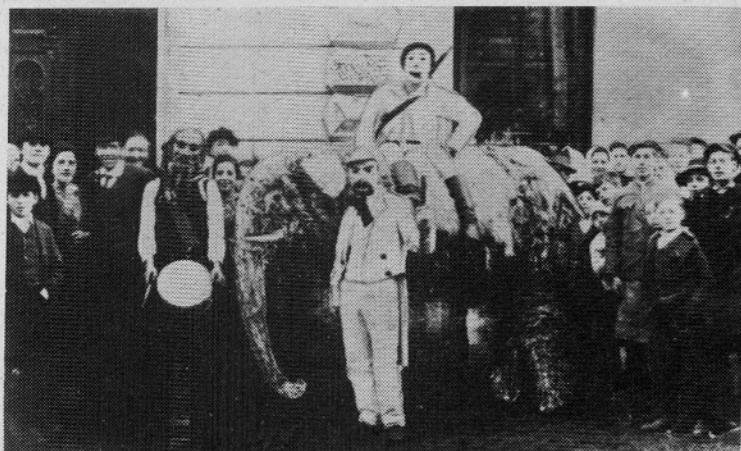
Mozirski pust I. 1911

tako so rekli, pa ni bilo vselej tako. Pogosto so se zamere vlekle iz leta v leto in marsikdo je vzel pustno "kleščenje" preveč osebno, morda je tako še danes, čeprav je pojem "tržana" že pozabljen. Vsekakor je že dolgo tega, ko so na pustni torek, po trgu "močniki" preganjali otroke. Šlo je za pustne šeme, ki so bile po obrazu namazane s sajami in z njimi so še mimoidoče namazali ... To je po sedanjih virih najstarejša oblika pustne "norije" v Mozirju. Ker pa je Mozirje premoglo od nekdanj zelo duhovite ljudi, se je pustovanje tudi posodabljalo in bilo je takorekoč na tekočem. Povsem pravilna je odločitev, da se mozirski pusti poslej ne bodo držali le trških meja in da bodo svoje delovanje razširili po dolini, saj na ta način prenašajo pustovanje še v druge kraje, čeprav so pustovanja bila in so še tudi kje drugje, ne le v Mozirju. Pri tem napornem delu želimo mozirskim pustom mogočen zalet in vse mogoče "poslovne" uspehe.