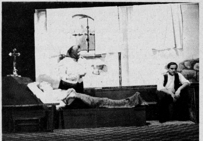
"Ne, Karnic pa ne bomo delili!"