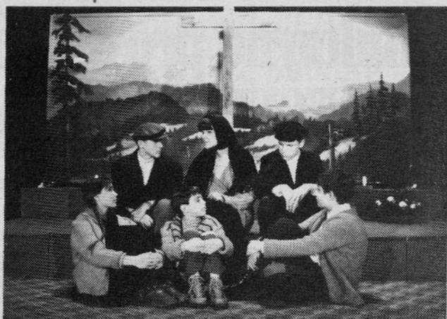
"Vi niste kakor drugi otroci... Vi ste samorastniki."