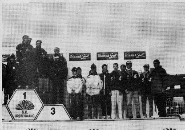
Na razglasitvi rezultatov