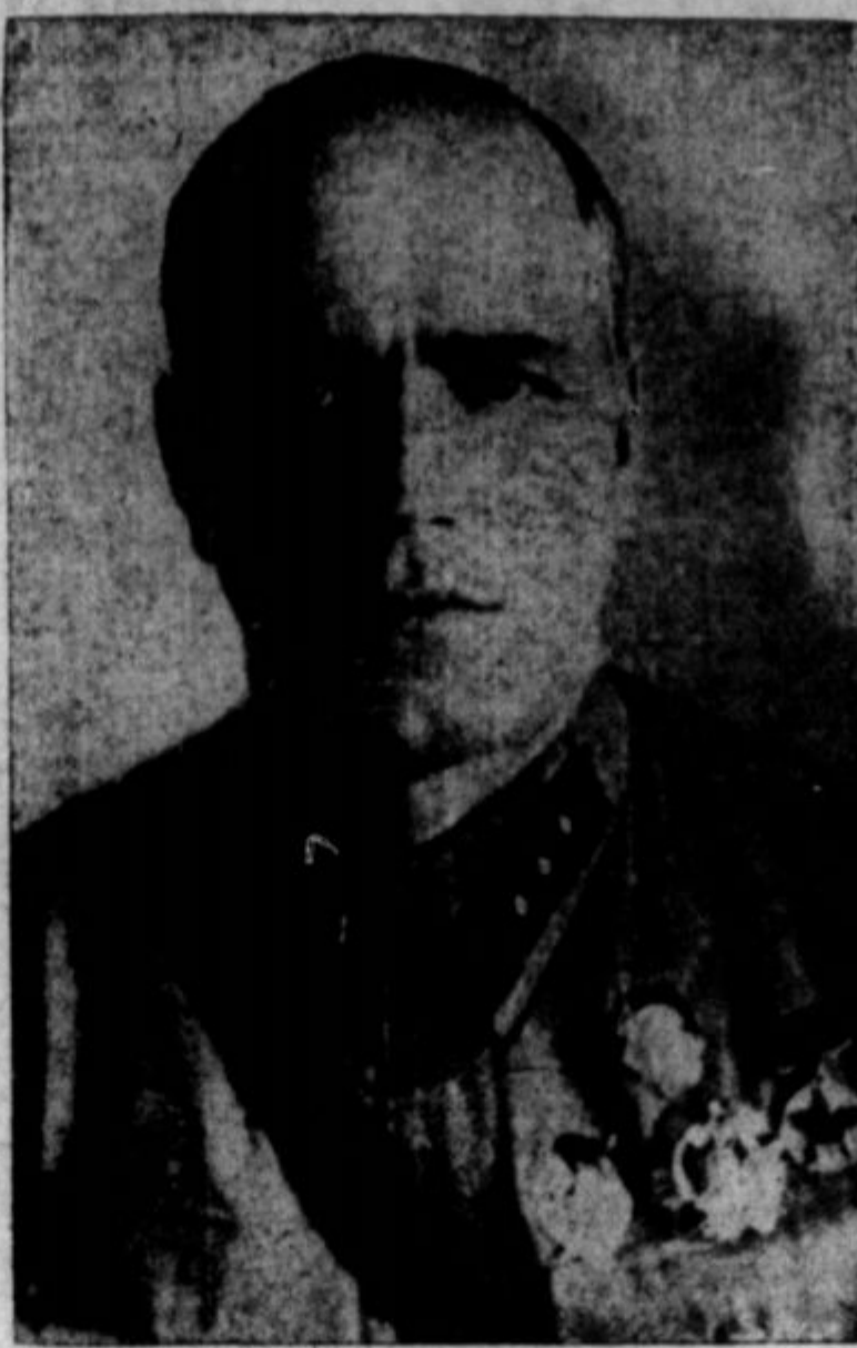
Za vrhovnega poveljnika sovjetske armade, ki brani Moskvo, je bil pred dobrim tednom imenovan general Gregorij Zukov. Star je 46 let. Pred par leti se je proslavil v Sibiriji in v Vnanji Mongoliji, ko je odbil japonske napade.