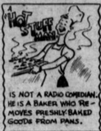
IS NOT A RADIO COMEDIAN. HE IS A BAKER WHO REMOVES FRESHLY-BAKED GOODS FROM PANS.