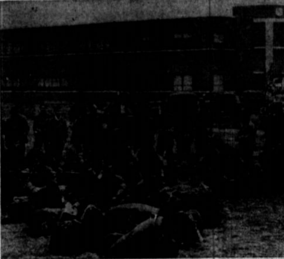
Včasih je vojaštvo, posebno državne milice, slomilo marsikako stanko, kar je bilo v korist kompanij. V sedanjem stanju pa vojaštvo tovarno enostavno vzame, stavka je s tem avtomatično končana in obrat v nji se obnovi pod vojaško upravo. Goraje je del aeroplanske tovarne v Bendixu, N. Y., ki jo je vojaštvo vzelo 30. oktobra. Citajte o tem članek v zadnjima kolonama na tej strani.