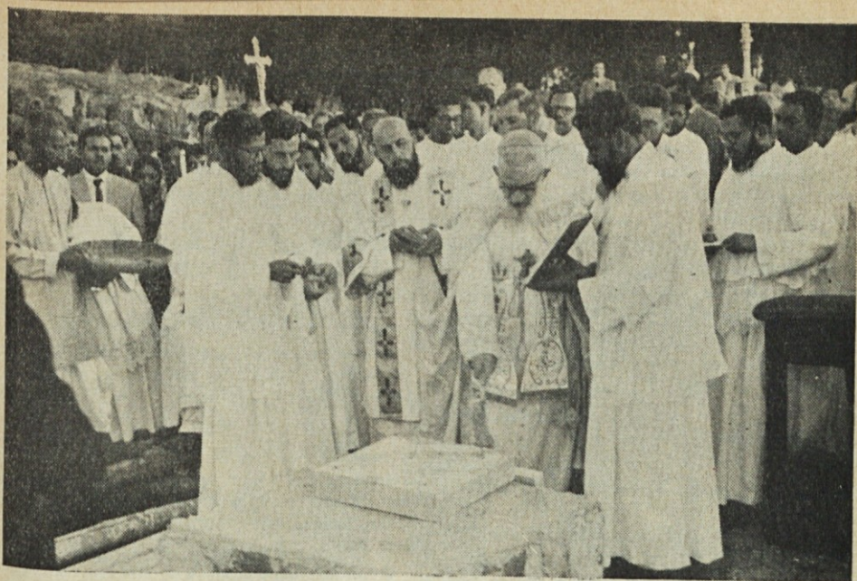
Iz misijona m. Zalaznik: Škof blagoslavlja temeljni kamen bodočega svetišča v čast sv. Judu Tadeju.

no britanskim vojakom, je prevelika za peščico današnjih vernikov. Širi se govorica, da jo mislijo prodati!