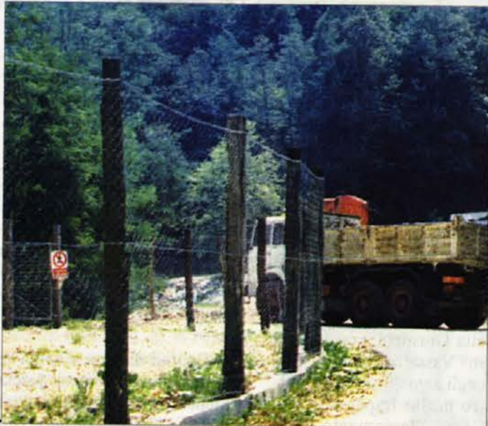
Le Valli del Natisone sono "terreno di conquista" per i cavaatori

Obvescemo cenjene bralce in naročnike, da bo prihodnja številka našega tednika izšla v četrtek, 12. januarja 2006. Naši uradi bodo zaprti do 8. januarja.