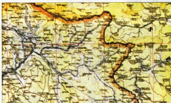
Dove passava il confine negli anni Venti

stesso tempo anche alla propria cittadinanza italiana.