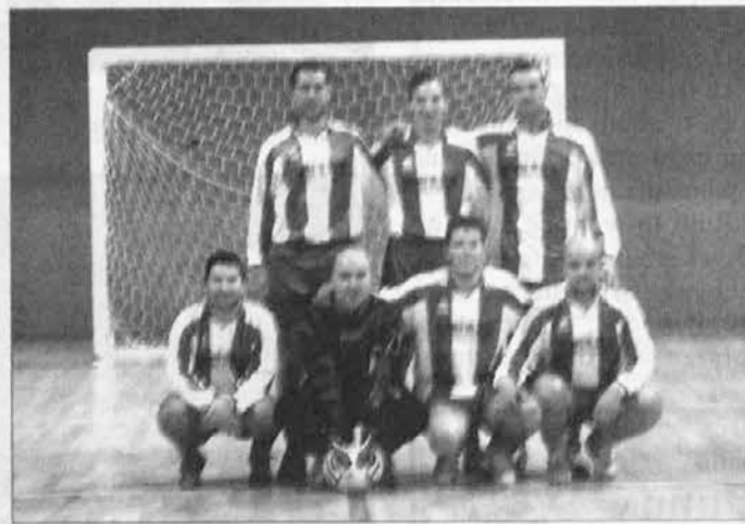
La squadra del Paradiso dei golosi che ha giocato il derby

Sono passati subito a condurre i padroni di casa