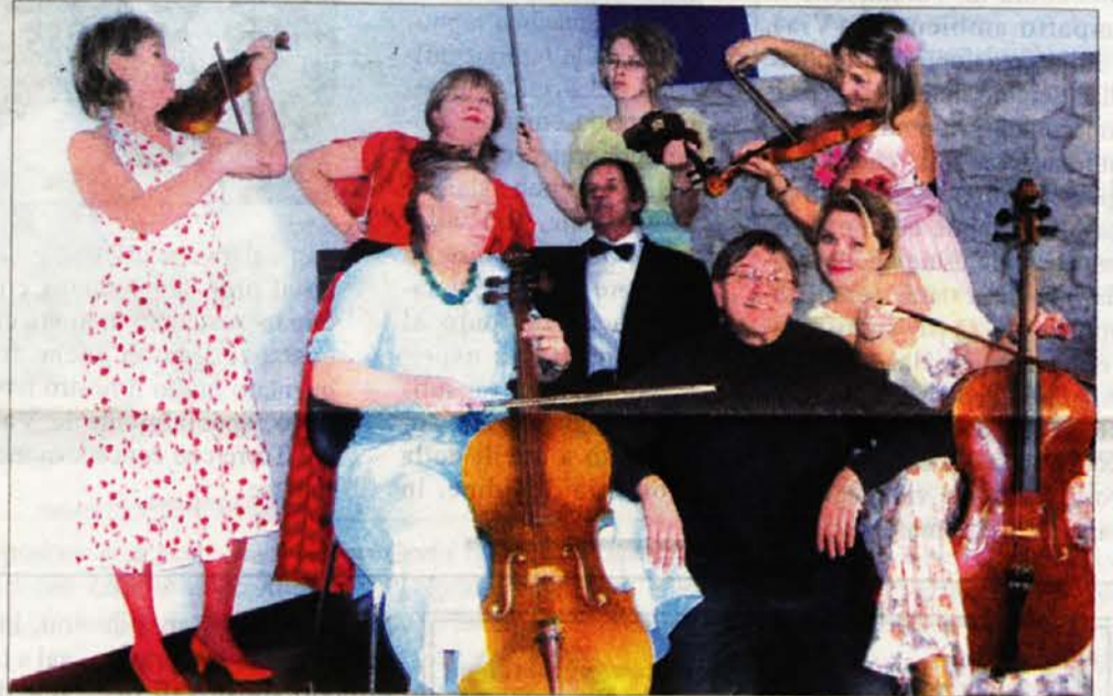
Tudi lietos nam Beneško gledališče parpravja komedijo za Dan emigranta