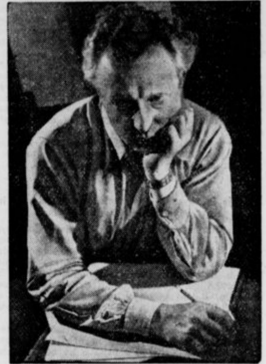
Skrivnostna, toliko slavljena filmska zvezda, Švedinja Greta Garbo, ki se doslej še ni omožila, dasi venomer pišejo listi, da se bo. In se je oglasila vest, da se omoži in da vzame za moža dirigenta filadelfskega simfoničnega orkestra, Poljaka Leopolda Stokowskega