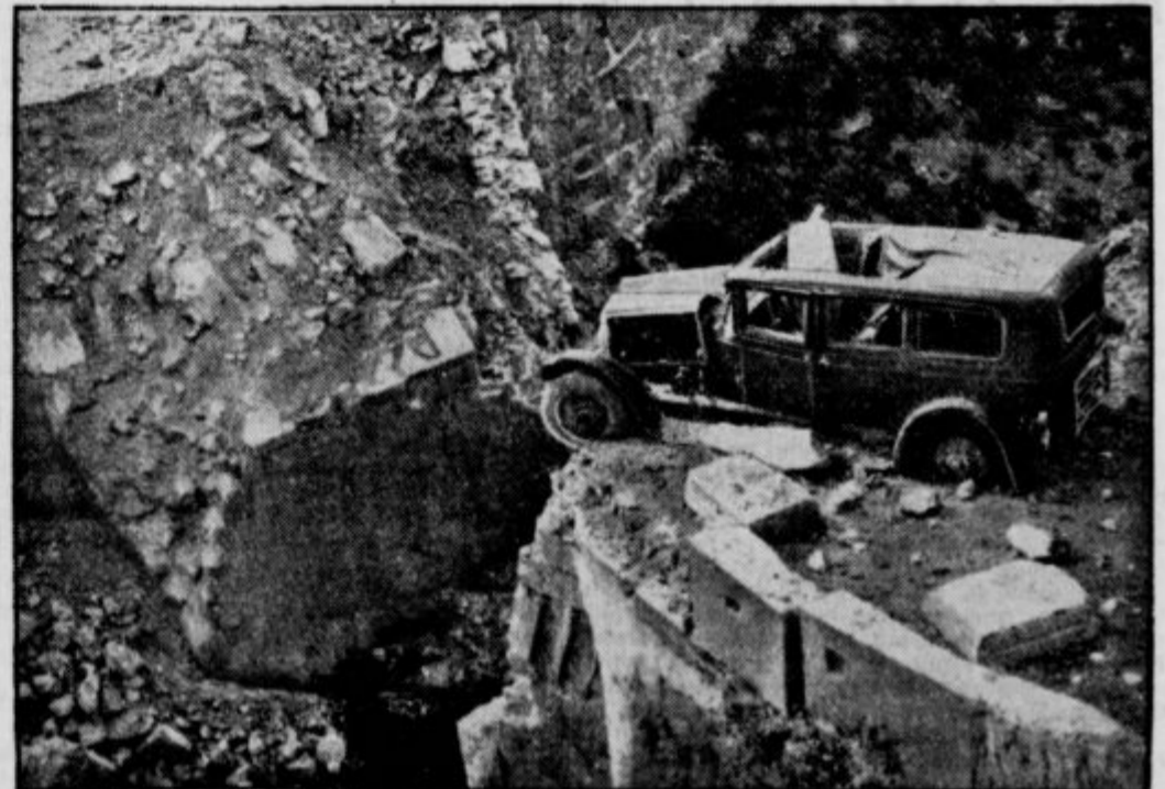
Okrog Santandra: porušeni most na cesti med Castro Urtalesom in Santandrom