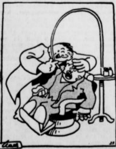
Zobozdravnik: »Ali se mo res nič več ne spominjaš, kako ste me v šoli vedno vsi mučili?«

»Ne, nič mi ni, ampak ne morem gledati, da mora ona stara ženica tamle stati, med tem, ko mi sedimo.«