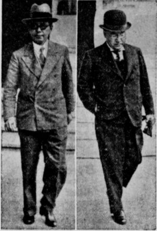
Japonski poslanik v Londonu Šiguru Josida (na levi) in kitajski poslanik Kvo-Tai-Ci (na desni). Oba vsa v skrbeh odhajata od zunanjega ministra Edena

Sredi otoka Jave stoji ognjenik Merapi. Na njegovih obronkih bivajo ljudje, saj so ti obronki celo najrodovitnejši deli Jave. Ko sem pred tremi leti prispel na Javo (pripoveduje nek raziskovalec tistih pokrajin), je ognjenik spet začel bruhati. Kar ves je bil vznurjen in od časa do časa so navpično sfrčali v nebo neznanski oblaki dima.