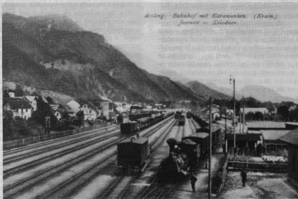
Auling, Bahnhof mit Karawanken. (Krain) Jesenice — Kolodvor.

Gorenjska pred prvo svetovno vojno je v ožjem pomenu besede obsegala območja okrajnih glavarstev Kranj, Radovljica in Kamnik, v širšem pa proti Ljubljani tudi del okrajnega glavarstva Ljubljana okolica