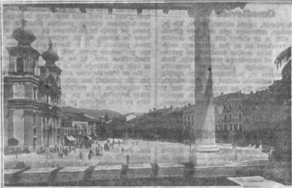
Goriški glavni trg, imenovan Travník

Zelena Vipavsko, sončna Brda in naše zavedne Gore zajemajo spet naše, domače življenje