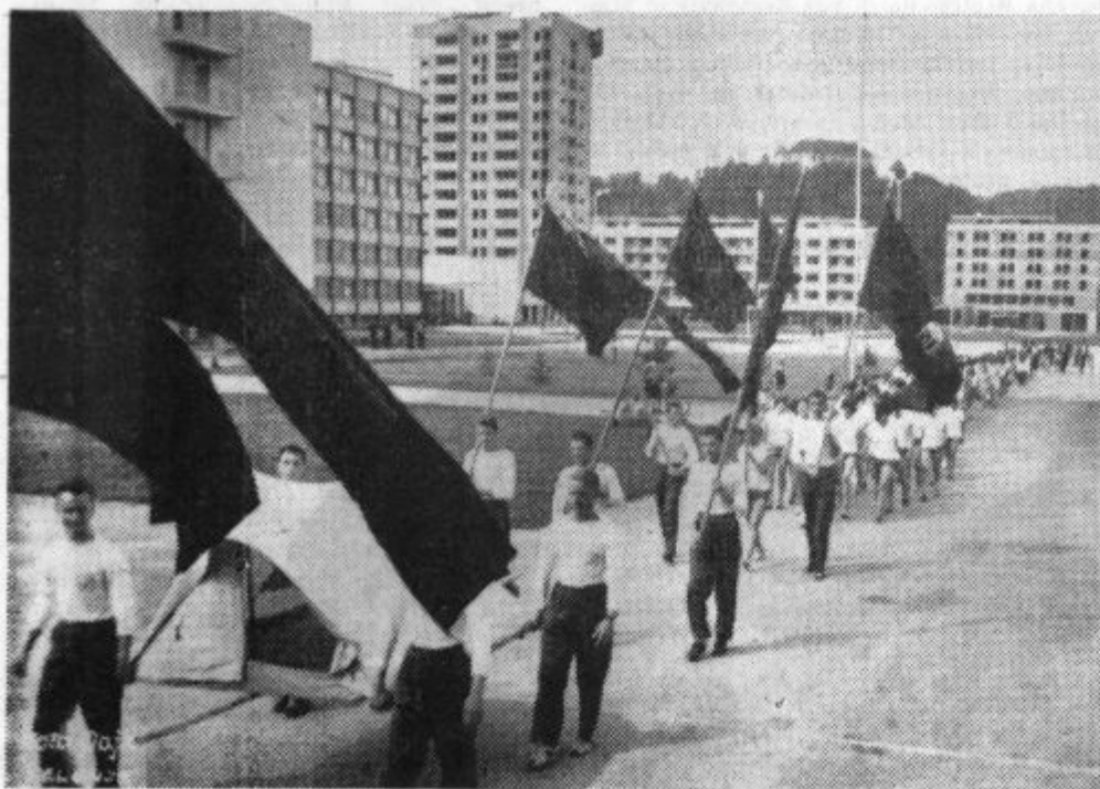
Plapolale so modre zastave naših ferijalcev

zvezi in skupščini občine za prirčen sprejem in gostoljubje. Skratka za vse, kar je bilo storjenega, da je bila to ena od najbolj pripravljenih, vsebinsko najbogatejša in najbolj obiskana skupščina. Izraze hvaležnosti pa so sprejela naša predstavništva tudi v pisni obliki.