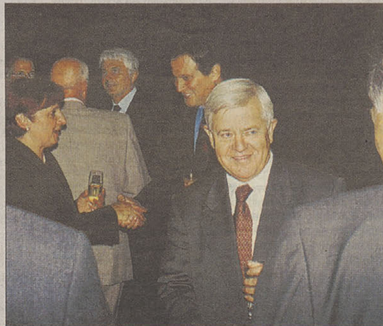
Zadovoljni obrazi gostov in gostiteljev so razvedrili tudi obraz predsednika države.