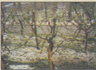
Od toče poškodovana trta v Zagriču, zato tudi trgatve v čateških gorah ni bilo.

Letošnja pridelava grozdja je bila v naši občini precej neugodna. Ponekod je puščala toča in v poletju suša. Mesec september pa je bil nenormalno deževen, z nižjimi temperaturami in malo sončnimi dnevi. Kljub temu, da je vinska trta kot rastlina večinoma povsod preživela poletno sušo, pa je suša negativno vplivala na kvaliteto letošnjega grozdja. Brez vode (vlage v tleh) je bil proces asimilacije hranil oziroma prenos mineralov in drugih snovi iz zemlje v jagode onemogočen, zavrta je bila tudi fotosinteza, saj je imela trta premalo listov. Vse to ima za posledico uvelost jagod, nato v septembru hitra napojitev jagod predvsem z vodo brez mineralov iz zemlje, slab okus in aromo grozdja, nizek procent sladkorja v jagodah, gnitje v času zorenja.