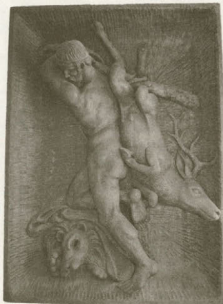
BATIST - zaščitnik lovcev

"V teh desetih letih sem izdelal okrog sto stvaritev. To so reliefi (Batist - zaščitnik lovcev 100x70 cm, jaslice, ki so velikosti 40 cm in še druge), kipci do 1 m, miniaturne kipce - starček, lovec, kurent, "putar", ljub-