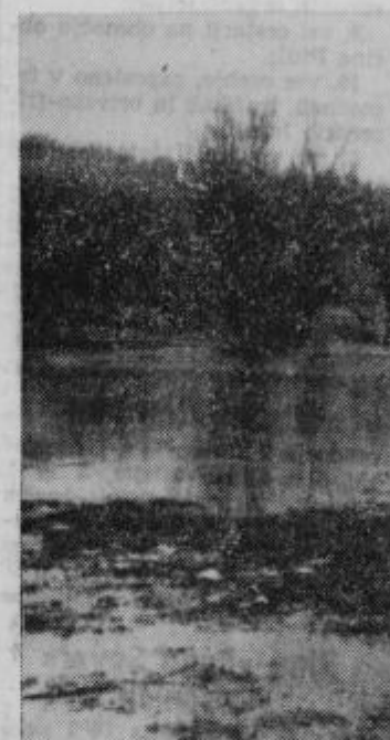
Za studenčno vodo so poplave najbolj nevarne

po sebi in zaradi posledic, nadaljnega širjenja bolezni na večje število bolezni in možnosti prenašanja celo na druga področja. Da se to ne bi moglo zgoditi, se morajo podvzeti ukrepi. Prvi ukrep je kloriranje vode, to pomeni, da se z dodatkom kloru v vodi uničijo klice, da jih uživamo mrtve in ne žive in nam ne morejo škodovati. Klor se dodaja v določeni odstopkih, tako da človeku ni škodljiv. Drugi ukrep je tako zvana sanacija, bi rekli ozdravitev vojnega zajetja, ureditev in preprečevanje dotoka oku-