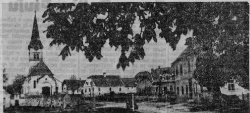
SREDIŠČE OB DRAVI