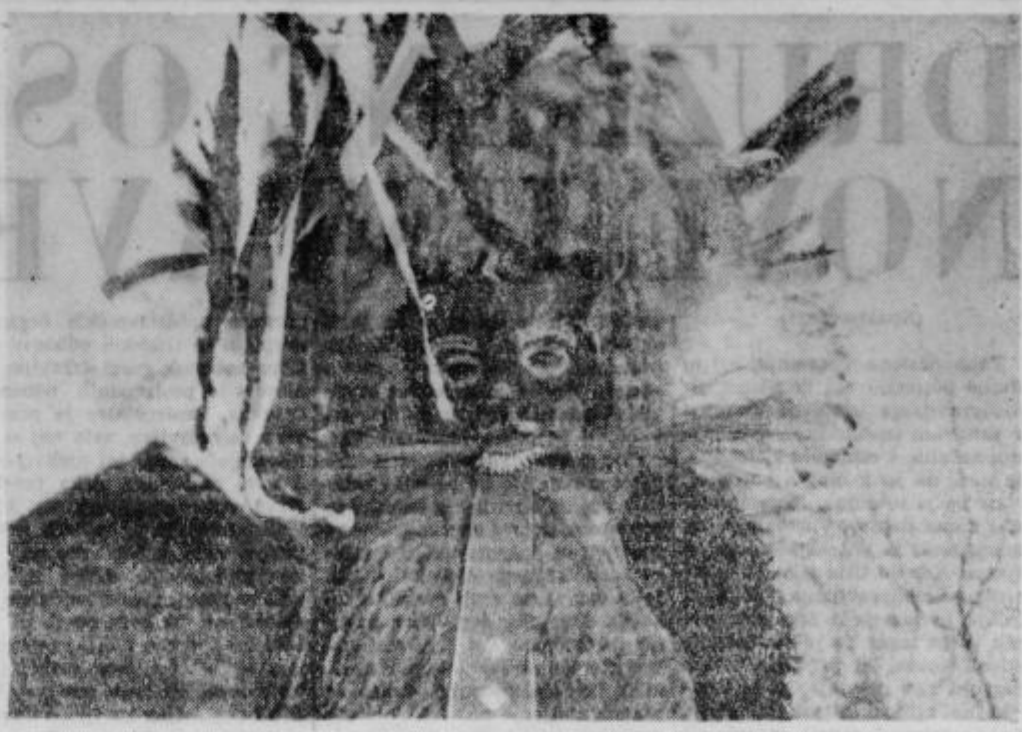
Kurentova zanimiva maska