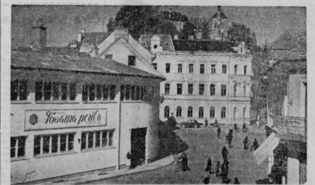
SRBSKI TRG — PTUJ

Tovarna perila in konfekcije »Delta« Ptuj zalaga trg s svojimi novimi patentiranim izdelkom najboljših srajc iz belega poplina (Elegant, Diplomāt), ki so posebno praktične glede na menjanje 20 ovratnikov in manset. S tremi izdelki je dosegla »Delta« na sejmu »Moda 1962« v Ljubljani 6 kolajz in 6 diplom, od tega dve