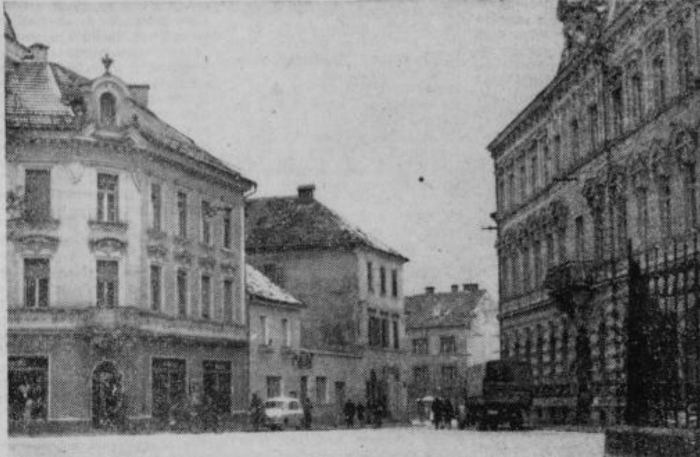
Gostilna »Pri Roziki« ima po ureditvi še več gostov