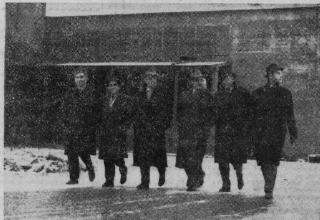
Zvezni poslanec tov. Zoran Polič v Kidričevem

Ta sredstva bodo uporabljena v naslednje namene: 1.322 milijonov ali 77,5% za neposredno gradnjo stanovanj, kjer bo investitor občinski stan. sklad, 60 milijonov ali 3,5% za posojila osebam v delovnem razmerju, 50 milijonov ali 2,9% za posojila hišnim svetom, 81 milijonov ali 4,7% za ožjo komunalno ureditev, 135 milijonov ali 7,9% za gradnjo poslovnih pro-