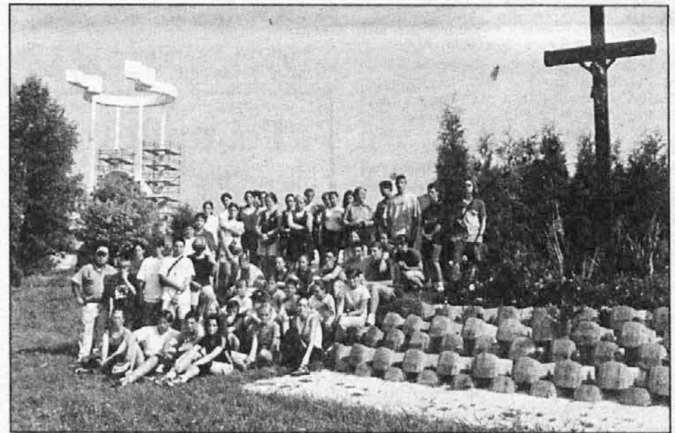
Abiturienti so tudi počastili spomin pobitih v Teharjah.

Zadaj se vidi še nedokončano spominsko obeležje: Kristusova krona.