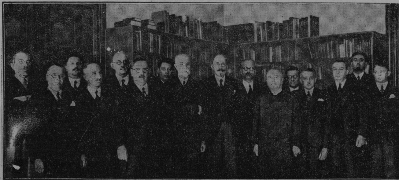
Nová vlada na Čehoslovaškem. Na sredini je predsednik republike Masaryk. Na sliki vidimo dolgoletnega ministra duhovnika dr. Šrameka.