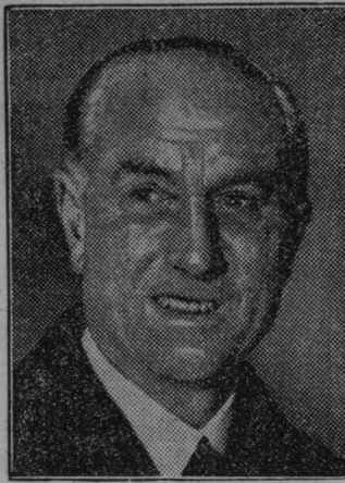
Novi angleški zunanji minister Samuel Hoare.