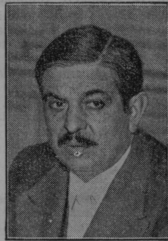
Predsednik nove francoske vlade Laval.