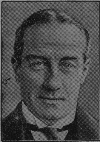
Predsednik nove angleške vlade Baldwin.

Vse potrebščine za vkuhanje. Čas za vkuhanje raznega sadja in sočivja bode kmalu tukaj! Priporočamo gospodinjstvom, da se pravočasno na to pripravijo! Pcučne knjige in