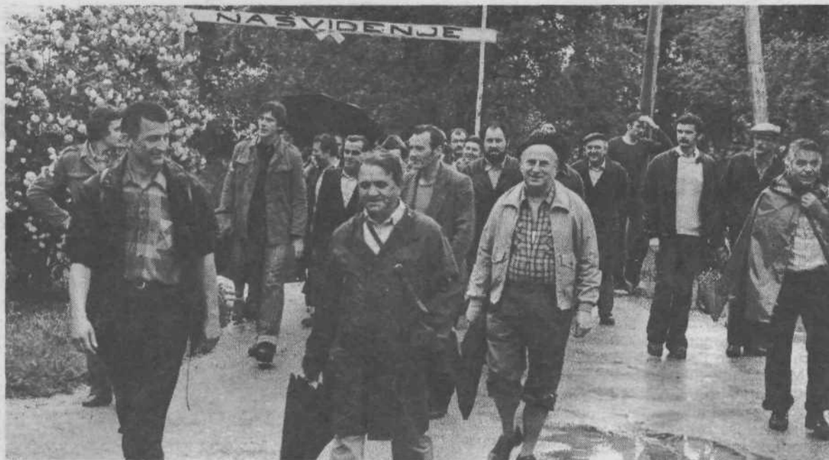
Če prej ne, pa čez leto dni...