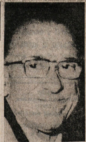
Tajnik španske KP Santiago Carrillo

MOSKVA — Letošnje proslave ob letnici oktohrske revolucije so za dobile svojstven značaj: manifestacija, ki naj bi po namenu prirediteljev izvenela kot slavospev dosežkom revolucije v Sovjetski zvezi in v znamenju predčvrstajenja poteka v svetluje predčvrstajenja in polemičnega dialoga Breznjev - Berlinguer, včeraj pa je bil dogodek dneva prepoved španskemu komunističnemu voditelju Santiagu Carrillu, da bi govoril na slavnostni seji. Evrokomunizem je torej protagonisti letošnjih proslav v Moskvi, čeprav ga nihče od udeležencev svetovnosti ne imenuje s tem imenom. Če se je prvi dan obrnila na ravni dialektičnega spopada med voditeljema sovjetske in italijanske partije, je pa včeraj že zadobila oblike živčnega obračunavanja.