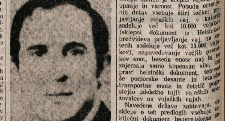
oče ubit. Hkrati je bil ranjen iamberti, za katerega so si zadržniki bolnišnice Fatebenefratelli prizdrali prognozo. Začetna preiskava je pokazala, da gre pri zločinah za pobege zapornikov, ki so sedeli v Verdeliju in Astiju. (dz) Na slikli (teletoto ANSA) žrtev roparjev.

DAKAR — Francoska vlada hoče doseči čimprej izpustitev francoskih državljanov, ki so jih pred nekaj meseci zajeli pripadniki gibanja «Polisario», ki se zavzema za osamosvojitve bivše španske Sahare, ki sta si sosednja Mavretanija in Marok dejansko razdelila. Po mnenju političnih opozovalcev, Elizej namreč ne more odstopiti od gorečih proglasov, ki so jih objavili nekateri večerni listi in ki so osvoboditev talcev proglasili za eno izmed prvenstvenih nalog zunanje politične dejavnosti Francije. V težnji za čimprejšnje rešitev Francija ne bi oklevala iti pri izbiru odločilnejših posegov, kakor so diplomatski, ki navadno ubirajo zelo dolga pota. V tem, prav nič prijateljskem duhu, gre torej tolmachi, prihod prave večje skupine francoskih padalcev — približno 350 — v operišče Onahan na Kapverdskem otoku v Senegalu. Francosko obrambno ministertvo je ob tem poudarilo, da nikakor ne ustvarja ozračja napetosti na tistem delu Afrike, kajti s poslanimi možmi ni kar skratka pomeni, da bi moral francosko - senegalske obrambne pogodbe. Po sporazumu s svojo bivšo kolonijo, ki med drugim meji na Mavretanijo, ima Francija lah-