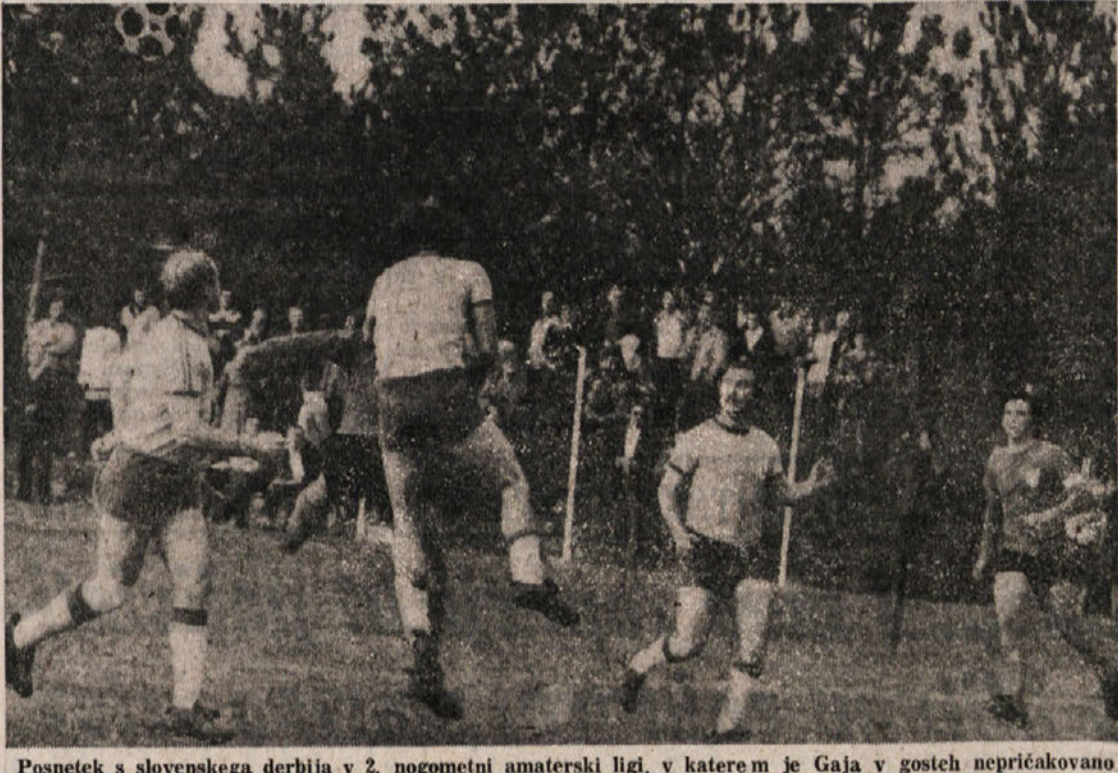
Posnetek s slovenskega derbija v 2. nogometni amaterski ligi, v katerem je Gaja v gosteh nepričakovano premagala trebenskega Primorca