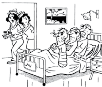
Jej, jej, jej, še ena nesreča na stezi za bob ...

Zakaj so govorili o mesečnih obrokih tisti, ki mi zdaj pošiljajo opomine vsak teden?