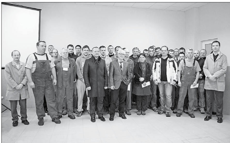
Za zelo dobro delo v podjetju je bilo nagrajeno 23 zaposlenih, na fotografiji so v družbi predlagatelj, vodstva podjetja in župana Franja Naraločnika.