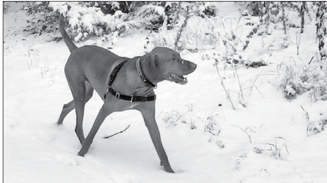
Vsak prosto gibajoč pes lahko v tem času povzroči veliko škode na divjadi. V letu 2013 so v Kamniško-Savinjskem lovsko upravljavskem območju psi pokončali 51 osebkov srnjadi.

So obdobja, ko narava rabi našo pomoč, zdaj je takšen čas. Zato še enkrat prošnja vsem lastnikom psov, da jih na sprehode vodite samo na povodcu.