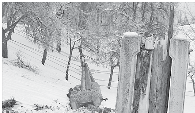
Naravna ujma je povzročila izpade električne energije in veliko škodo na omrežju.

Savinjske doline največ težav na območju Logarske doline, kjer je bilo brez elektrike 212 in na območju