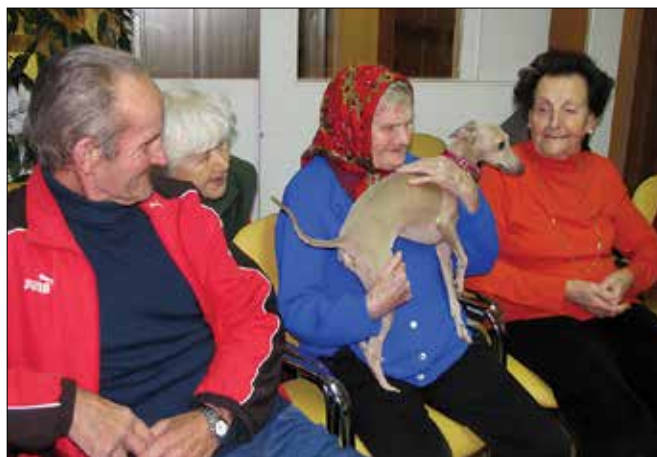
Psički iz društva Kosmati smrčki so stanovalcem Doma za varstvo odraslih Velenje takoj zvalili nasmeške na ustnice in lepo popestrili njihov dan.

Pri njih kinološke urice, ki jih v večini in vedno prostovoljno izva-