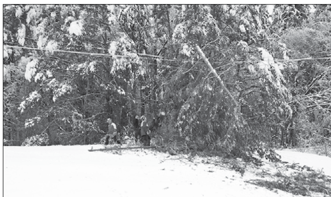
V gornjegrajski občini so se potrudili in se posledic žledoloma lotili sami, brez pomoči vojske. Največja škoda je na gozdovih in električnem omrežju.

moči, ki so jo organizirano izvajali gasilci, sekači, vzdrževalci lokalnih gozdnih prometnic, štab civilne zaščite ter ostalo tehnično osebje. Izvajala so se tudi de-