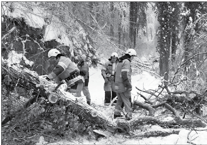
Veliko gasilcev je bilo angažiranih v gozdovih z delom z motorno žago.

ske zveze in član upravnega odbora Gasilske zveze Slovenije, ki predstavlja Savinjsko-Saleško regijo, je bilo treba nujno preveriti, ali so ljudje na varnem, ali potrebujejo kakšno nujno pomoč, so med njimi bolniki ali poškodovanci.