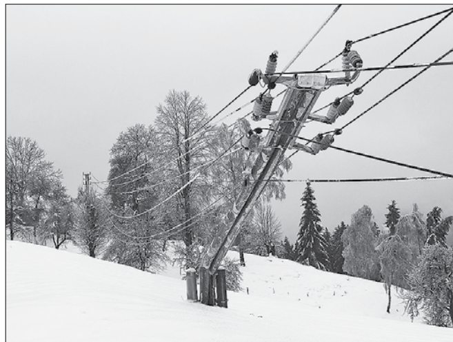
Težave z dobavo električne energije v ujmi potrjujejo, kako nujno potrebno je zagotoviti kablovod od Nazarij do Ljubnega ob Savinji.