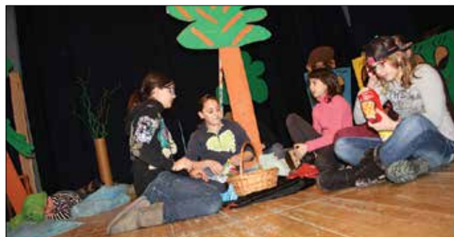
Otroci so v igri na pikniku pod drevesom pustili pravo onesnaženje.