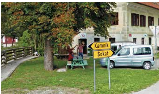
Gornjegrajčani v Uličnem pogledu pozdravljajo Googlov avtomobil.

ew oziroma Ulični pogled, ki je na svetovni splet v letošnjem letu lansiral tudi 360-stopinjski pogled na vse večje kraje naše doline.