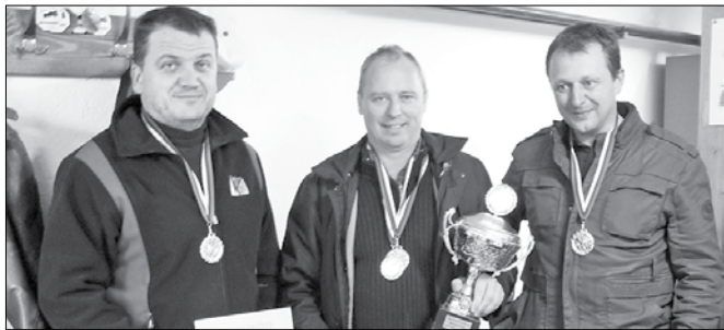
Zmagovita ekipa SD Gornji Grad 1, ki je prejela prehodni pokal v trajno last.

Prejšnji petek so se strelci, ki so sodelovali v rekreacijski ligi v športnem streljanju zračno puško v sezoni 2013/2014, pomerili še v zadnjem krogu lige v organizaciji SD Mozirje in si razdelili kolajne v ekipni in posamični konkurenci.