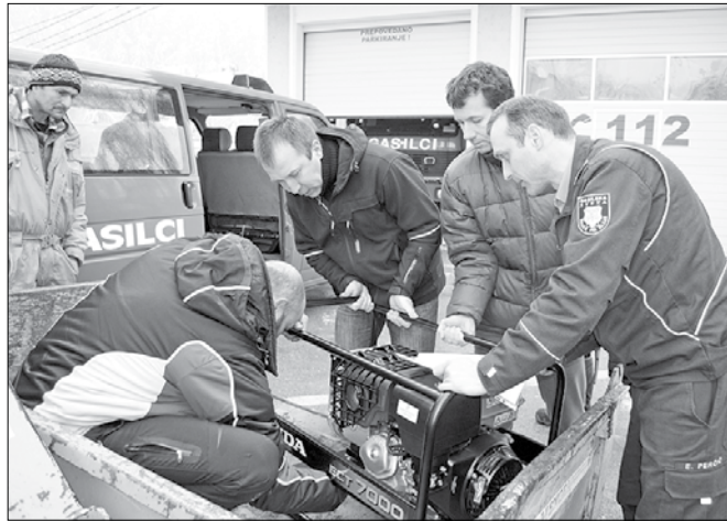
Agregate so dostavili gospodinjstvom iz oddaljenejših delov občine Ljubno, ki še niso imela električne energije.

Kocman je povedal, da se tudi v njihovi občini niso povsem izogni-