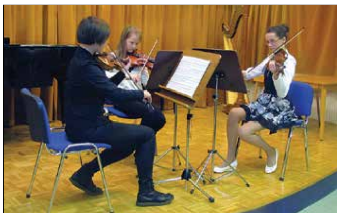
Na koncertu se je publiki predstavilo preko dvajset učencev s skupinskimi in individualnimi glasbenimi točkami.