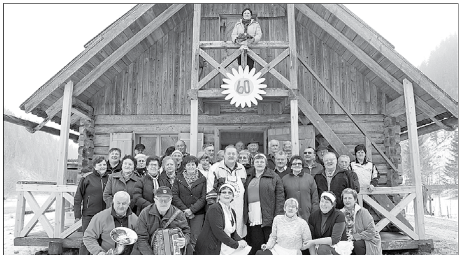
Lučki upokojenci nameravajo koč opremiti kot muzejsko zbirko.