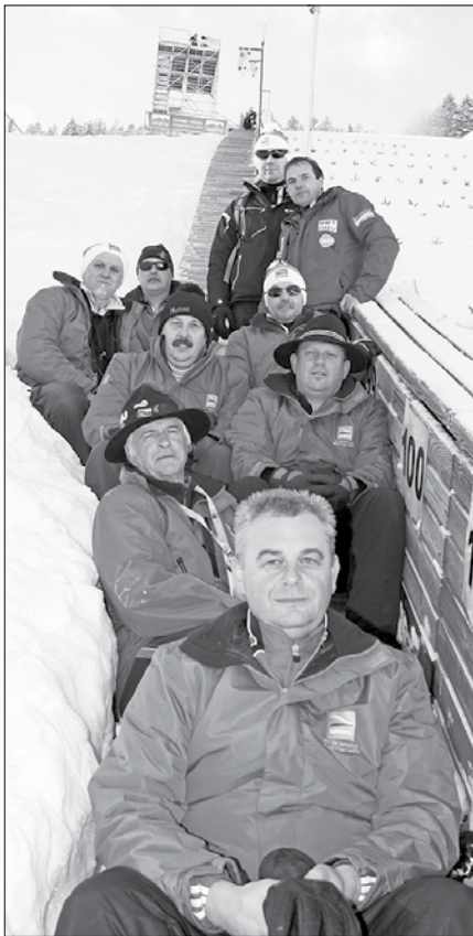
Prostovoljci z Ljubnega ob Savinji so v Planici opravili veliko delo, predvsem pri pripravi skakalnice.