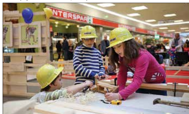
Otroci so ustvarjali za sedem izbranih kužkov iz zavetišča Zonzani.