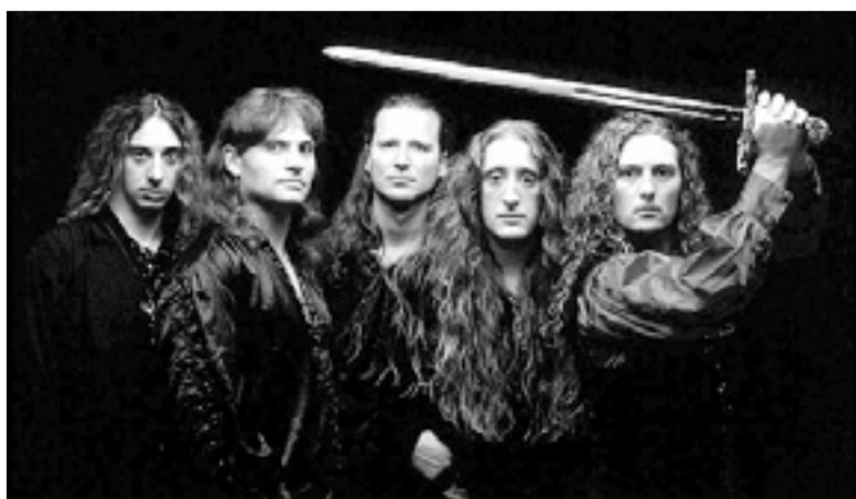
Tržaška skupina Rhapsody of Fire se bo prvič predstavila doma