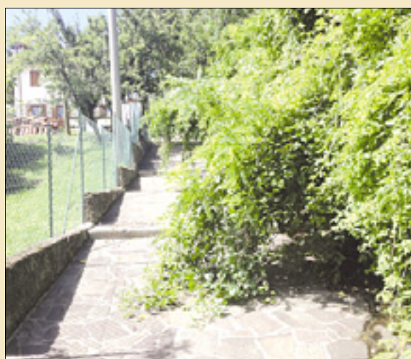
Zaraščena pešpot na Oslavju