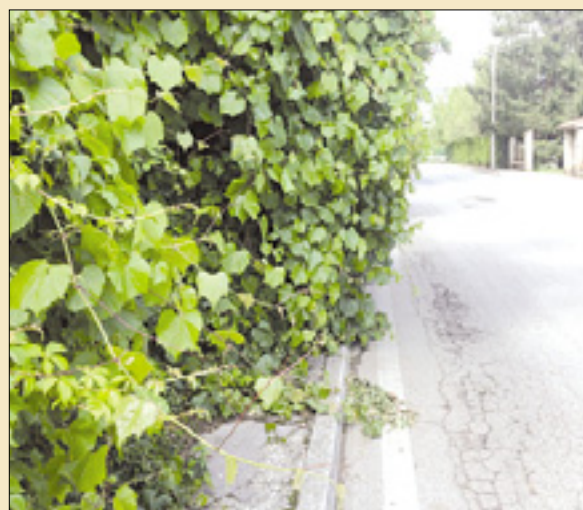
Zaraščeni pločnik v Podgori

Tako na Oslavju kot v Podgori se domačini pritožujejo zaradi zaraščene pešpote in pločnikov, za katere nihče ne poskrbi. Z Oslavja opozarjajo, da je pešpot, ki po Klanču vodi do spominske kostnice, že nekaj časa zaraščena. Vejeve, ki visi s sosednjega zapuščenega zemljišča, postaja v poletnih mesecih vse bolj vsiljivo, tako da bo verjetno v kratkem prekrilo celo pot. Narava prevladuje nad asfaltom tudi v Ulici Brigata Cuneo na začetku Podgore, kjer