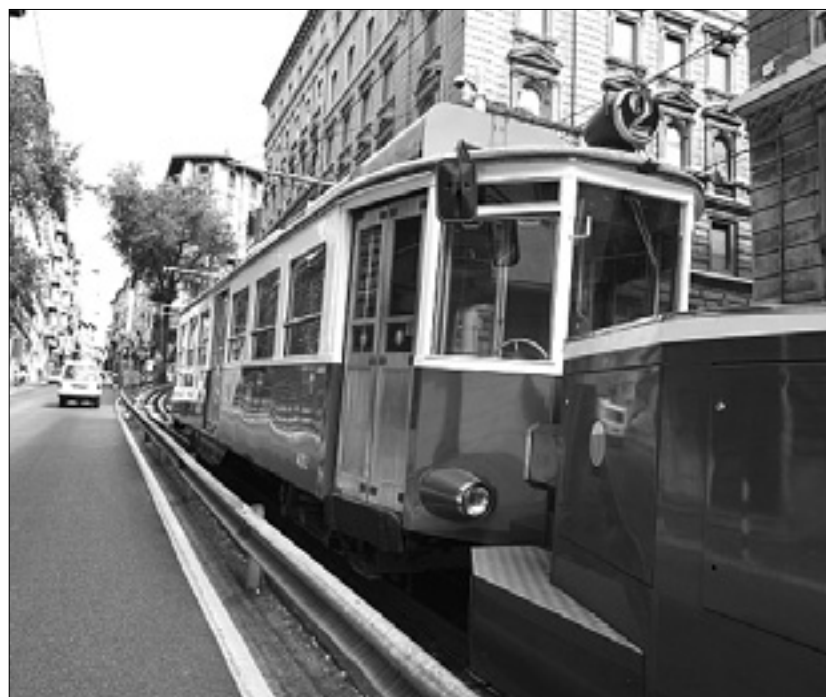
Desno: iztirjen tramvaj 3. septembra 2012; spodaj: obnova tračnic; levo: poskusna vožnja po obnovi

Ob ponovni vzpostavitvi tramvajske povezave je občinska uprava poskrbela tudi za zanimivo zgibanko-zemljevid, ki izletnikom in kolesarjem ponuja devet različnih poti po tržaški okolici. Odbornik Kraus se je zahvalil konzorciju Promotrieste, predvsem pa štirim društvom (Monte Grisa Insieme, Ulisse-Fiab, Bikeways in ASD Gentlemen), ki so z velikim navdušenjem in prostovoljnimi delom pripravili koristni zemljevid. V prihodnje naj bi izšle tudi angleška, nemška in slovenska različica. (pd)