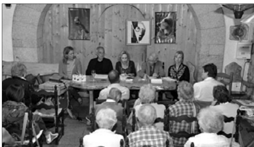
Zaradi dežja je predstavitev potekala v notranjosti Miličeve domačije