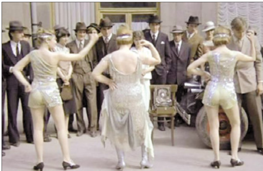
Prizor iz filma Splan Meduze režiserja Karpa Godine, ki ga bodo drevi predvajali v Rimu

Zvečer bosta v družbi slavnega režiserja Godine, sicer lanskoletnega prejemnika najpomembnejšega priznanja slovenskim filmarjem Badjurve nagrade, na ogled njegov celovečerni film Splan meduze, ki je leta 1980 prejel nagrado kraljevskega filmskega arhiva Belgije, in kratki film Zdravi ljudje za razvedrilo (Zdravi ljudi za razonodu, Litany of Happy People, 1971).