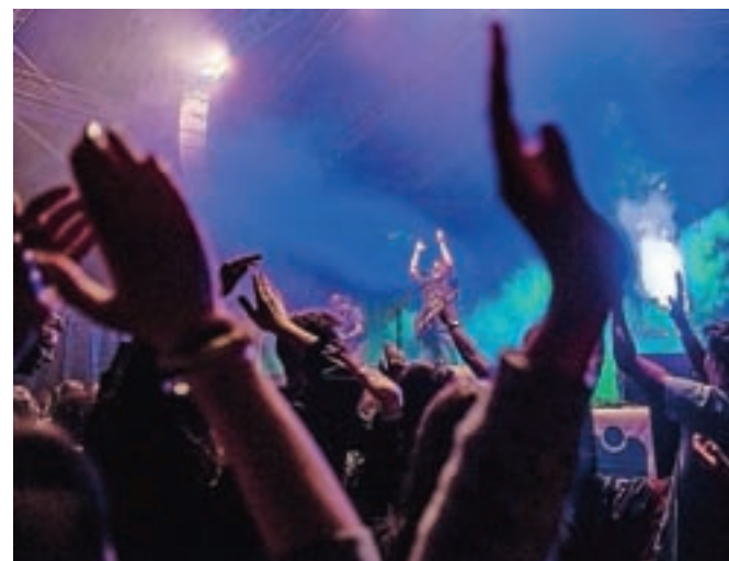
Največ obiskovalcev je na Glavni oder na Malem gradu v ponedeljek privabila novomeška rokovska skupina Dan D, ki je na Kamfestu letos nastopila prvič.