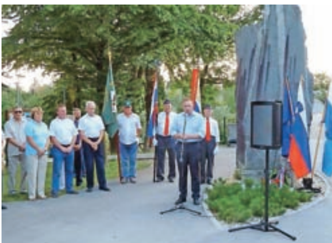
Spomenik pri Titanovi brvi je postavljen v spomin na prvi žrtvi druge svetovne vojne na Kamniškem.