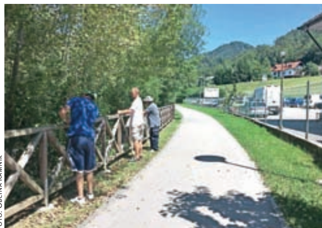
... in z barvanjem ograje in košnjo trave skrbijo za urejeno sprehajalno pot od Povezovalne ceste do Titanove brvi.