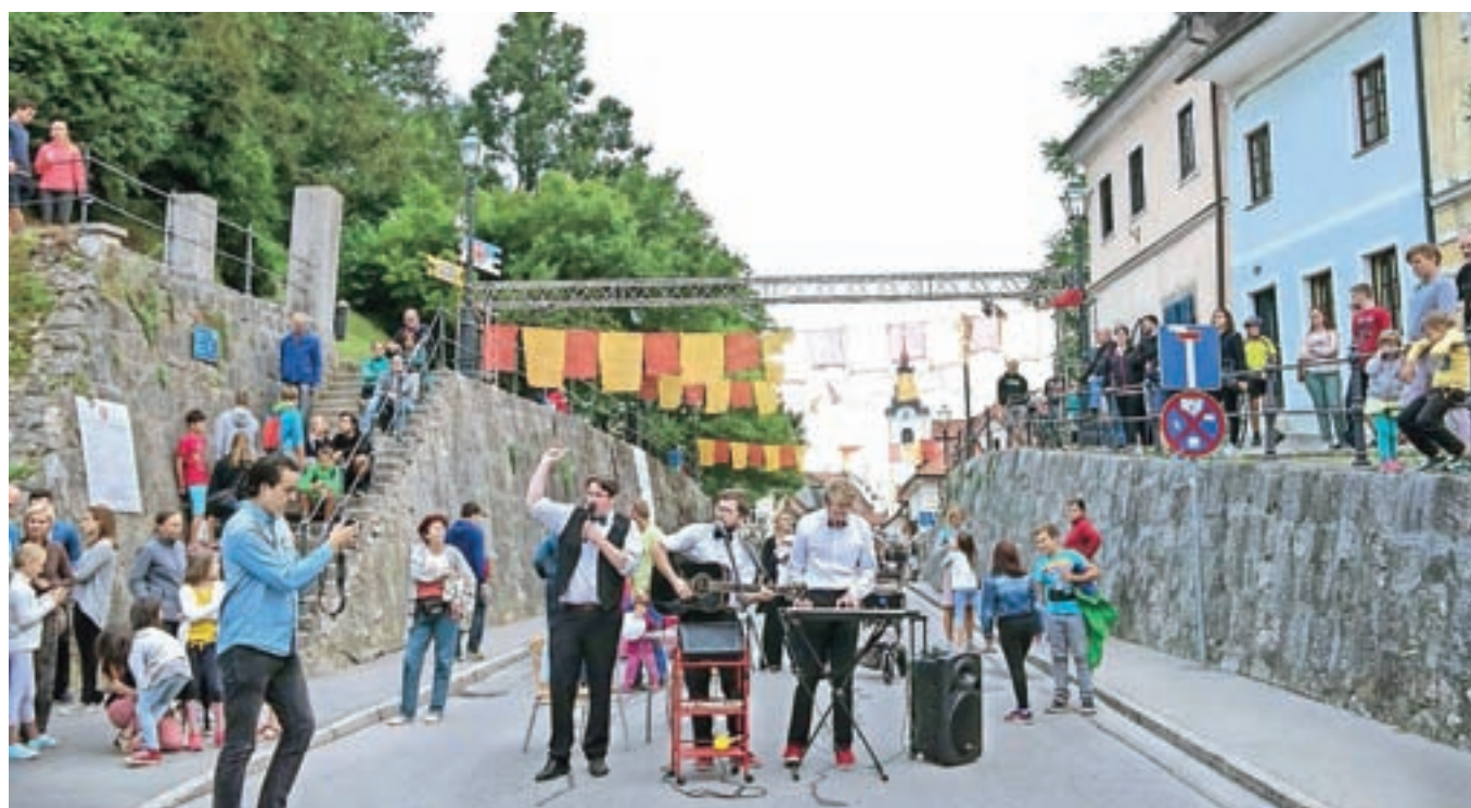
Letošnji Kamfest je postregel z več kot sto dogodki na različnih prizoriščih, tudi v Samčevem predoru, festival pa bo mesto polnil še do jutri zvečer.

Jutri, 20. avgusta, se bo s koncertom zagrebške skupine Hladno pivo iztekla že trinajsti poletni festival Kamfest, ki je mestno središče oživil vse od minulega petka. Organizatorji so z obiskom zelo zadovoljni, čeprav brez vremenskih nevšečnosti tudi letos ni šlo.