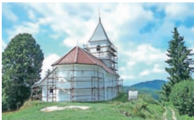
Cerkev svetega Ahacija v Kališah je dobila novo fasado iz apnenih ometov.

Mekinj ob strokovni podpori kranjskega zavoda za varstvo kulturne dediščine lotila obnove fasade, v prezbitერიju so odkrili tri gotška okna ter poslikave s šivanimi vogali in ornamentmi. Gradbena dela bodo zaključena do konca avgusta, saj bo v cerkvi, ki je sicer podružnica Župnije Gozd, 4. septembra žegnanjska nedelja.