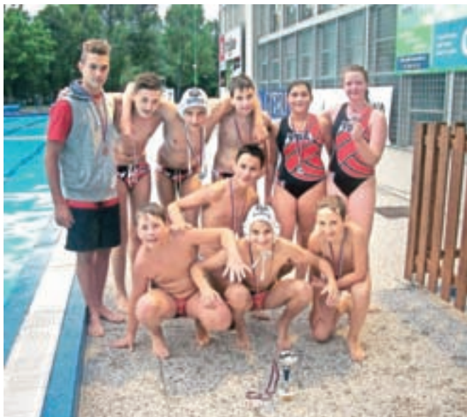
Ekipe članov vaterpolskega društva Kamnik do 14 let