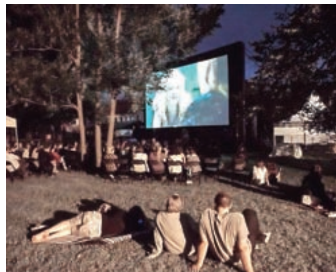
Keršmančev park je bil letos tudi prizorišče Kina Kamfest, ki je postregel s projekcijo treh filmov pod milim nebom. V torek zvečer so obiskovalci takole uživali v slovenski akcijski grozljivki z naslovom Idila, predvajali pa so še filma Čisto nova zaveza in Šiška Deluxe.