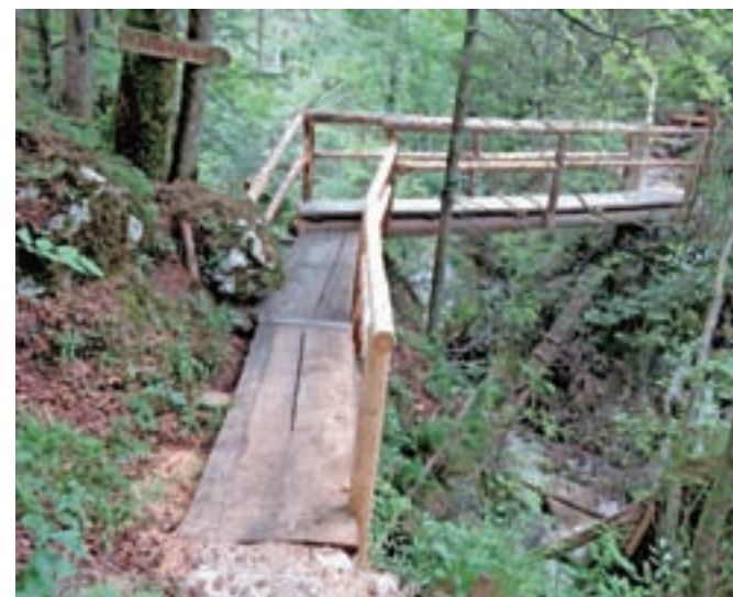
Nov mostič čez Prošek omogoča varnejši dostop do spominskega parka v Kamniški Bistrici.