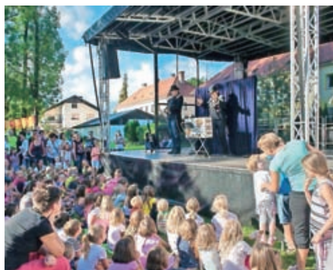
Tudi po osemsto obiskovalcev dnevno v času Kamfesta privabi Keršmančev park, kjer pa je poleg Otroškega odra letos tudi Oder v parku. Dogajanje za najmlajše se začne vsak dan ob 18. uri, jutri se bo druženje najmlajših zaključilo s predstavo Zavoda Bufeto.