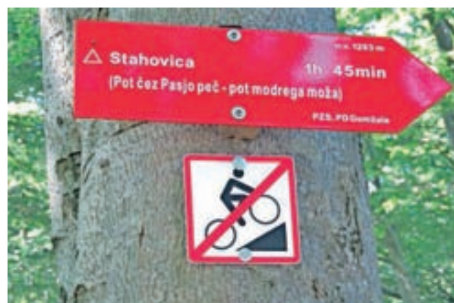
Na prepoved vožnje s kolesi po planinski poti opozarja tudi poseben znak.

Že kar nekaj let je od tega, kar se je zelo razmahnilo turno kolesarstvo pa tudi kolesarski spusti po strmih poteh izven običajnih javnih prometnic. Glede na to, da se kolesarji vozijo skoraj povsod, je v več zakonih in predpisih urejena uporaba posameznih vrst poti. Bistvo vseh predpisov je v tem, da je vožnja s kolesi dovoljena na gozdnih cestah, če z režimom uporabe gozdne ceste ni določeno drugače, na gozdnih vlakih in drugih poteh, pa samo, če so označene. Vožnja s kolesi ni dovoljena izven javnih poti in tudi po planinskih poteh, ki ne potekajo po poljskih poteh in gozdnih prometnicah, razen po poteh, ki jih določi minister, pristojen za šport, in so označene. V kamniških planinah se do sedaj še ni uspelo dogovoriti in tudi označiti planinskih poti, na katerih bi bila dovoljena tudi vožnja s kolesi, čeprav se na tem že intenzivno dela. Dovoljenje za uporabo planinske poti za vožnjo s kolesi mora dati tudi lastnik zemljišča, preko katerega poteka pot. Zatorej za sedaj vožnja po njih ni dovoljena. Posebej pa je prepovedana po poti s Kisovca čez Pasjo peč do Sv. Primoža, na kar opozarja poseben znak.