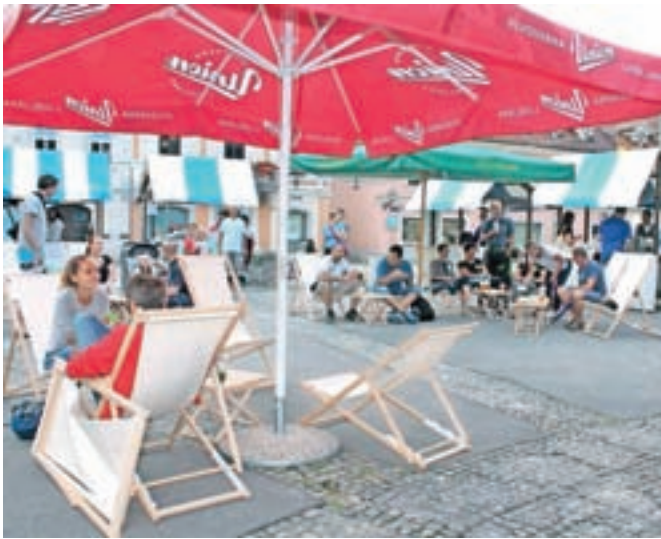
Prvi večer Kulinaričnega vikenda se je Glavni trg spremenil v dnevno sobo.