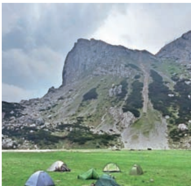
Plezalni tabor Pipa miru na Petkovih njivah

ružili še nekateri tečajniki, tako da je bilo večerno druženje še živahnejše. Kljub slabšim napovedim je vreme zdržalo tako v petek kot tudi v soboto. Ker se nam ni ljubilo kuhati, smo se v soboto nekateri odpravili v kočo, kjer nas je Keli razveselil s kitaro. Sledil je kar