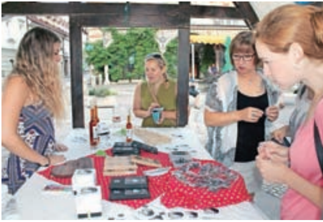
Kombinacija sladkih in bolj slanih okusov čokolade s trničem je k stojnici privabila kar lepo število obiskovalcev Kulinaričnega večera na Glavnem trgu.