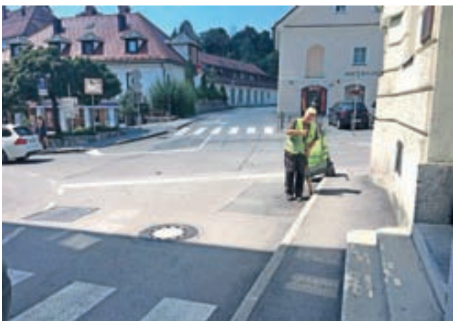
... praktično vsakodnevno pometajo in čistijo ulice starega mestnega središča ...

»Občina Kamnik je hvaležna javnim delavcem in zelo ponosna na njihovo delo in trud, saj s pridnostjo vsakodnevno dokazujejo, da so predani svojemu delu, kar se posledično kaže v urejenosti mesta Kamnik. Lepo bo bilo, če bi tudi občanke in občani poskrbeli, da njihovo delo ne bo zaman,« pa pravi na Občini Kamnik.