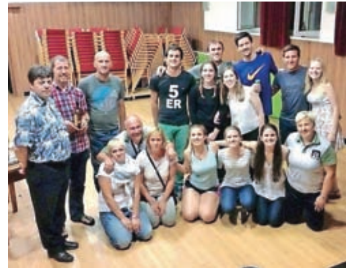
Mladi igralci iz Argentine so na veliko veselje publike zaigrali tudi na Lazah.

enti so si kar sami organizirali skupinsko terapijo, s katero so želeli premagati svoje težave – obsesivno kompulzivno motnjo (španska kratica zanjo je TOC). A kaj, ko je kmalu v mirni čakalnici nastala prava zmešnjava, ki je gledalce v dvorani neizmerno zabavala, saj so nastopajoče nagradili z bučnim aplavzom. Po predstavi je Kulturno društvo Tuhinj igralce tudi pogostilo, slovensko-argentinski prijatelji pa so še dolgo v noč obujali spomine,