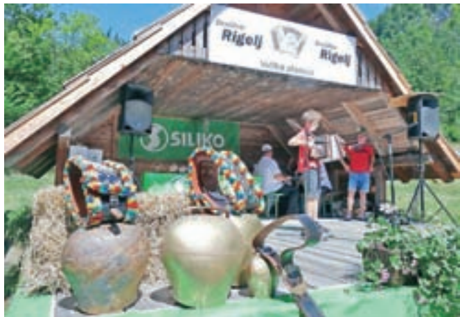
Jubilejnega tekmovanja se je udeležilo 55 harmonikarjev.