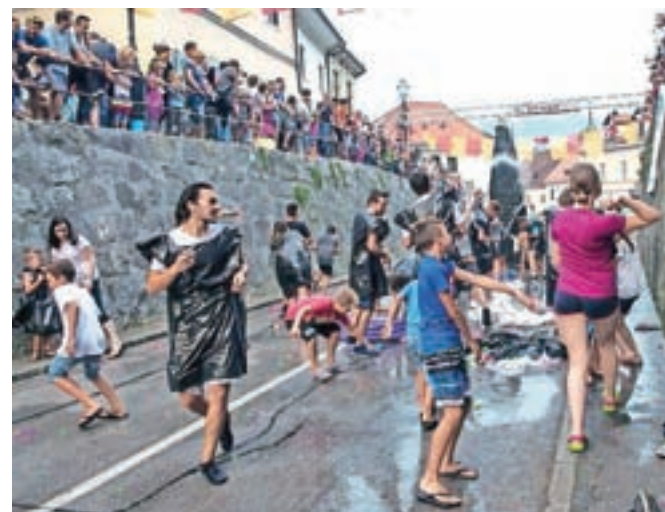
Samčev predor je bil v torek priča pravemu spopadu, a orožje so bili vodni baloni. Dogodek so organizirala društva, ki skrbijo za program v Parku mladih, med seboj pa sta se pomerili dve, na koncu premočeni ekipi.