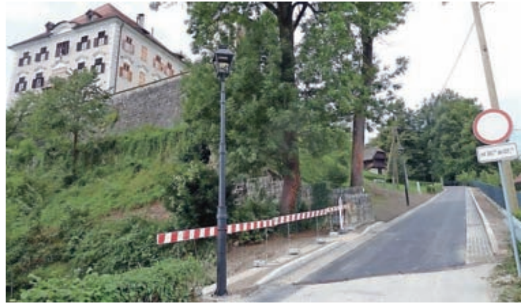
Do muzeja na Zapricah vodi na novo asfaltirana in osvetljena Muzejska pot.

»Za obogatitev turistične ponudbe Kamnika in muzeja je