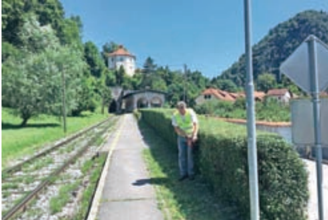
Javni delavci po Kamniku in okolici med drugim urejajo žive meje ...

Skrbijo za čiščenje plevela na javnih površinah ob Ljubljanski, Kranjski, Steletovi, Cankarjevi in Kovinarski cesti, na Žalah, v Industrijski coni Perovo, na območju Mekin in Godiča, na Novem trgu, ob Šolski ulici, Kajuhovi poti in marsikje drugje, urejajo žive meje,