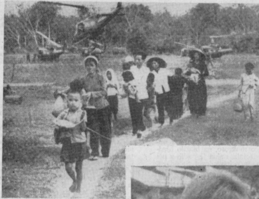
VSADKANJA SLIKA V VIETNAMU. AMERICANI SELIJO CIVILISTE V TAKO IMENOVANE »STRATESKE VASI«. KJER NE BODO V NEVARNOSTI PRED KOMUNISTI. ZA NAS JE IZ IZKUŠNJE JASNO, DA PREGNANCI POTUJEJO V KONCENTRACIJSKA TABORIŠČA.