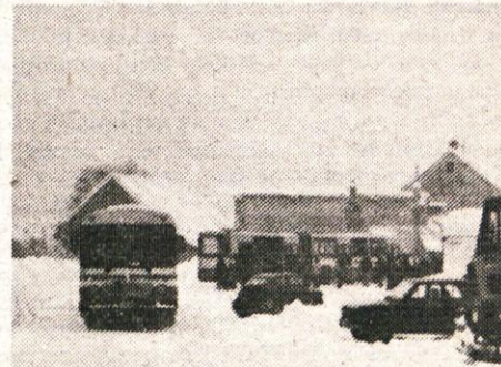
Stalno dežurstvo na avtobusni postaji je pomagalo, da je bila ta očiščena, avtobusi pa dva dni edina javna prometna vez z Ljubljano

Po obilnem sneženju pred slabim mesecem dni je bilo naslednje dni padavin precej manj, tako da sneg pretiranih težav ne povzroča več, čeprav je snežna odeja ponekod še vedno debela slab meter. Toliko snega pri nas ni padlo že od leta 1952, ko je bila Gorenjska skoraj »skrita« pod snegom.