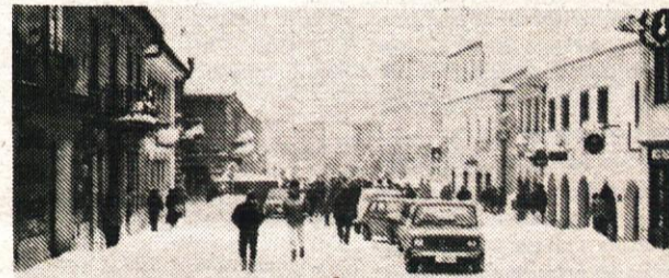
Prehodno, čeprav zasneženo mestno jedro