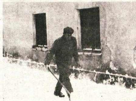
Pa naj še kdo reče, da tudi občani nismo pomembni pred svojim pragom