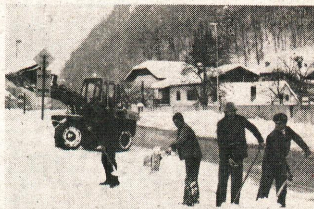
Snežiti je nehalo, povečala pa se je zagnanost pri čiščenju obvoznice