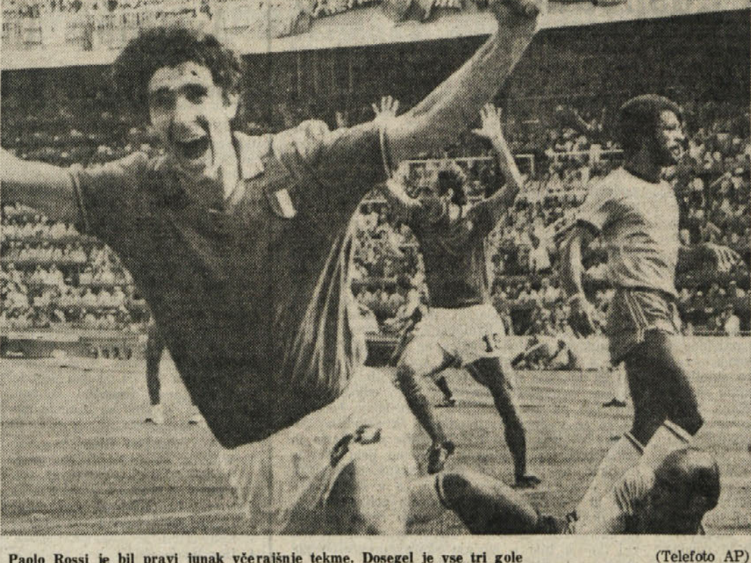
Paolo Rossi je bil pravi junak večerašnje tekme. Dosegel je vse tri gole