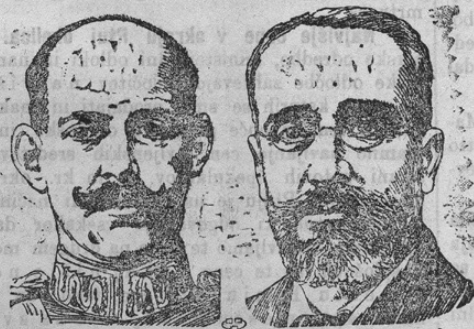
König Konstantin v Griechenland Ministerpräsident Venizelos zur Krisis in Griechenland

Z ozirom na napete politične razmere na Grškem, prinašamo sliko grškega kralja Konstantina in grškega ministerskega predsednika Venizelosa. Medtem ko je bil prvi vedno osrednjima državama naklonjen, stoji Venizelos, ta stari lisjak, z vsem srcem na strani naših nasprotnikov. Ker še na Balkanu doslej ni prišlo do odločilnega diplomatičnega sporazumljenja, je vendar upati, da ga dovede modromisleči grški kralj do — treznosti.