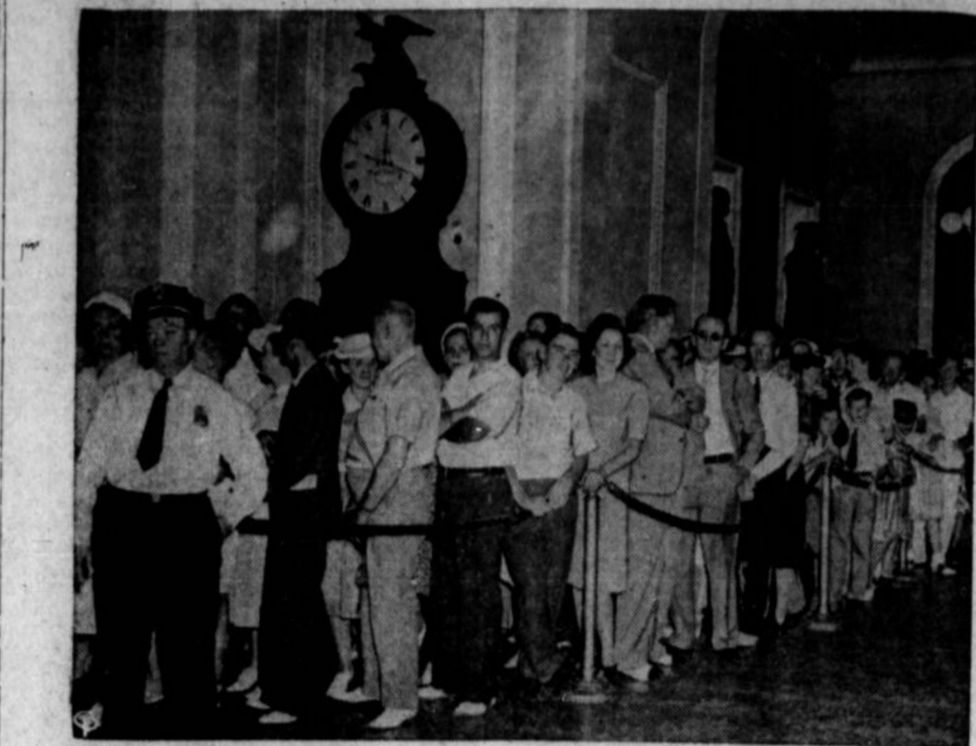
Vselej, kadar se je v zveznem senatu razpravljalo o predlogi za obvezno vojaško službo, se je dregajlo mnogo ljudi, posebno mladine, ki bi bili radi dobili prostora na galeriji za poslušalce. Gornja slika prikazuje one, ki so prišli v senatno vežo ure pred pričetkom zasedanja, da bi gotovo dobili prostor.