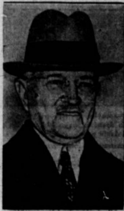
GENERAL JOHN J. PERSHING

til marsikoga, kajti večina onih Američanov, ki so imeli v času prejšnje svetovne vojne odgovorne službe, se ne ogrevajo za sodelovanje v Anglijo na "celi črti". Nekateri so sploh proti "vojni" toliko, da če bi bilo po njihovem, ne bi dali Angliji niti zita na prodaj, zato ker ga vled angleške blokade Nemčija ne more dobiti od nas.