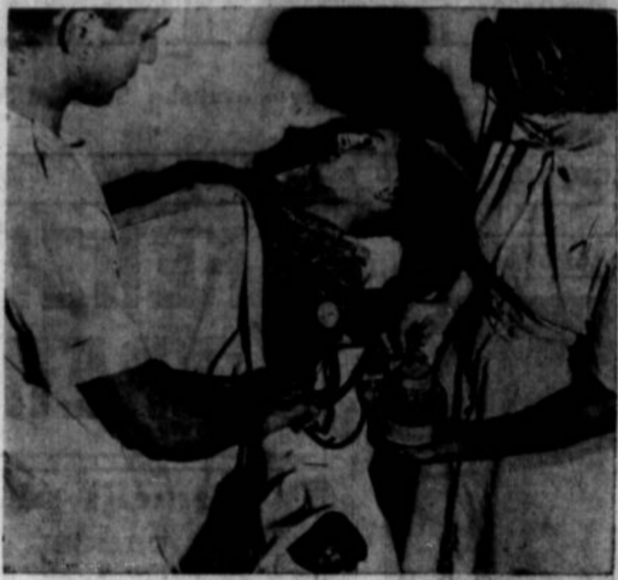
Rdeči križ išče ljudi, ki bi bili pripravljeni dati primerno količino krvi v prid zdravljenja ranjencev v Angliji in za rezervo v slučaju, da jo bo potreboval medicinski oddelek ameriške armade. Slika predstavlja, kako od vzemajo nekemu kri v omenjeni namen.